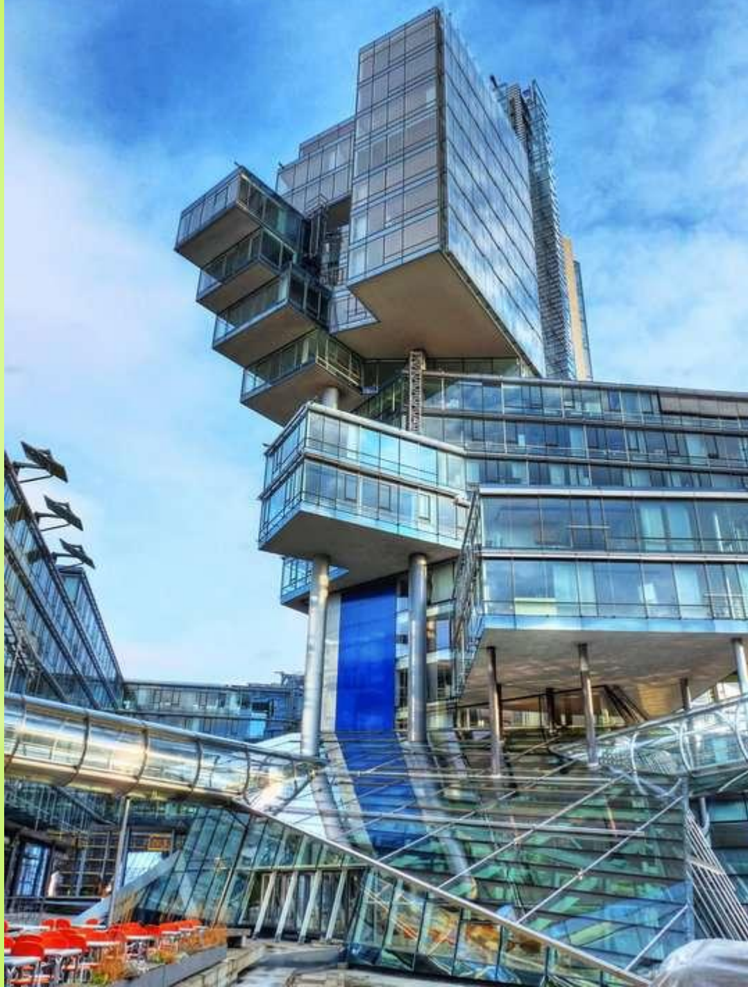
Nord LB building в Ганновере, Германия