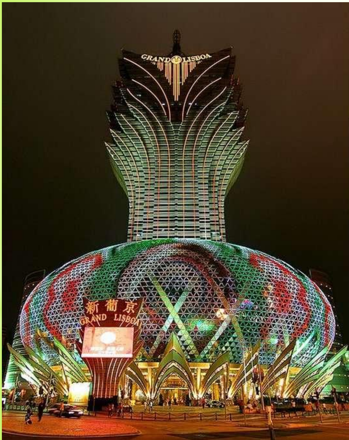
Отель-Казино Grand Lisboa. Макао, Китай