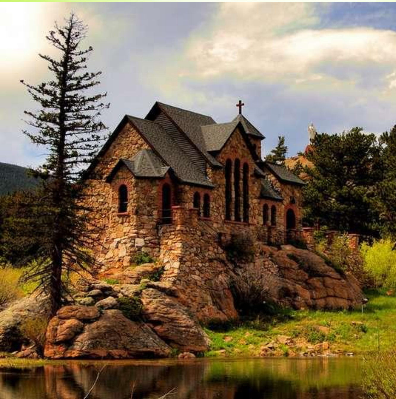
Часовня на горе. Сен-Мало