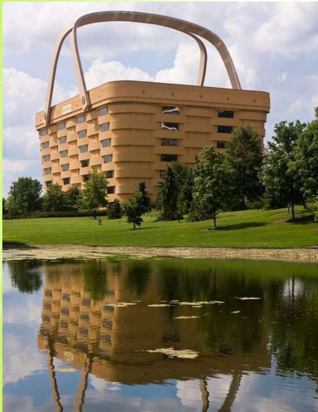
Здание-корзина. Огайо, США