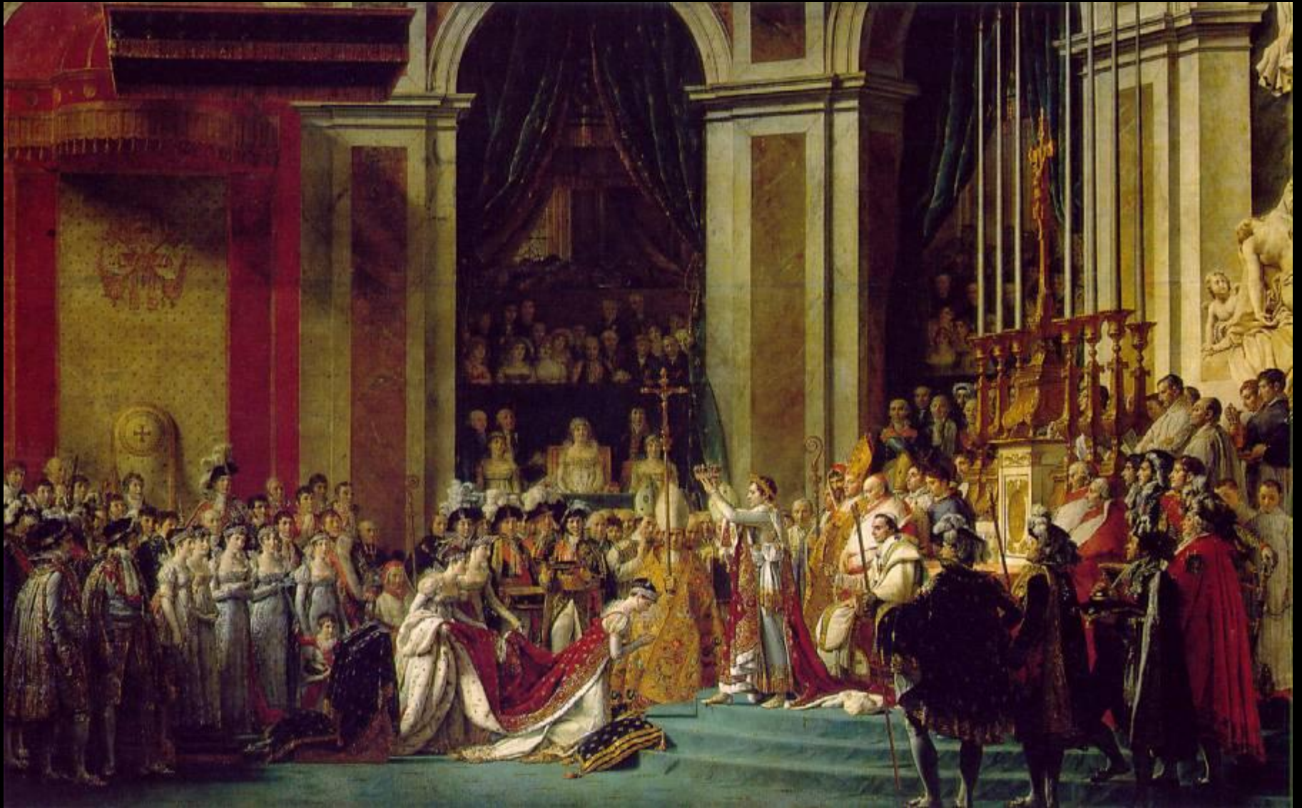
Коронация императора Наполеона 1 и императрицы Жозефины в соборе Парижской Богородицы 2 декабря 1804 года. 1806-1807