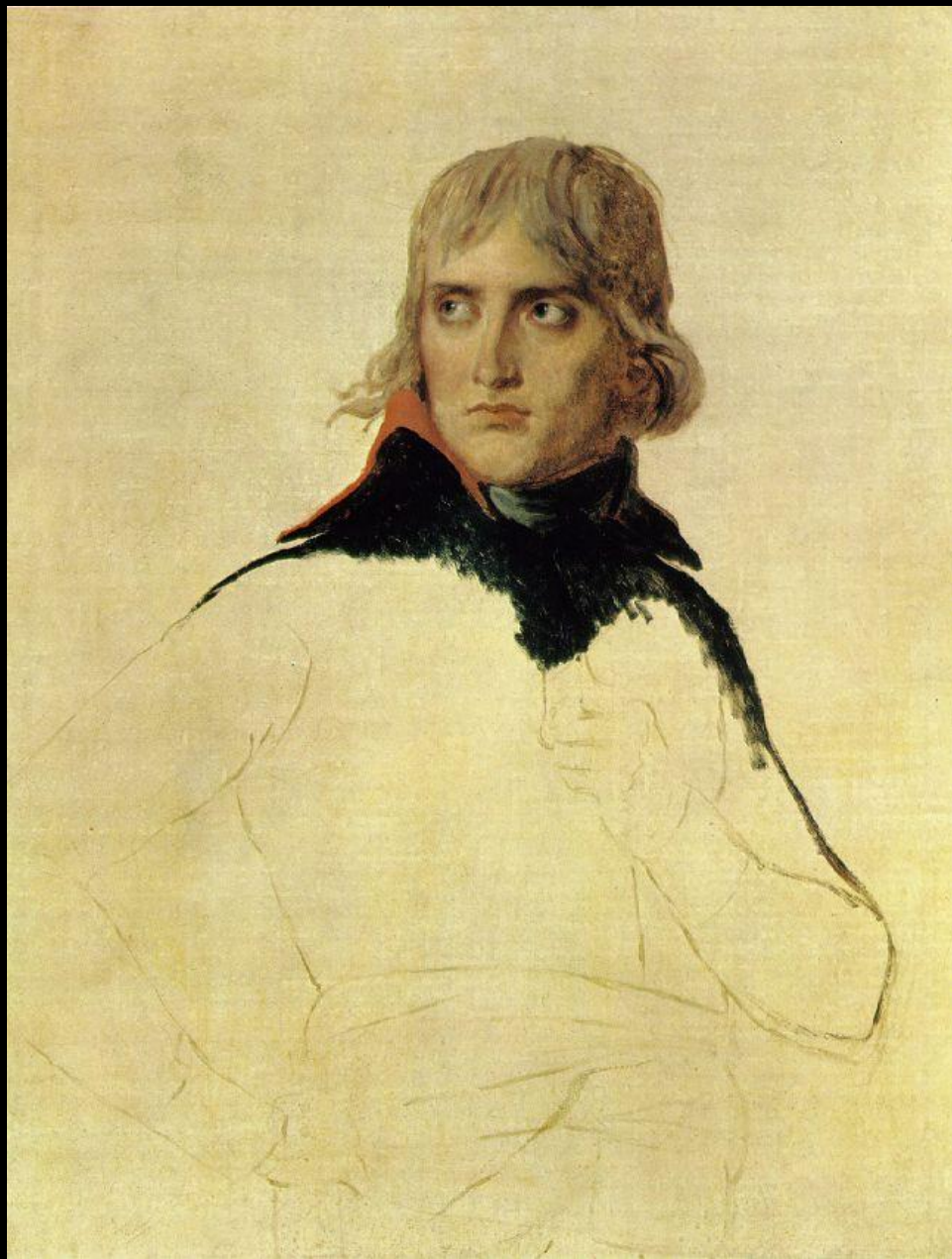
Портрет Бонапарта. 1797