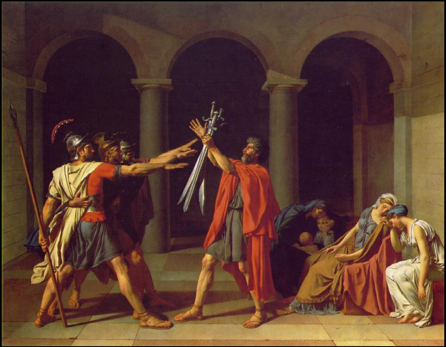
Клятва Горацев. 1784