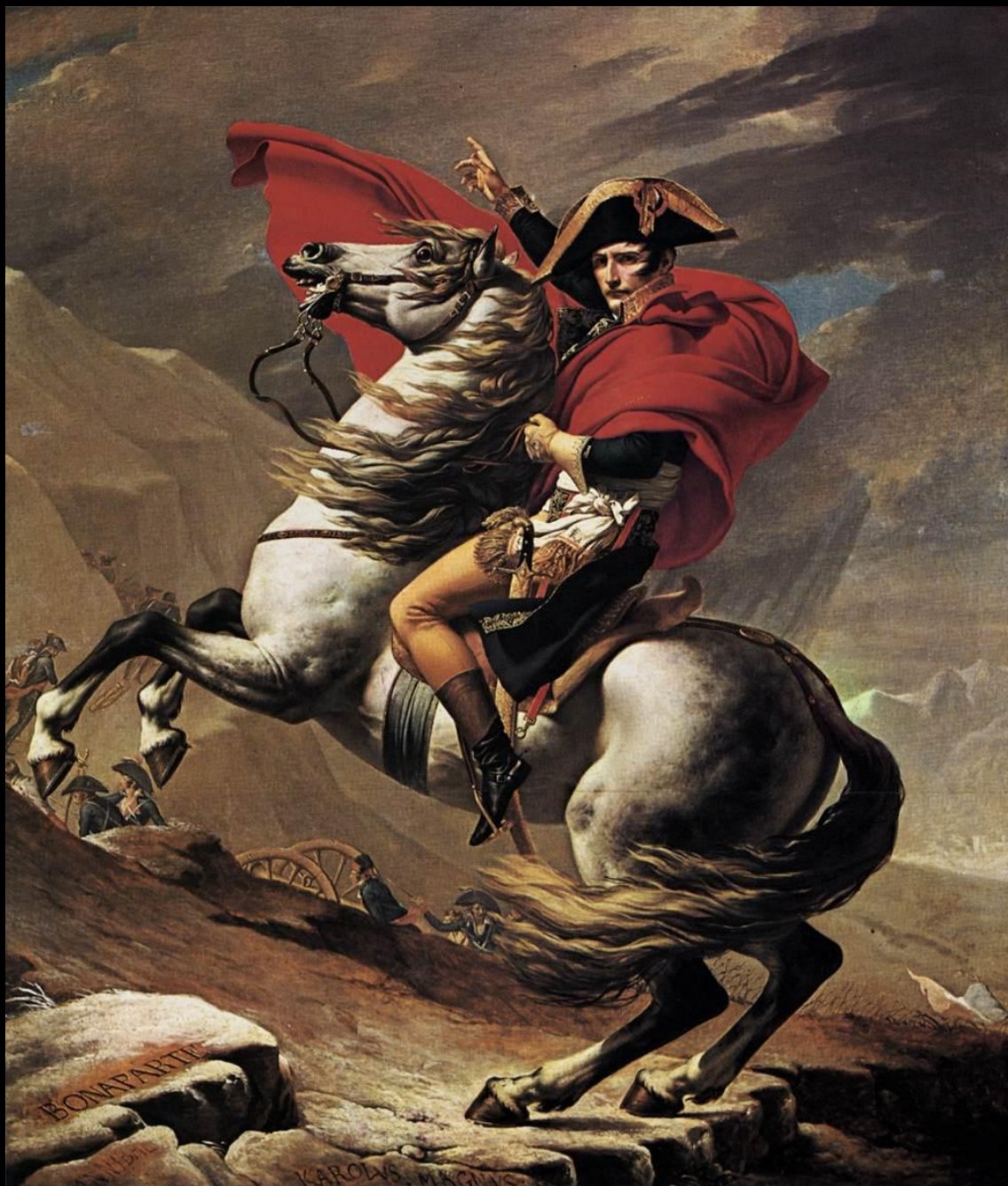
Переход Бонапарта через перевал Гран- Сен-Бернар. 1800