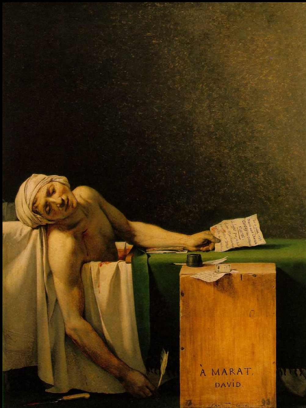
Смерть Марата. 1793