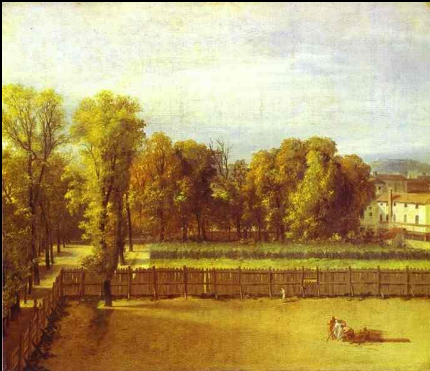
Вид Люксембургского сада. 1794