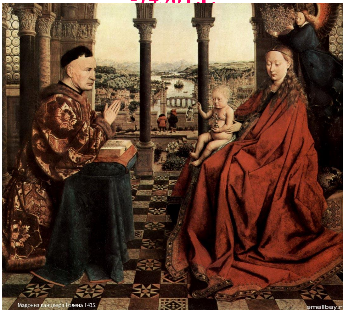
Мадонна канцлера Роллена 1435.