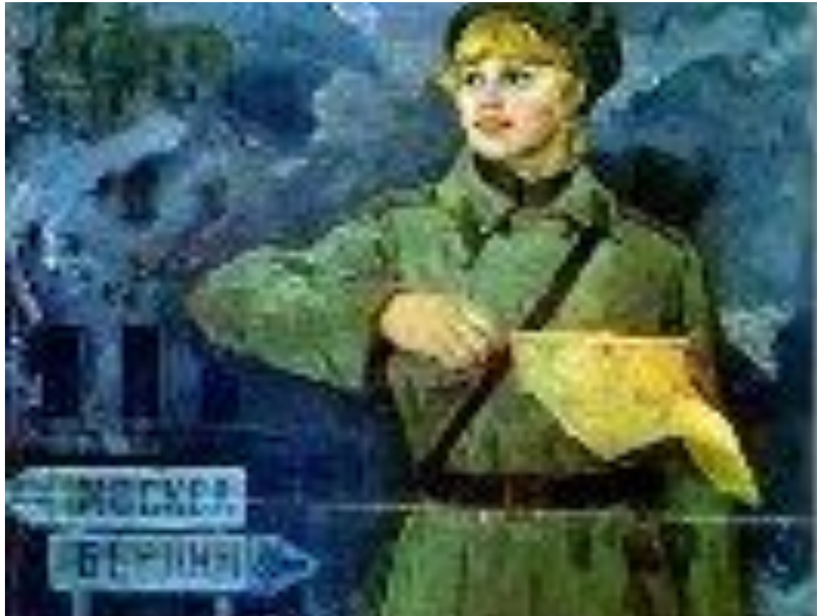
Дорога на Берлин