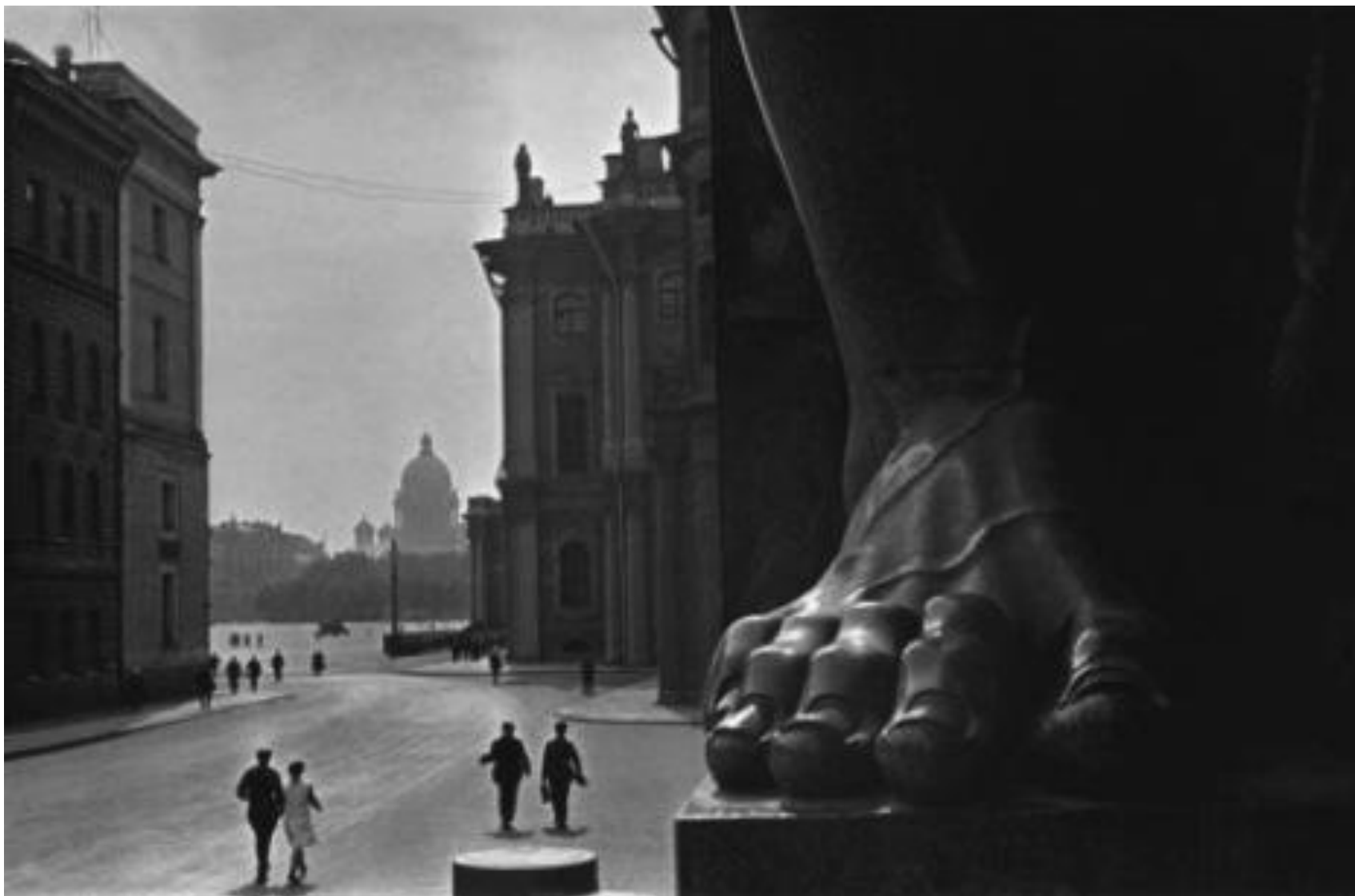
фотография начала 30-х годов XX века Бориса Игнатовича — классика отечественной фотографии.