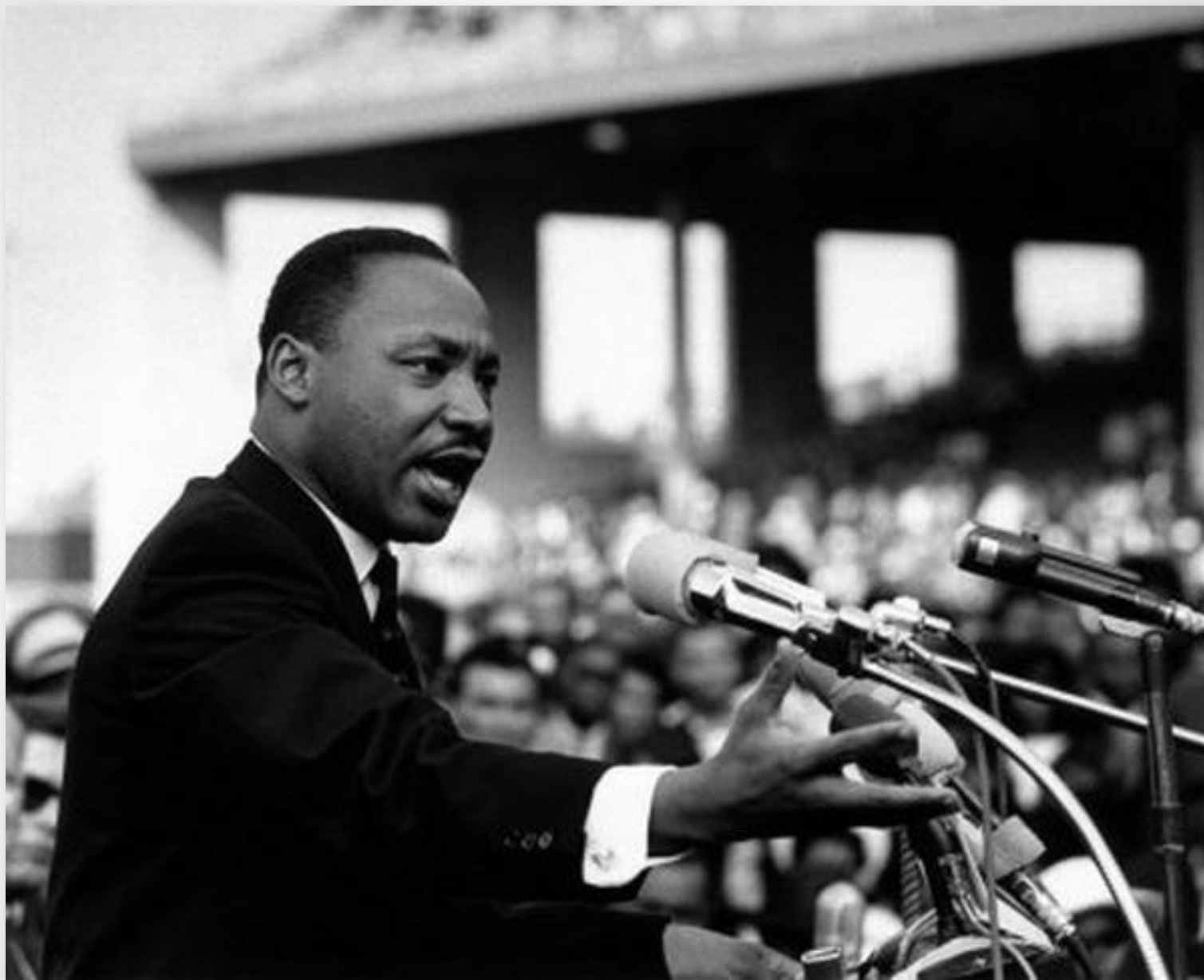
• • Мартин Лютер Кинг