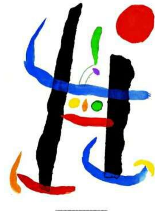
"При любом испытании"