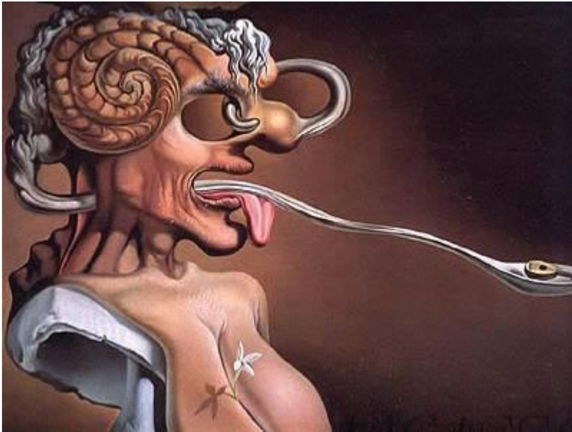
Портрет Пикассо. 1947 г.