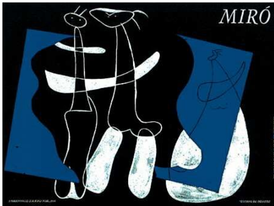
"3 персонажа любящие ночь"