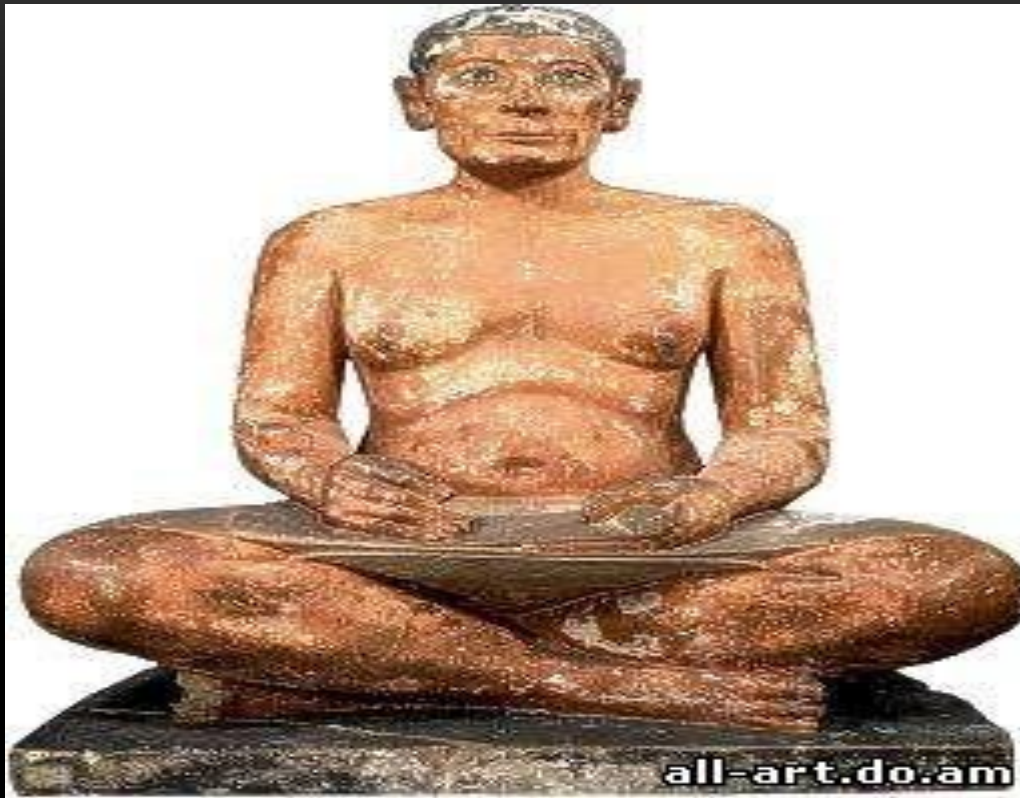
Сер. 3-го тыс. до н. э. Лувр. Париж

В 1850 году служащий Лувра Франсуа Огюст Фердинан Мариет по поручению директора музея был отправлен в Египет за коптскими рукописями, которые в результате обмана так ему и не достались. Однажды у Большой ступенчатой пирамиды в Саккаре Мариет заметил торчащую из песка голову Сфинкса. Обладая недюжинными организаторскими способностями и неуёмной энергией, молодой человек, влюблённый в культуру Древнего Египта, решил провести самостоятельные раскопки. Мариет купил несколько мулов, нанял рабочих и приступил к поискам. Вскоре была обнаружена аллея сфинксов, в которой насчитывалось около 100 статуй. А 19 ноября 1850 при раскопках мастабы Каи (гробницы Раннего и Древнего царств, имеющую форму усечённой пирамиды) к северу от Аллеи сфинксов была обнаружена небольшая скульптура, изготовленная из известняка и окрашенная охрой, сидящего писца со скрещёнными ногами.