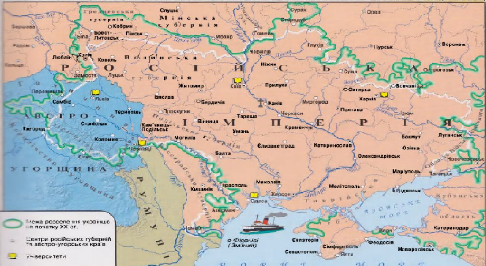
Масштаб 1 : 7 900 000 (в 1 см 79 км)

19 століття увійшло в історію України як період її національного відродження. Розділений кордонами український народ не втратив прагнення до волі. З-поміж освічених українців поживаються інтерес до народної творчості, історії та культури. З'являються видання українських народних пісень, дум, переказів. Після виходу у світ "Енеїди" Івана Котляревського розвивається нова українська література. Історики розшуковують та публікують документи українського минулого. Своїм віднесенням український рух завдячував сузір'ю талановитих особистостей — Миколі Костомарову, Іванові Франку, Лесі Українці. Символом українського відродження став Тарас Шевченко.