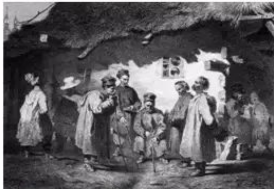
Т.Шевченко. Судня рада