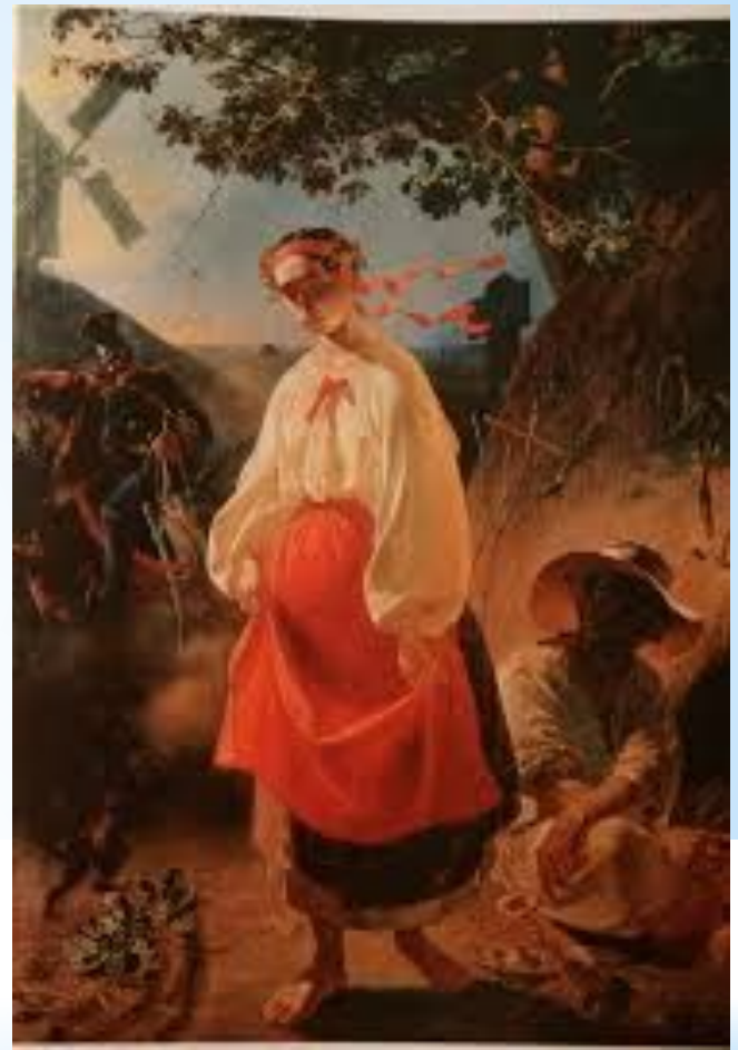
«Катерина» 1842 р