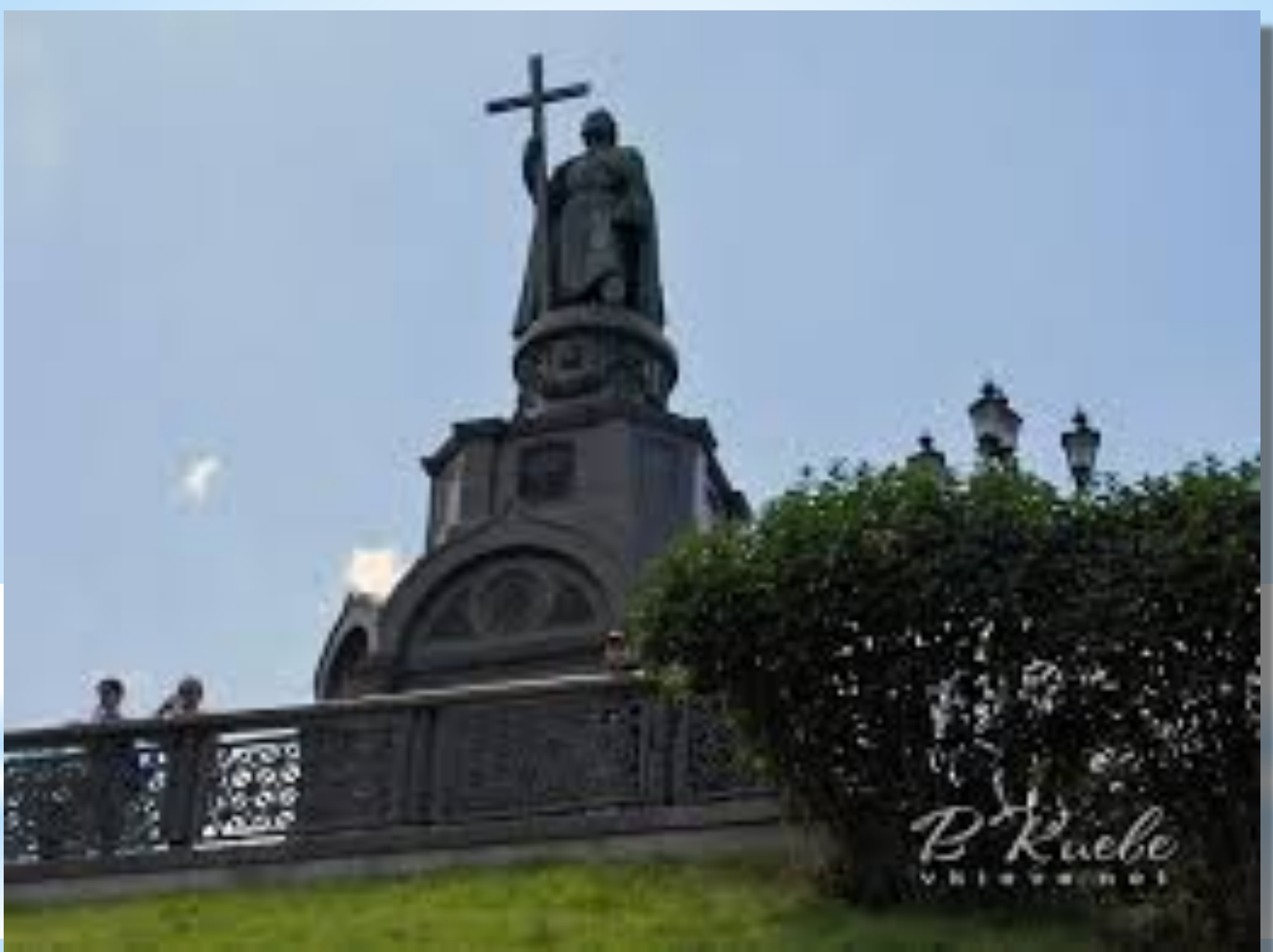
Пам'ятник князю Володиміру