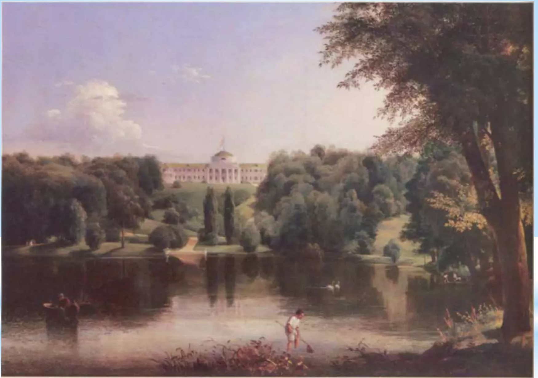
Садиба Г.С.Тарновського в Качанівці. Штернберг В І. 1837 р.