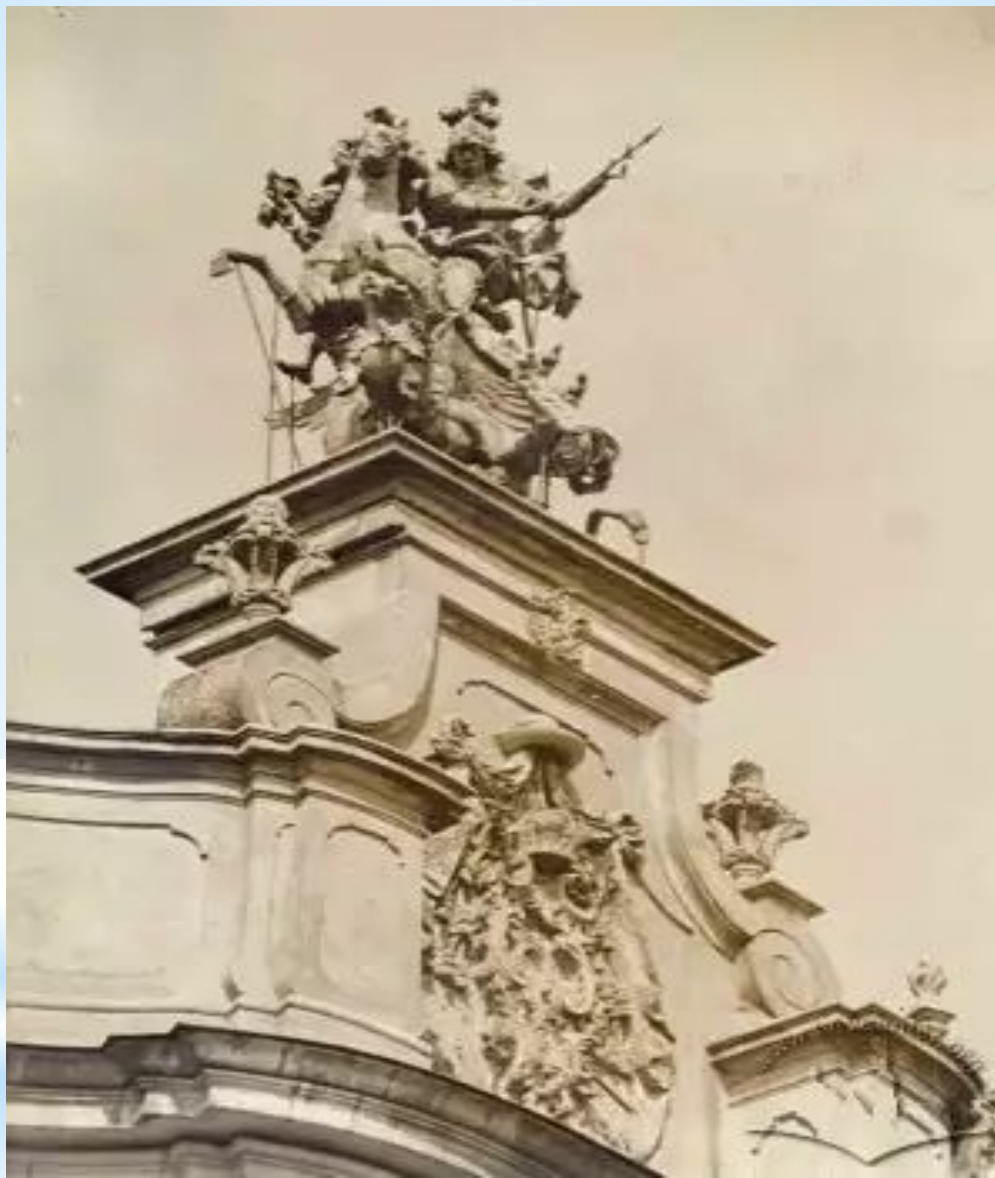
Скульптурна група Св. Юрій-Зміборець роботи Й.-Г. Пінзеля на аттику Собора Св. Юра