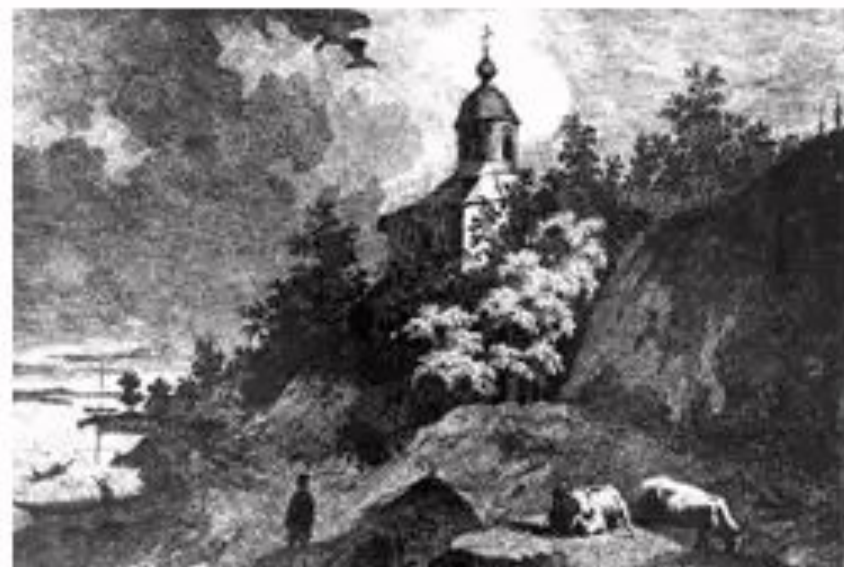
Т.Шевченко. Видубицький монастир у Києві