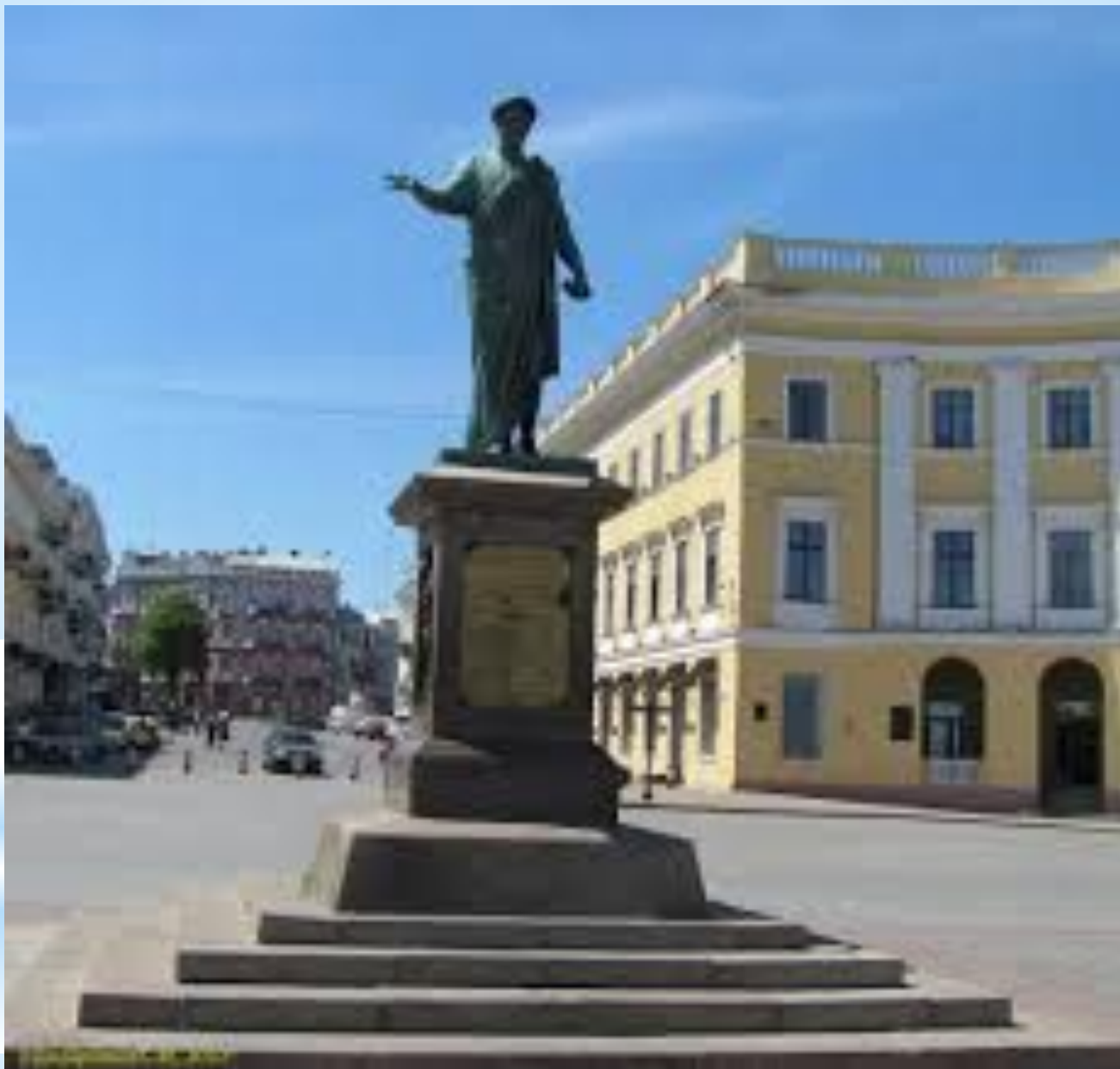
Одесса. Памятник Дюку де Ришелье