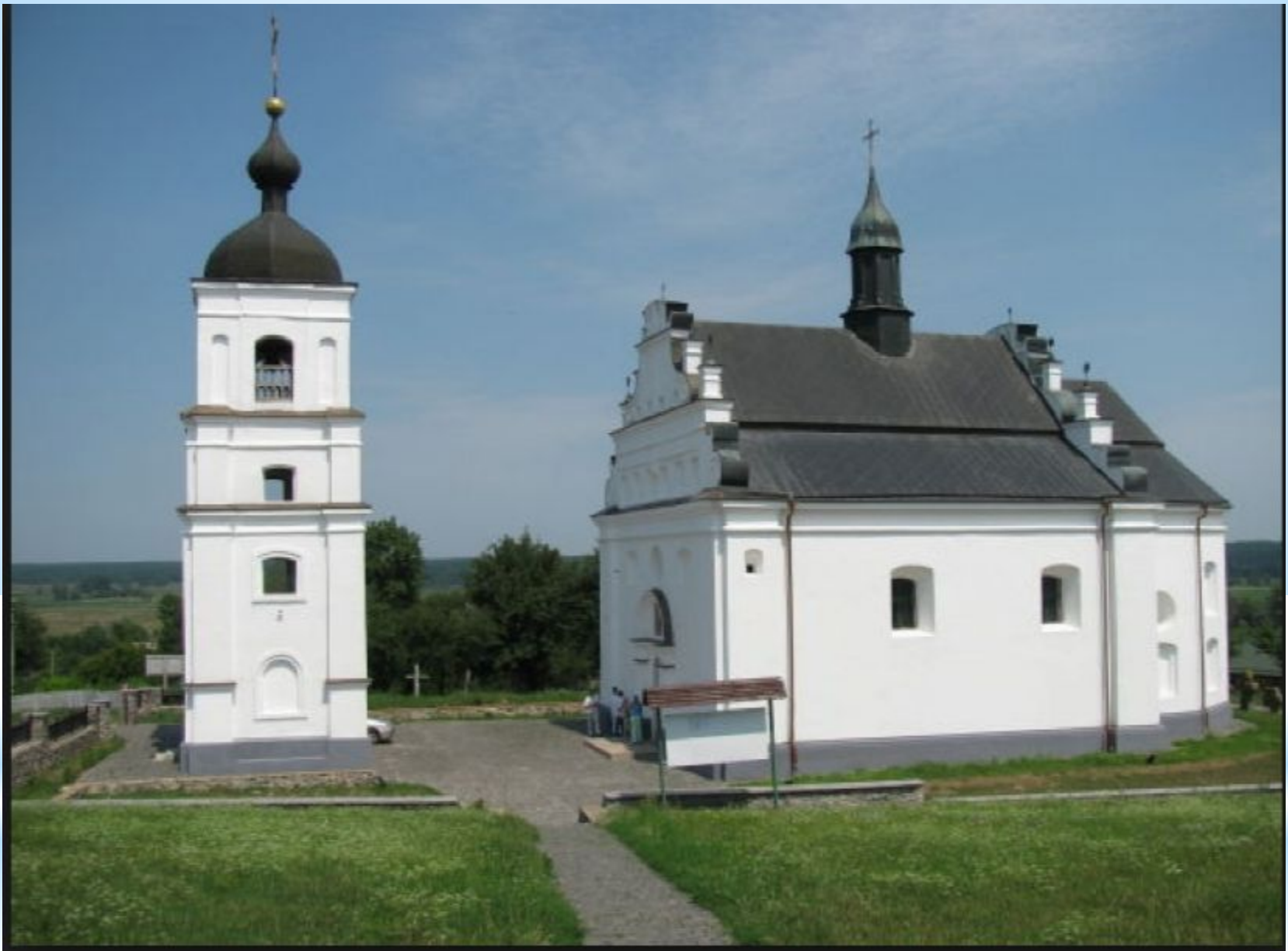
Іллінська церква в Суботіві – пам'ять про Богдана Хмельницького