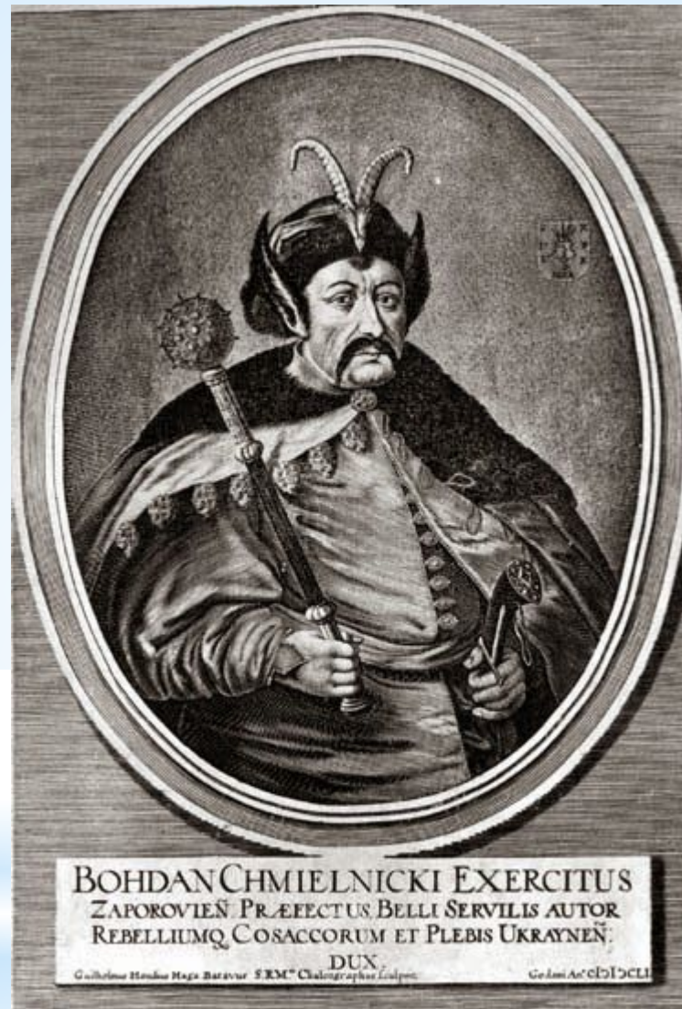
47. Портрет Богдана Хмельницького. В. Гондіуса. Середина XVII ст. (гравюра, єдине прижиттєве портретне зображення Б.Хмельницького).