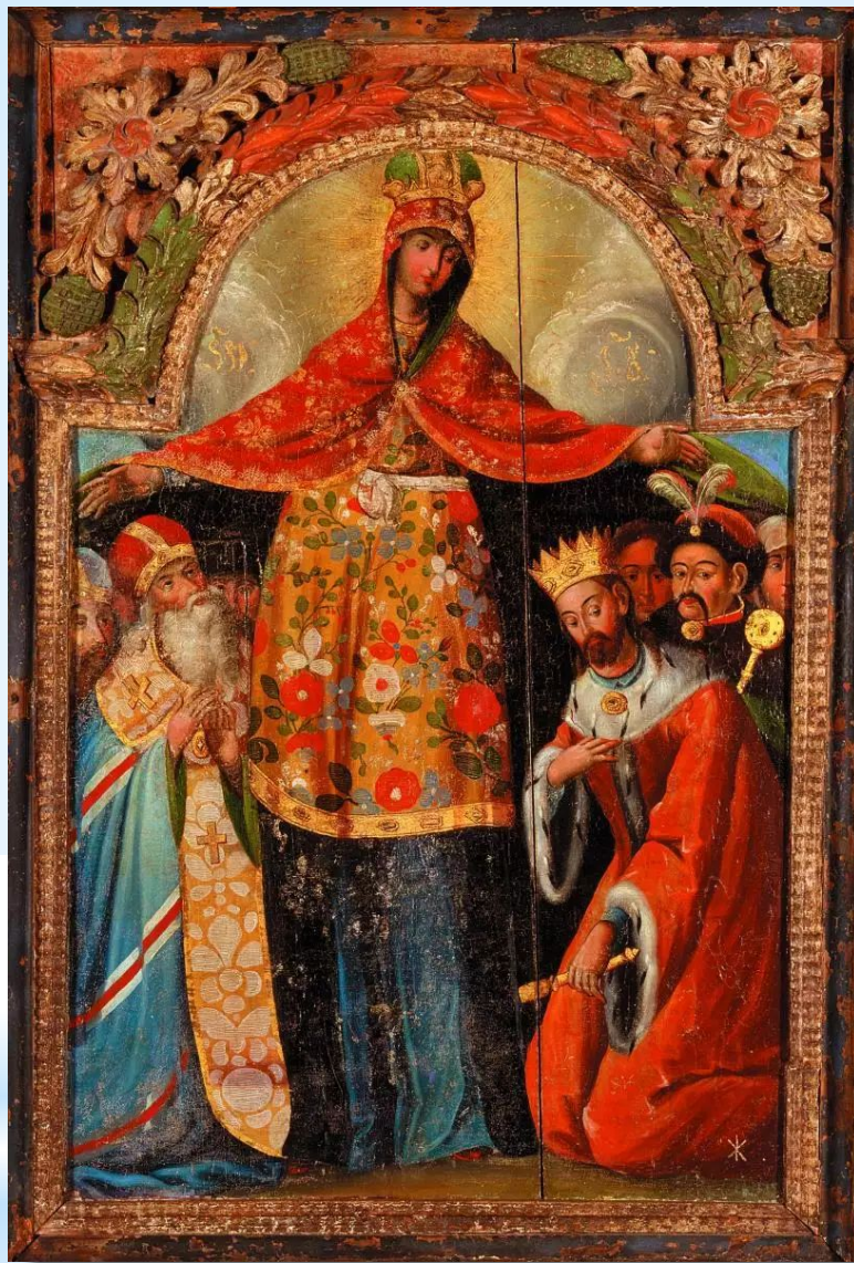
48. Ікона «Покрова Богородиці» (з портретом гетьмана Богдана Хмельницького). Перша половина ХVІІІ ст. (бароко).