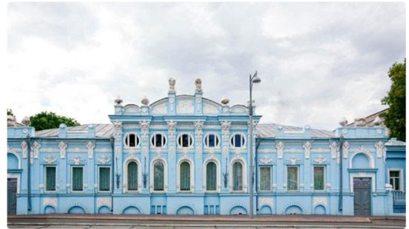
Дом купца Грибушина