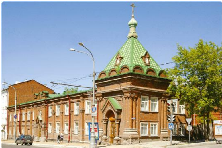
Часовня святого Стефана Великопермского