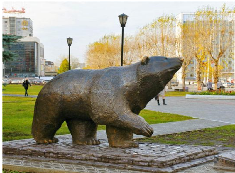
Скульптура В. И. Павленко и О. Ю. Красношейной «Пермский медведь»