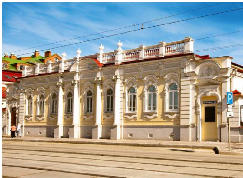
Дом купца Михайлова