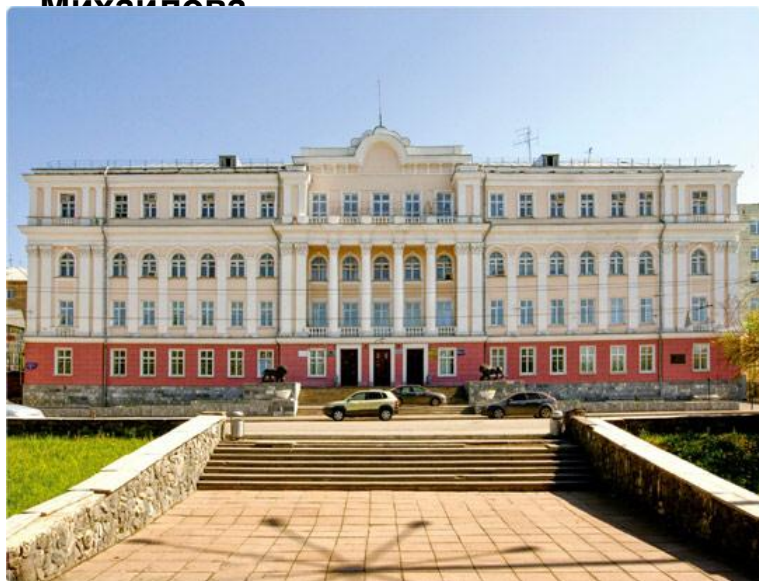
«Дом со львами»