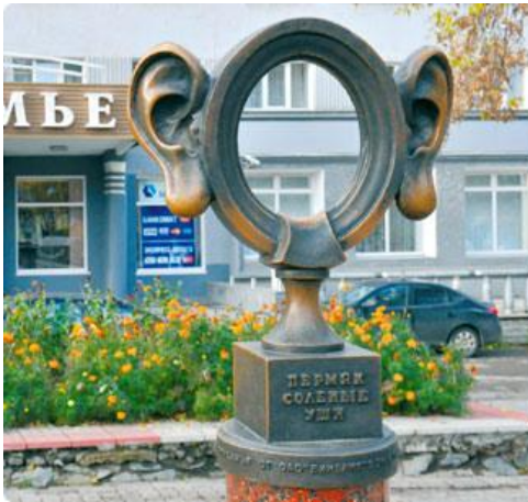
Скульптура Р. Исмагилова «Пермяк – соленые уши»