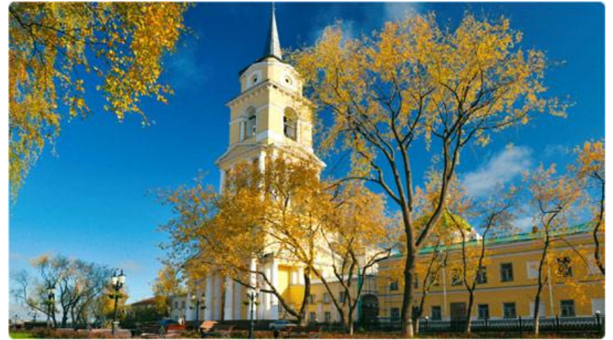
Спасо-Преображенский кафедральный собор