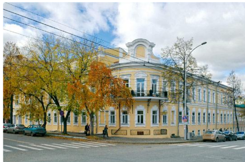
Дом Смышляева – Здание городской Думы