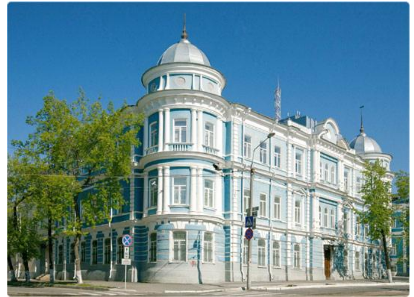
Здание крестьянского поземельного банка