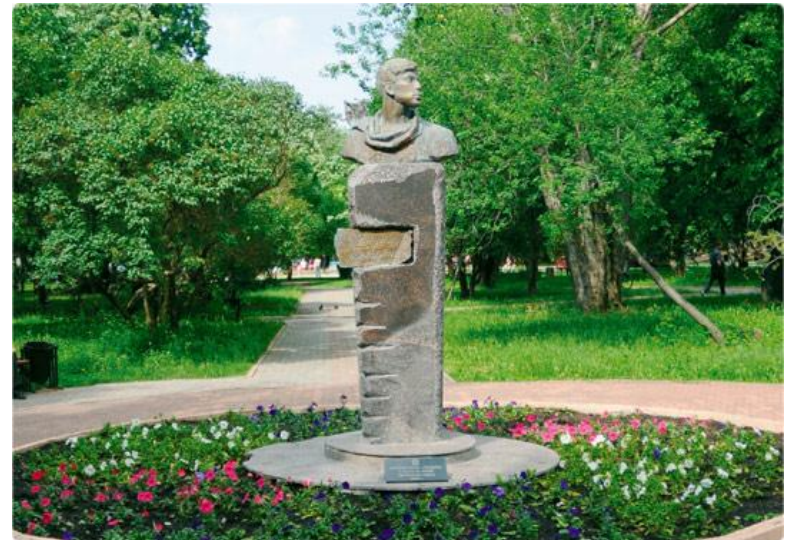
Памятник Б. Пастернаку