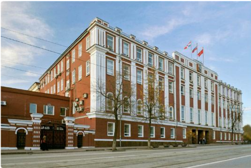
Губернская казенная палата