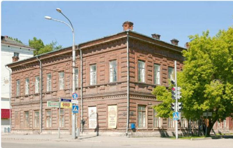
Пермская женская учительская гимназия