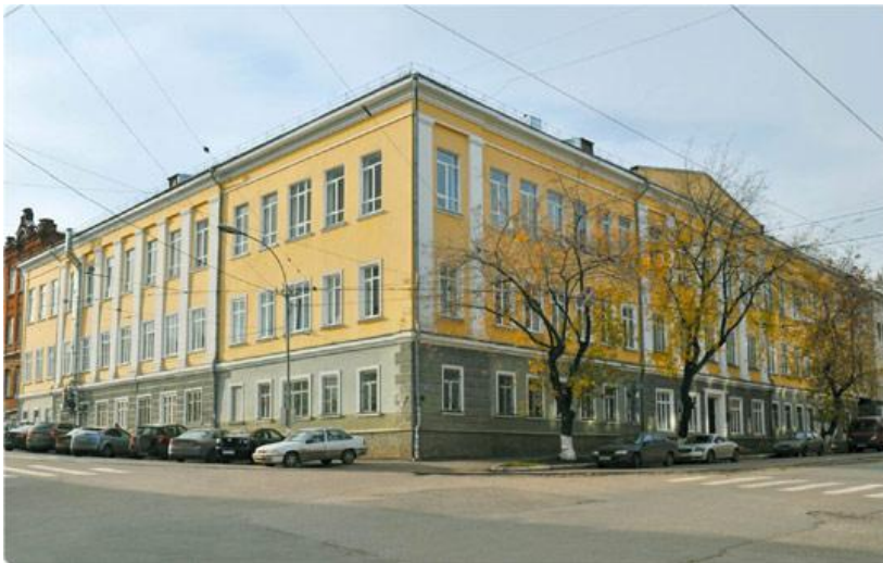
Старый корпус женского епархиального училища