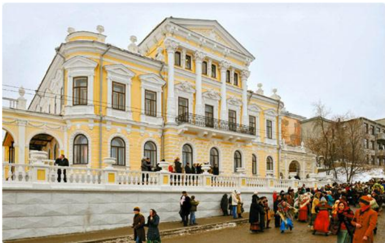
Дом пароходчика Мешкова