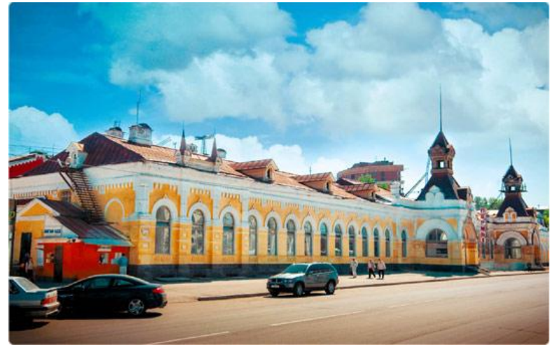
Железнодорожный вокзал «Пермь I»