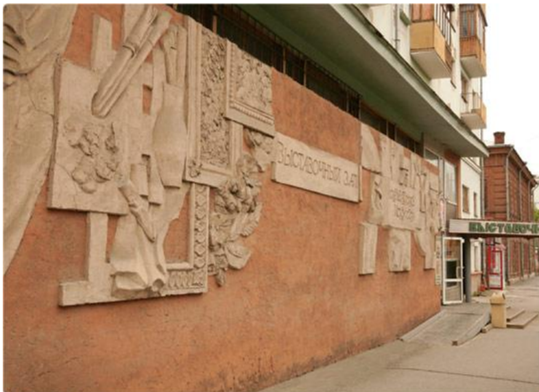
Выставочный зал г. Перми