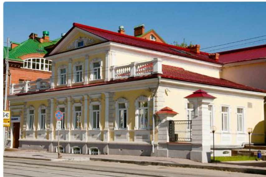
Дом купца Гаврилова