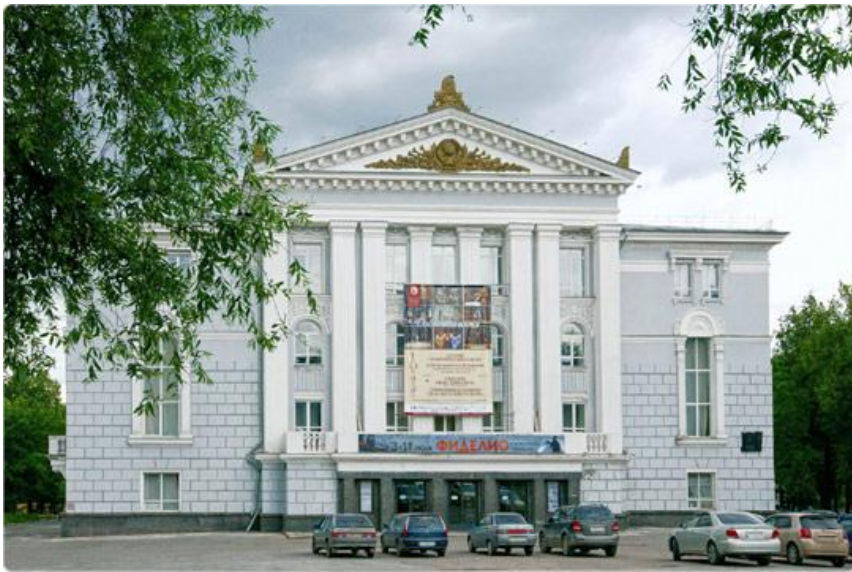
Пермский академический театр оперы и балета им. П. И. Чайковского