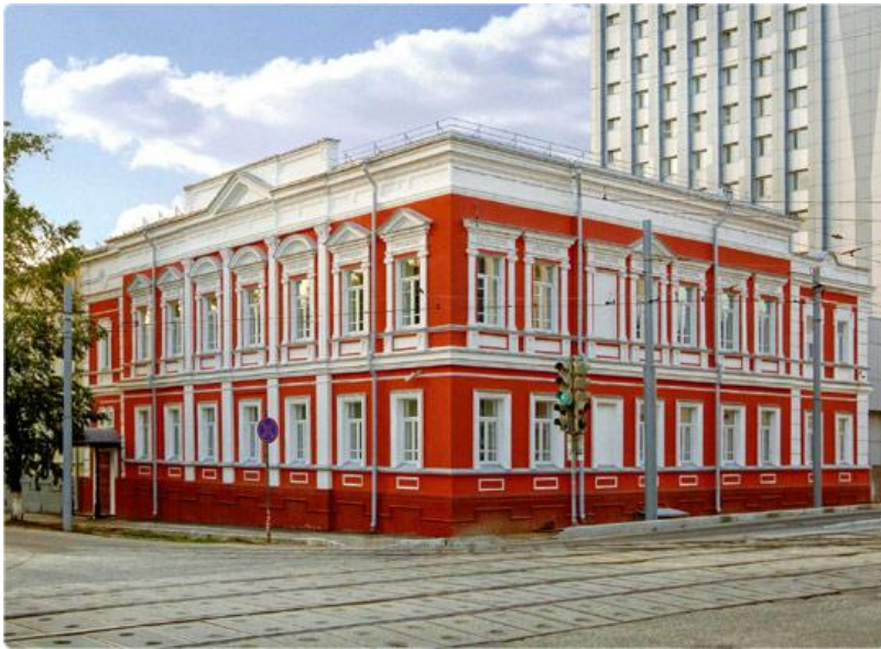
Здание государственного банка