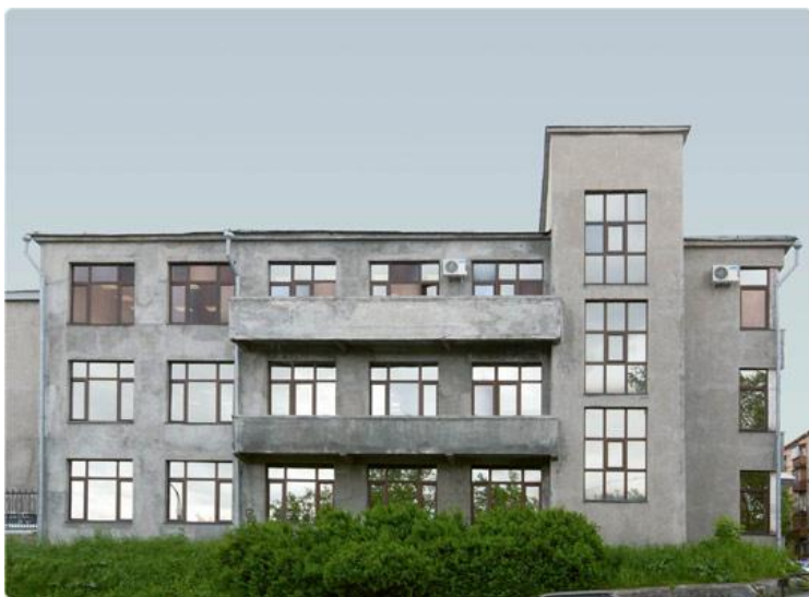
Узел связи Камского речного пароходства