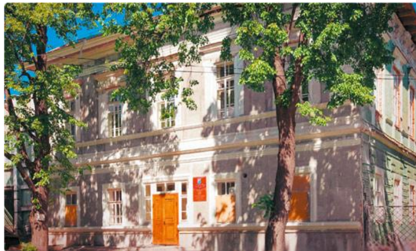
Духовная консистория (канцелярия Кафедрального собора)