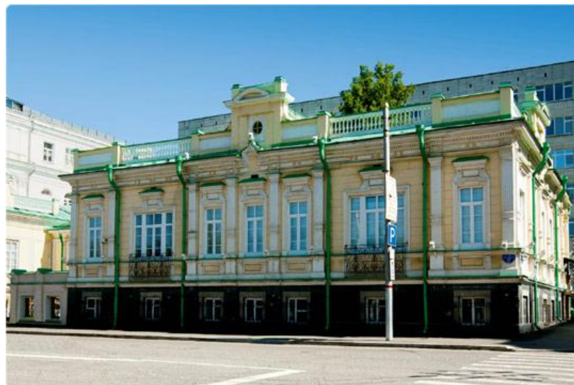
Дом В. Е. Вердеевского (дом Протопопова)