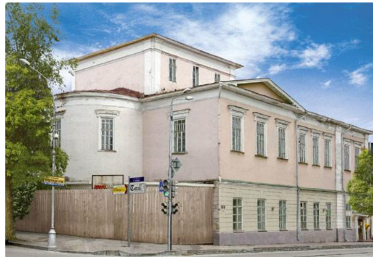
Церковь Рождества Богородицы