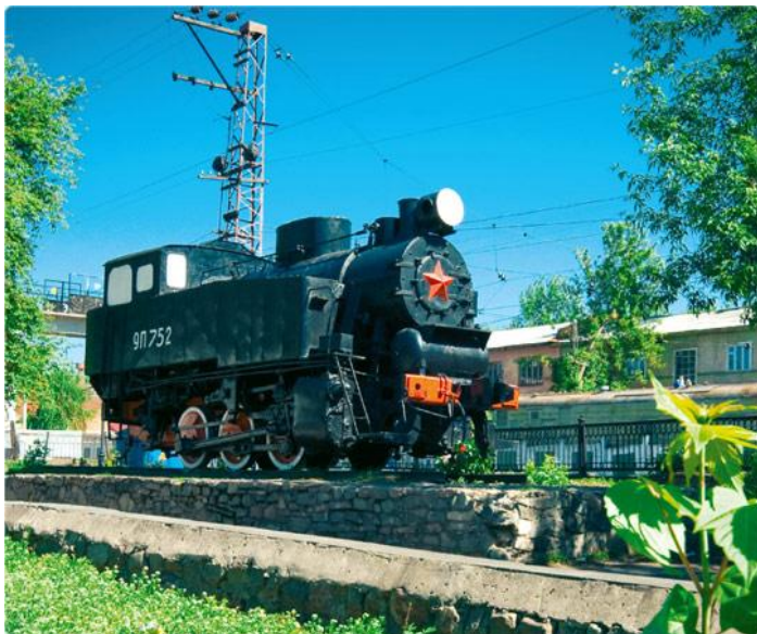
Скверик с паровозом