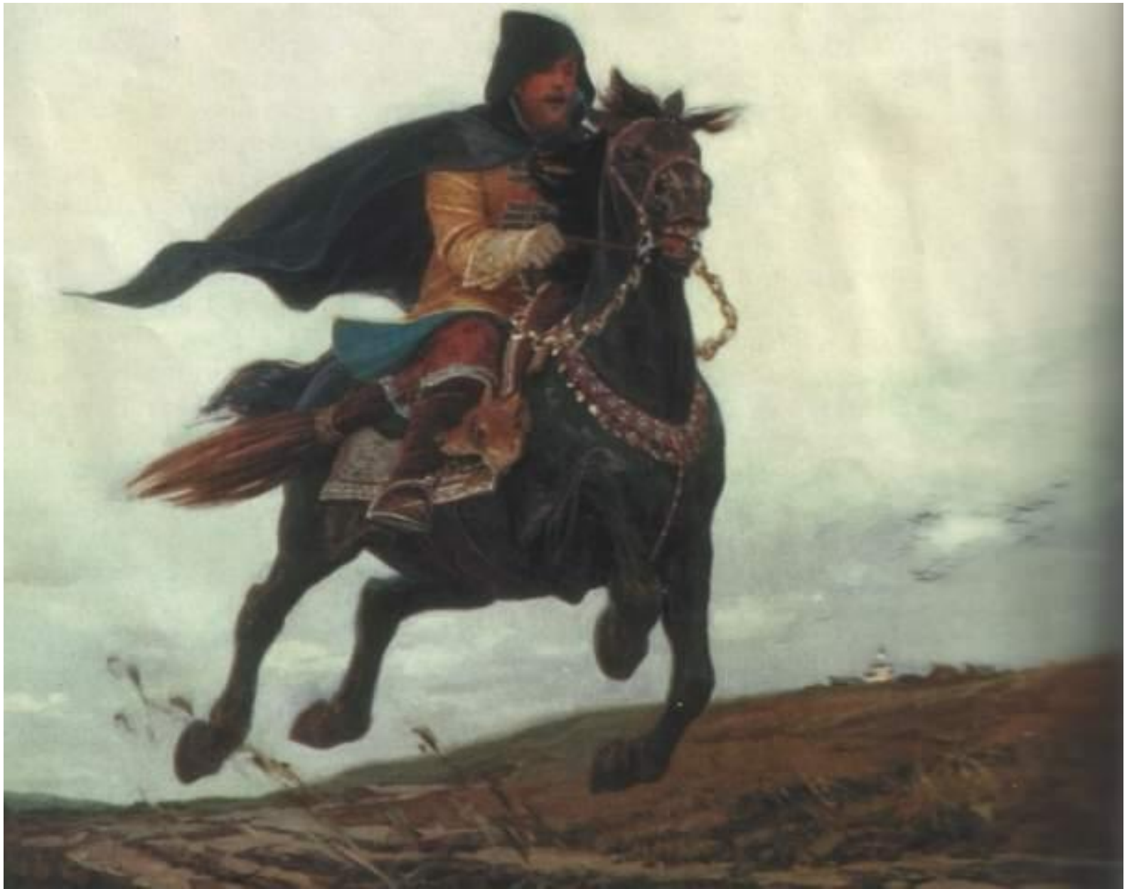
С. Ефошкин. «Опричник»