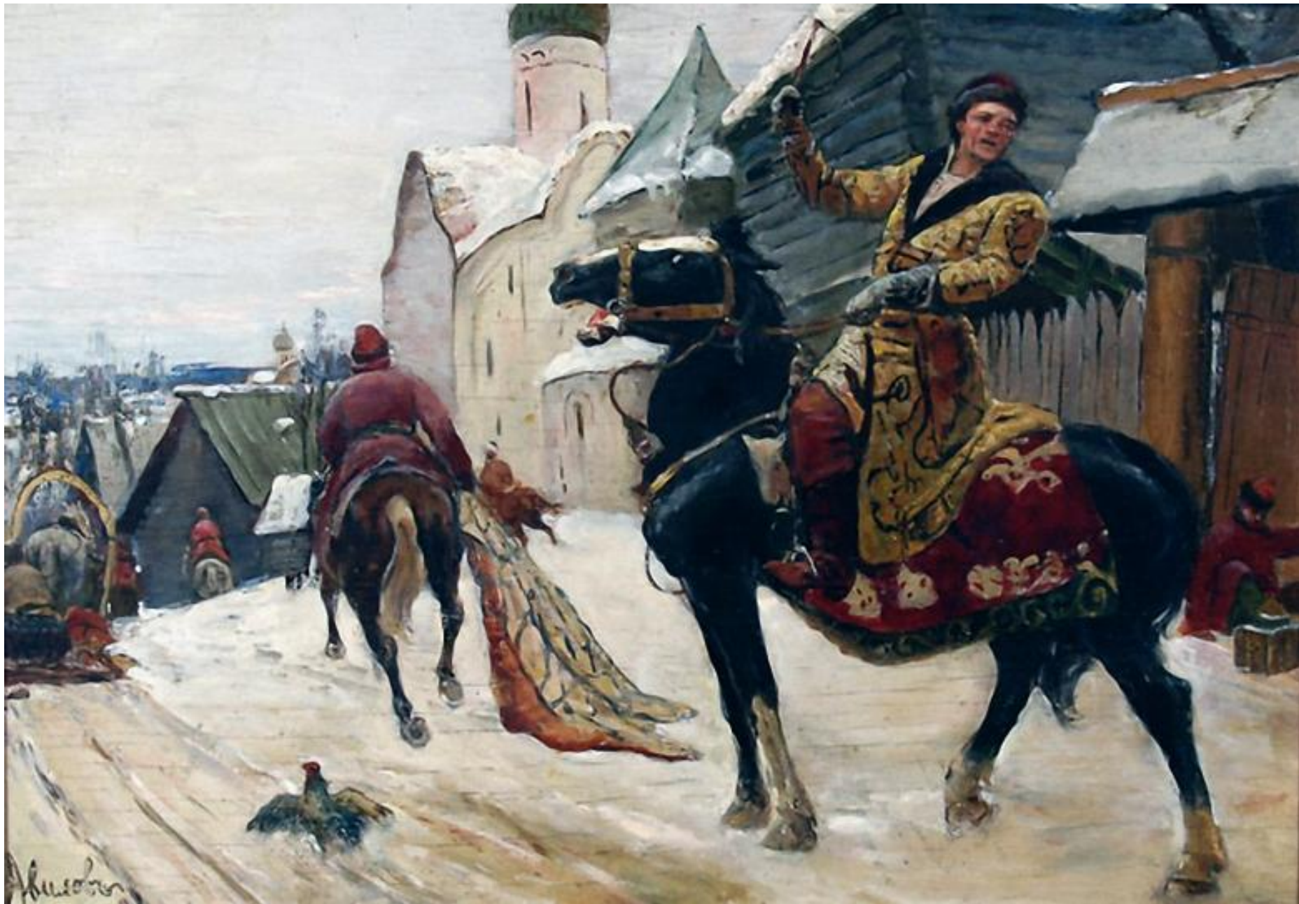
М. Авилов «Опричники в Новгороде»