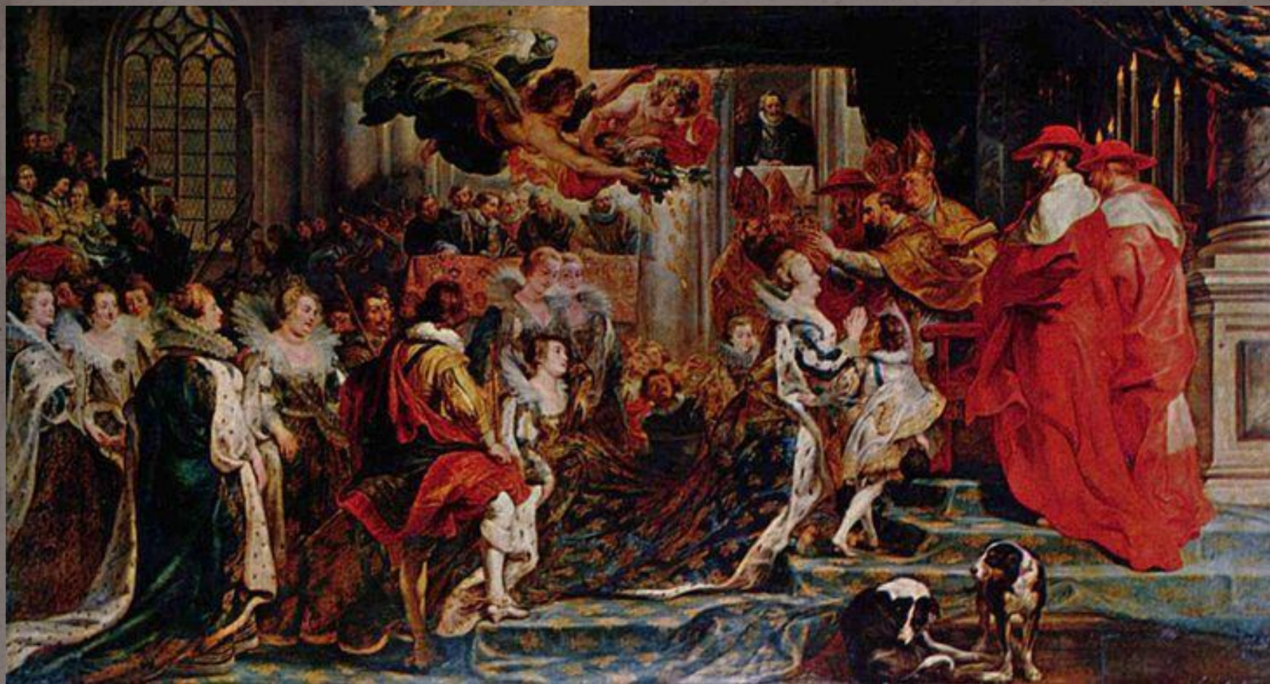
Коронация Марии Медичи 394×727 см.