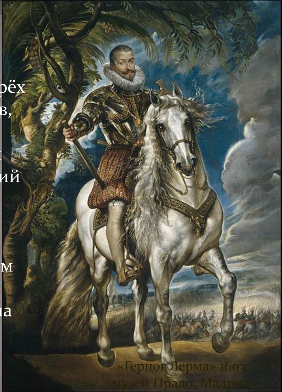
«Герцог Лерма» 1603 музей Прадо, Мадрид

Достаточно посмотреть на его картины, и в этом не останется ни малейшего сомнения.