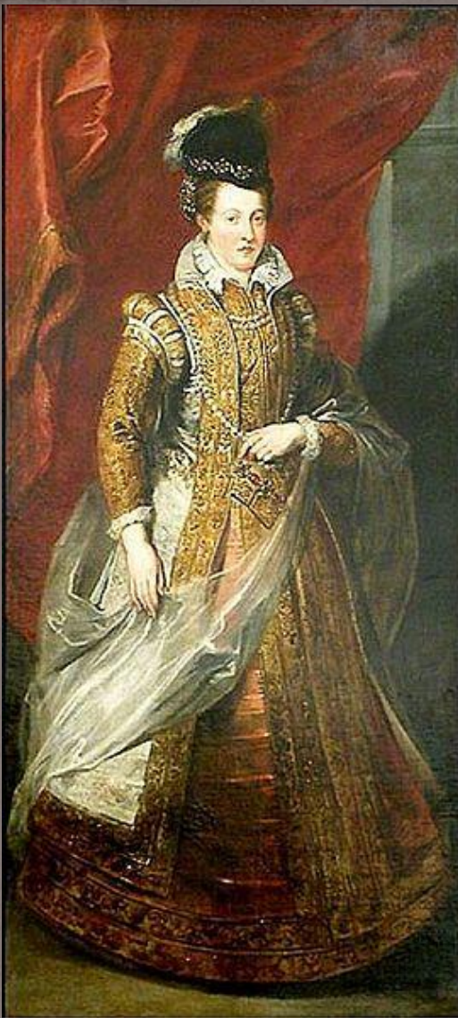
Иоанна Австрийская, великая герцогиня Тосканская, мать Марии Медичи