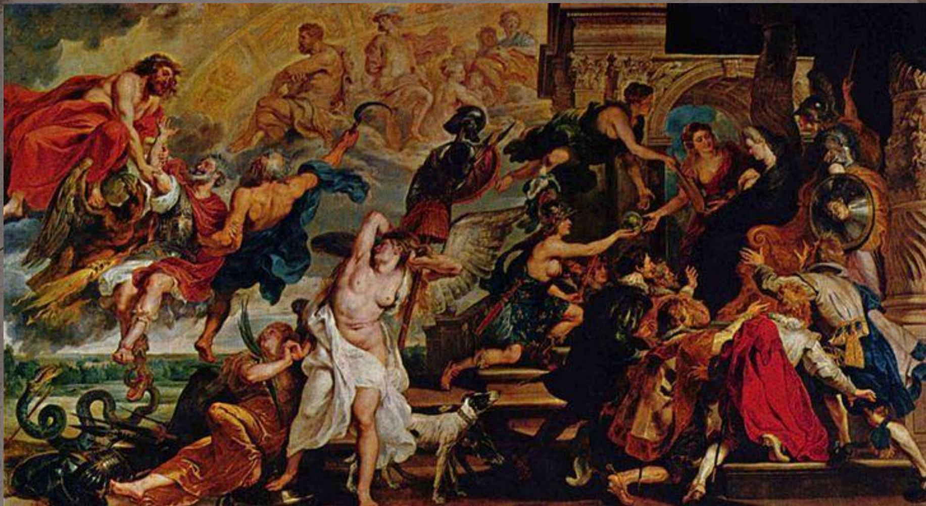
Смерть Генриха IV и провозглашение регентства