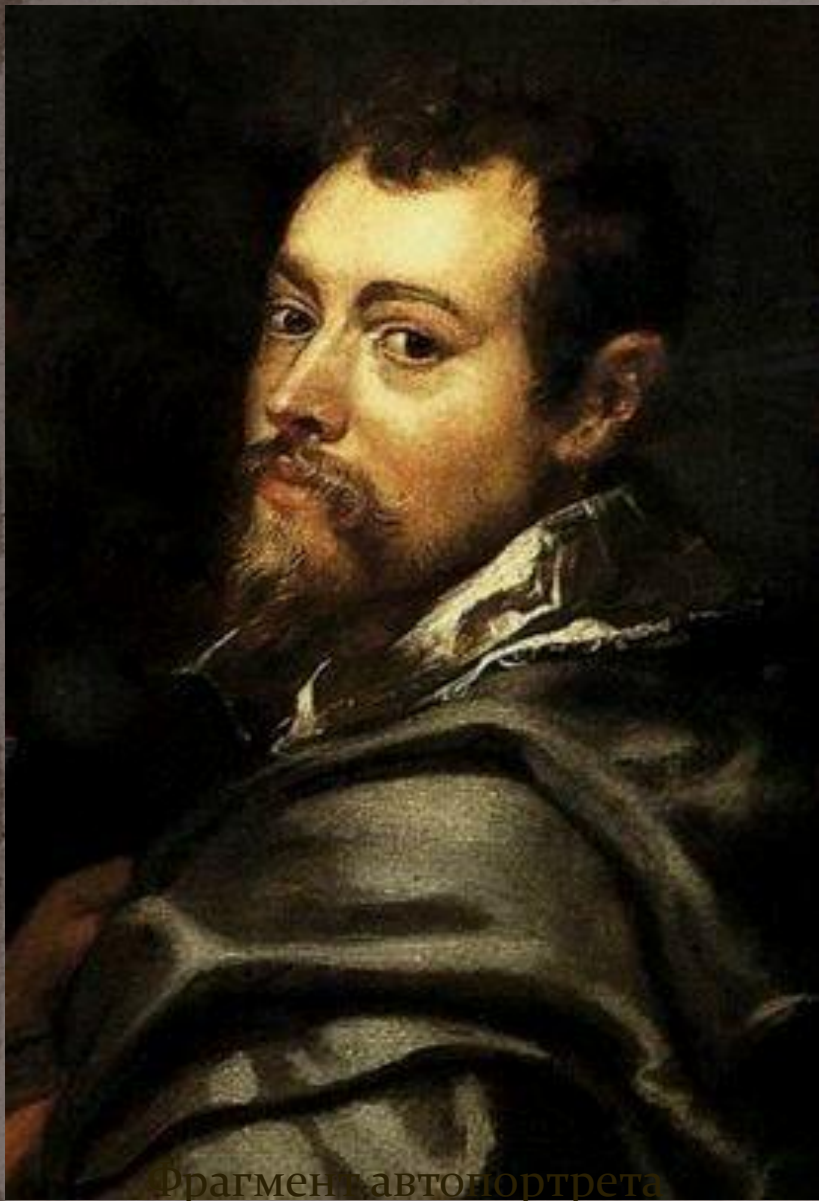
Фрагмент автопортрета Фальфраф Ришартц Музей, Кельн

Выдающийся фламандский живописец Питер Пауль Рубенс (1577-1640) был человеком редкого по масштабу гения, который обладал всеми достоинствами, столь необходимыми как для великих свершений в искусстве, так и для успеха в обществе, — мощным интеллектом, кипучей энергией, крепким здоровьем, приятной внешностью, удивительным даром гармонии и, в придачу, ясной головой для творческой и деловой активности.