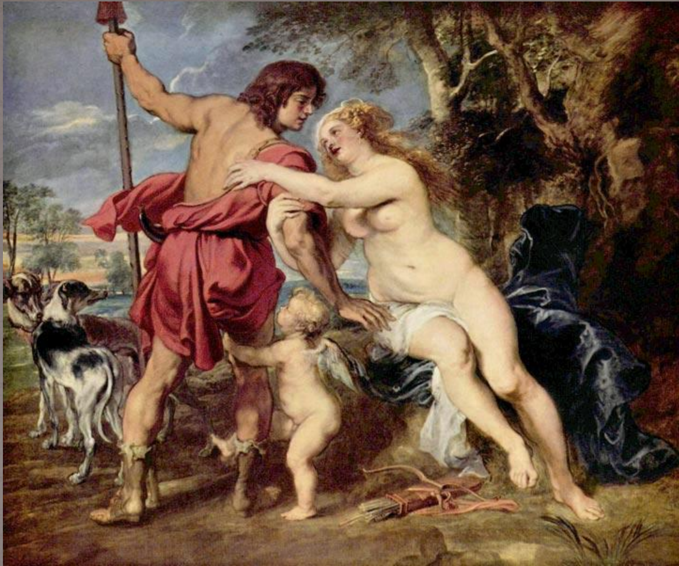
"Венера и Адонис" 1615 Метрополитен-музей, Нью-Йорк