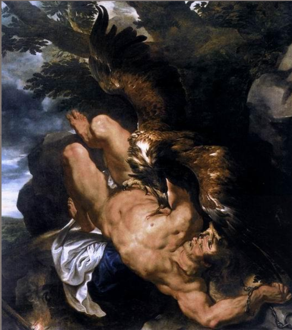
«Пригвождённый Прометей» 1610-1611 Музей Изобразительных Искусств, Филадельфия

Больше всего его приводила в восторг податливая, пластическая красота человеческого тела. Хотя ему нравился окружающий его материальный мир, он весь был наполнен глубокой, доводящей до экзальтации религиозной верой своего времени.