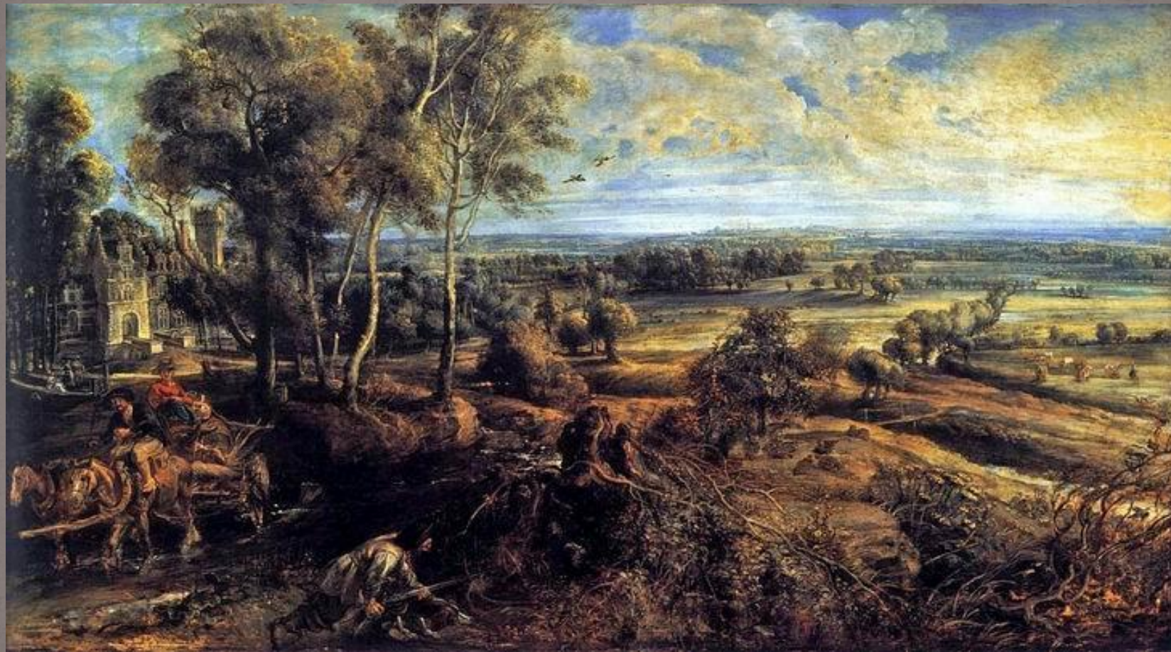
«Летний пейзаж с видом Хет Стина» 1635. Лондонская Национальная Галерея, Англия

Рубенс не только виртуозный мастер масштабных работ на мифологические и религиозные темы, но и тонкий портретист и пейзажист.