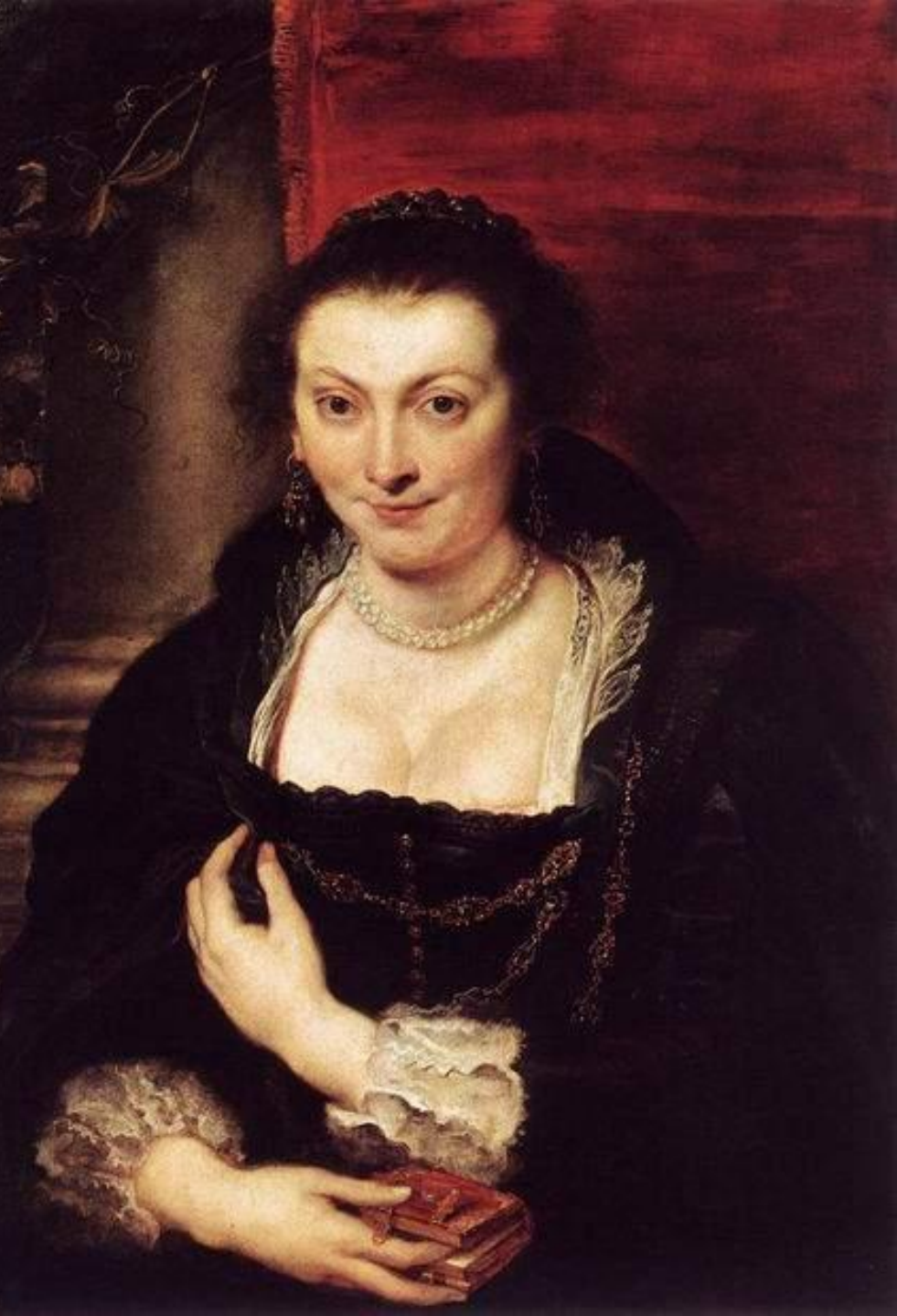
Изабелла Брандт, жена Рубенса, 1626. Холст, масло, 86х62. Галерея Уффици, Флоренция