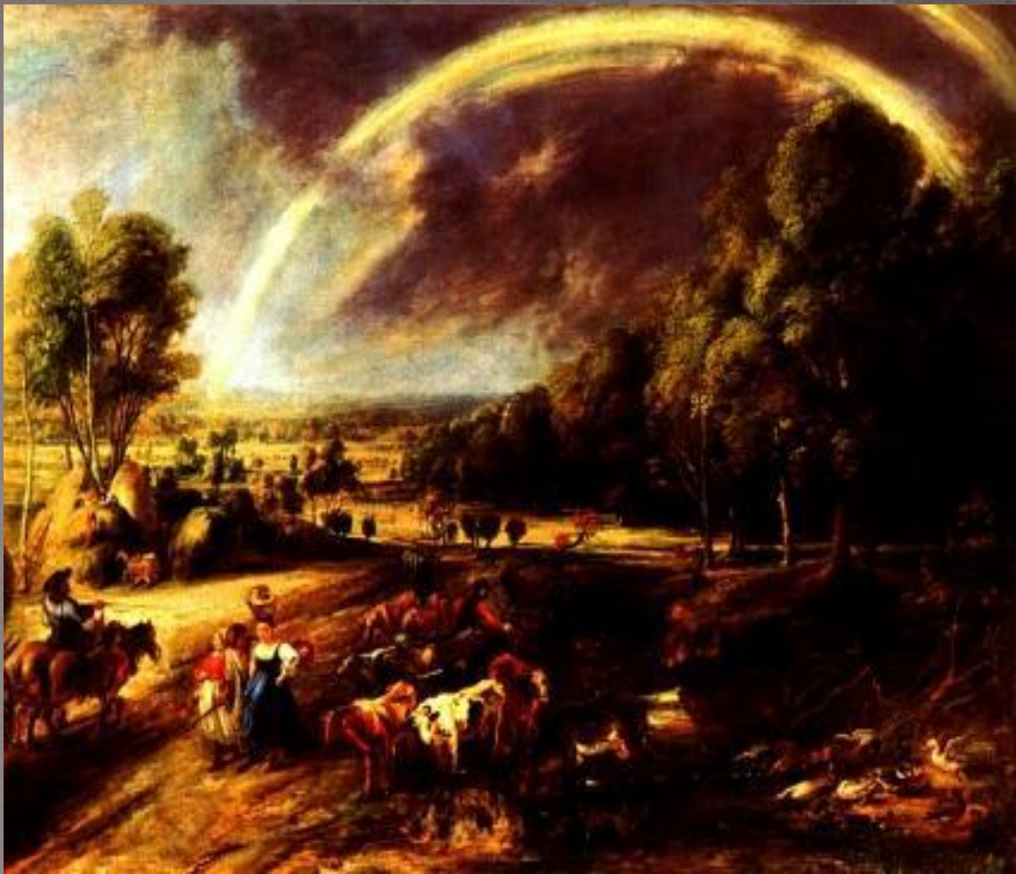
Рубенс. «Пейзаж с радугой». 1636. Старая пинакотека, Мюнхен.

Пейзажи позднего Рубенса воспроизводят эпический образ природы Фландрии с ее просторами, далями, дорогами и населяющими ее людьми.