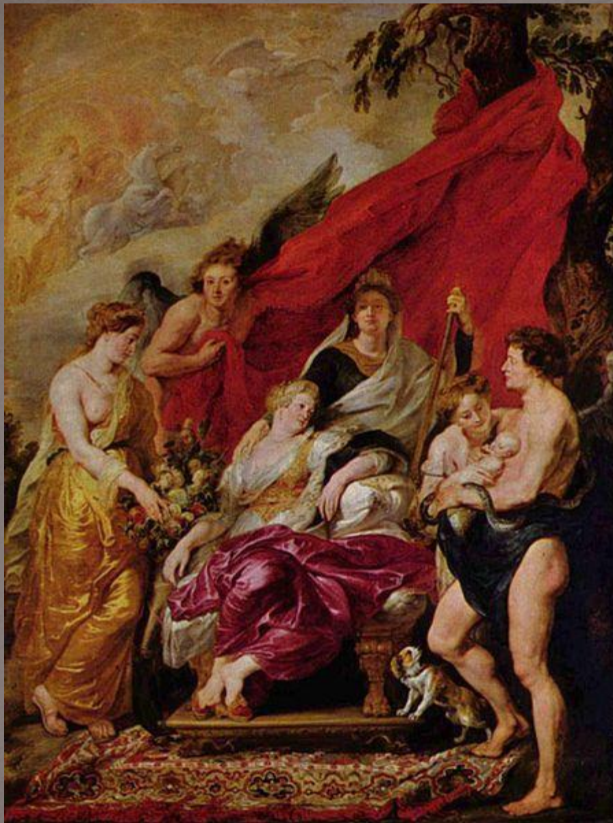
Рождение Людовика XIII

Будущий король Людовик XIII родился 27 сентября 1601 года в Фонтенбло .