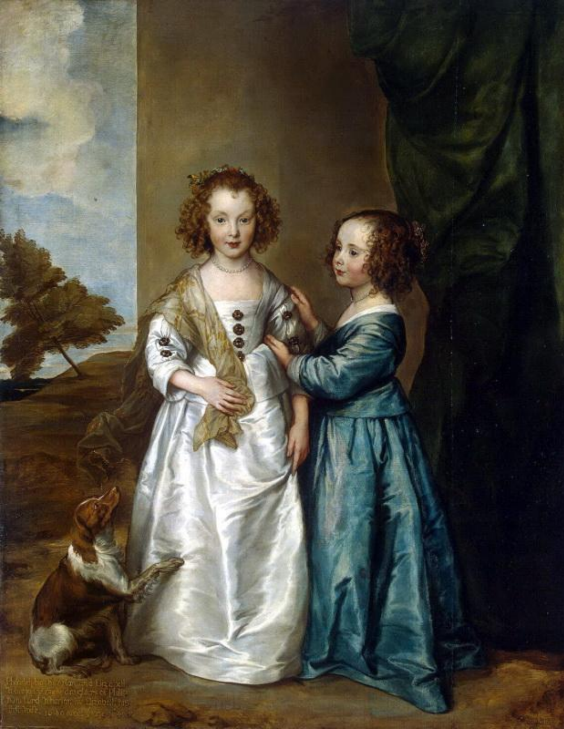
Эрмитаж: Ван Дейк, Антонис - Портрет Елизаветы и Филадельфии Уортон [1630]. Холст, масло. 162x130 см.