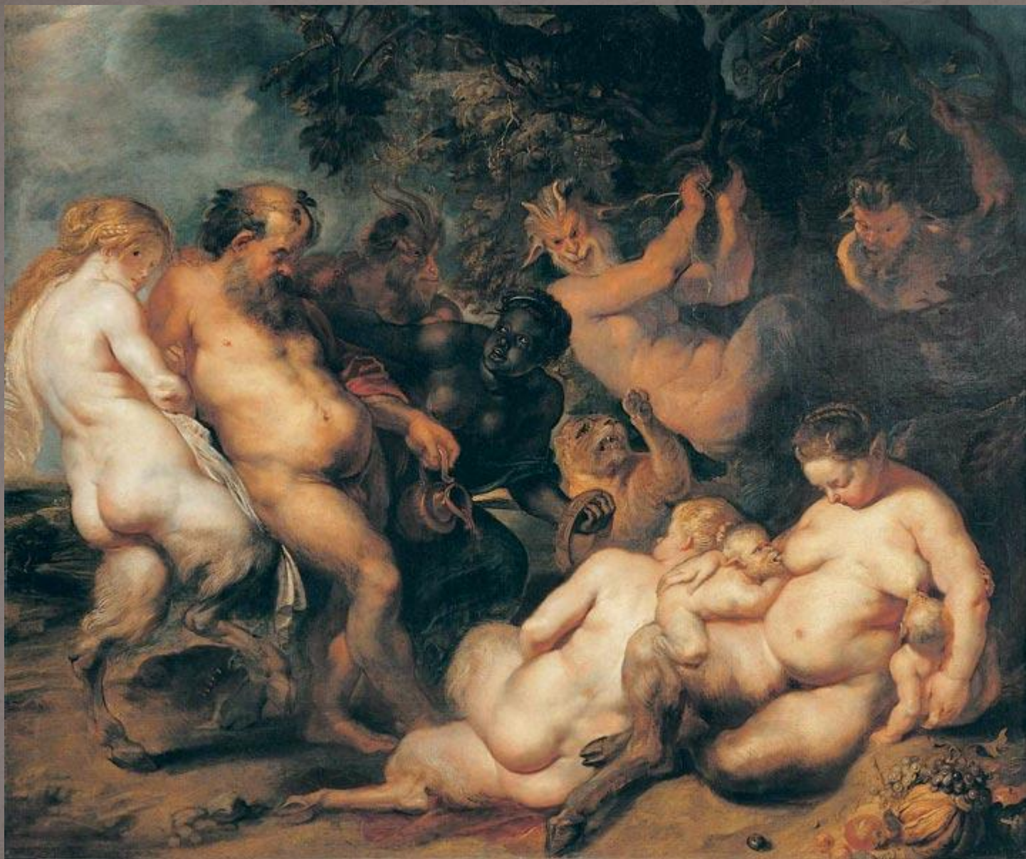
"Вакханалия" , 1615