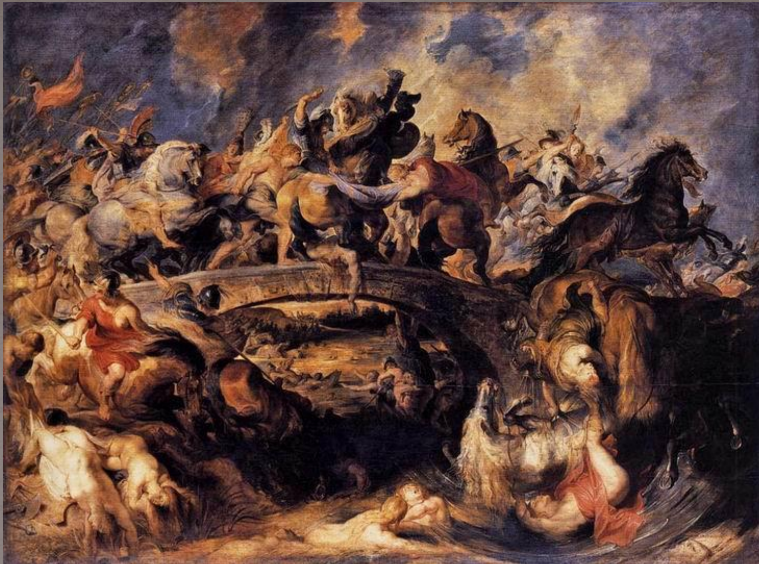
Битва Амазонок, 1618. Дерево, масло, 121x166. Альт Пинакотека, Мюнхен