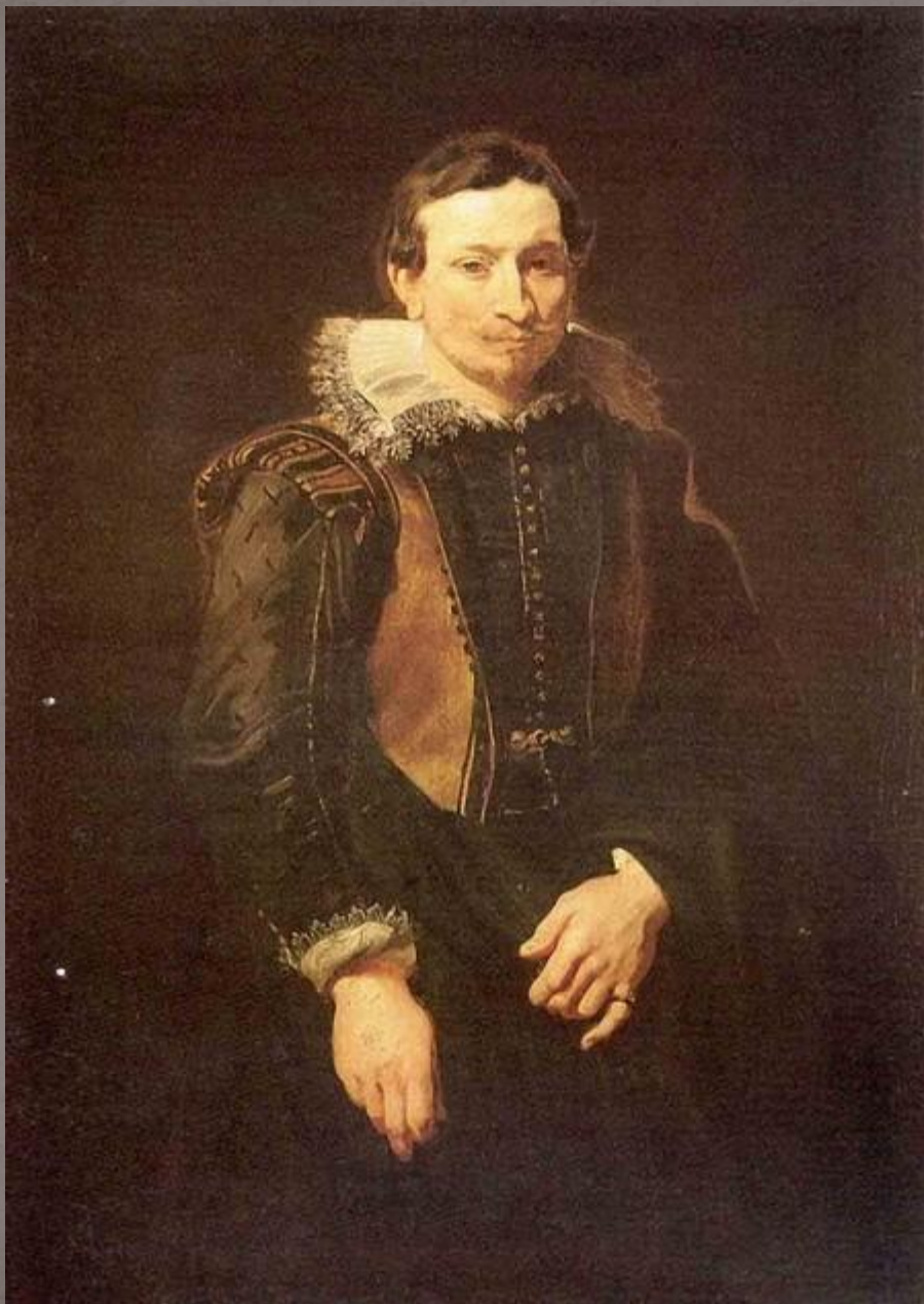
Дейк, Антонис ван. Портрет молодого человека. Ок. 1618. Государственный Эрмитаж,