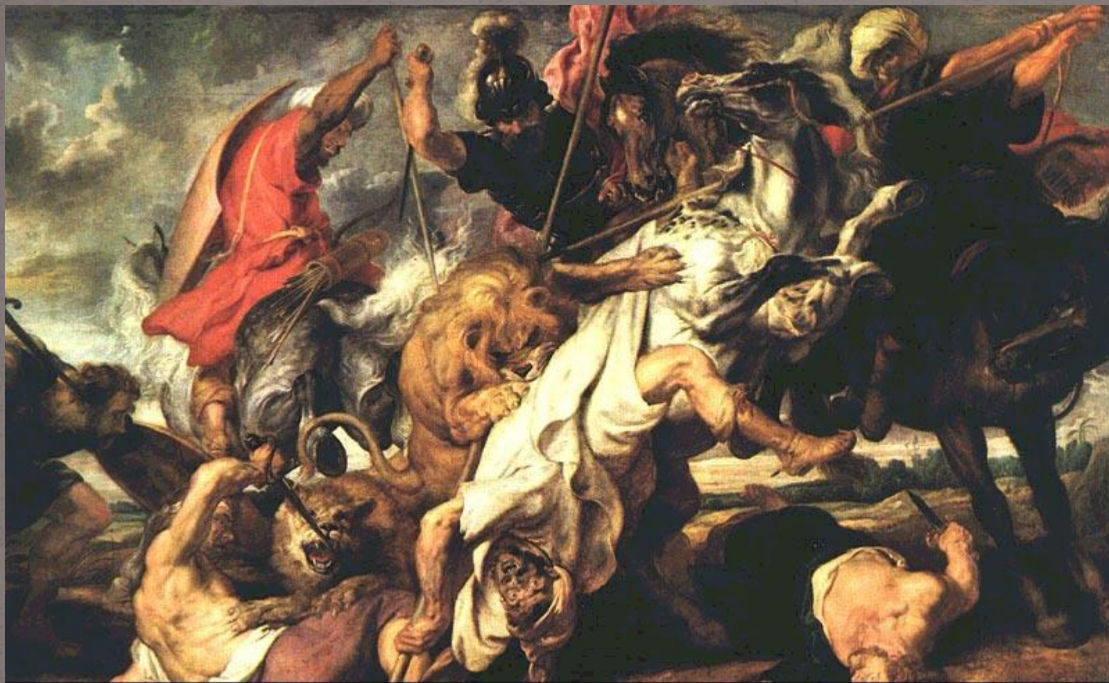
"Охота на льва», 1616