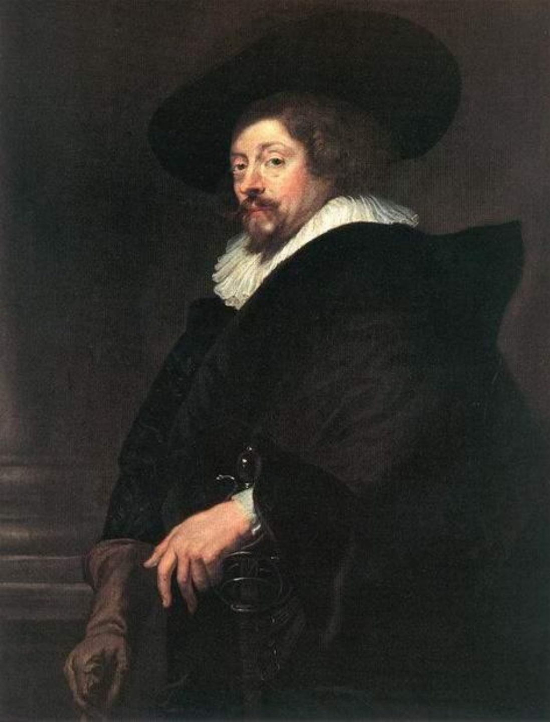
Последний автопортрет, 1639. Холст, масло, 110x85. Исторический Музей, Вена