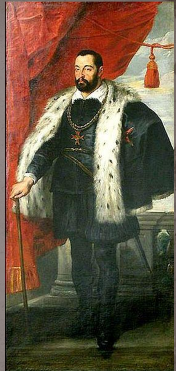
Франческо I Медичи великий герцог Тосканы, отец Марии Медичи