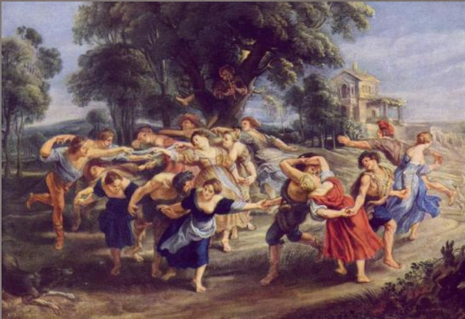
Рубенс, 1635-1638. Холст, масло. Музей: Прадо