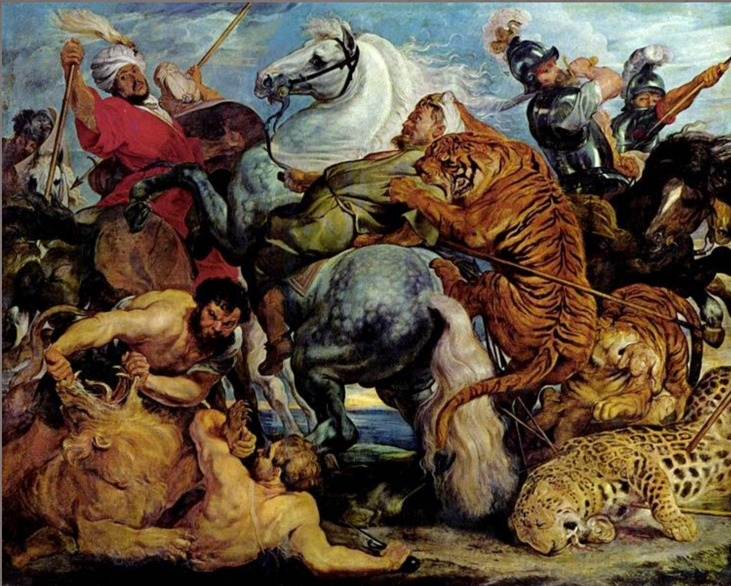
"Охота на тигров и львов" 1618