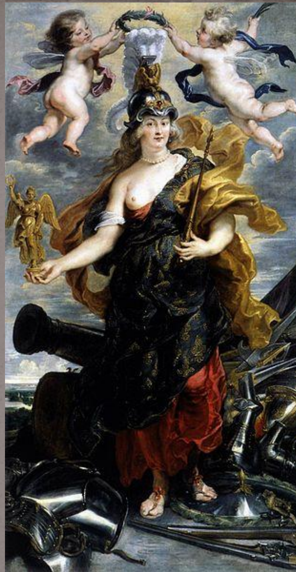
Мария Медичи в образе Минервы