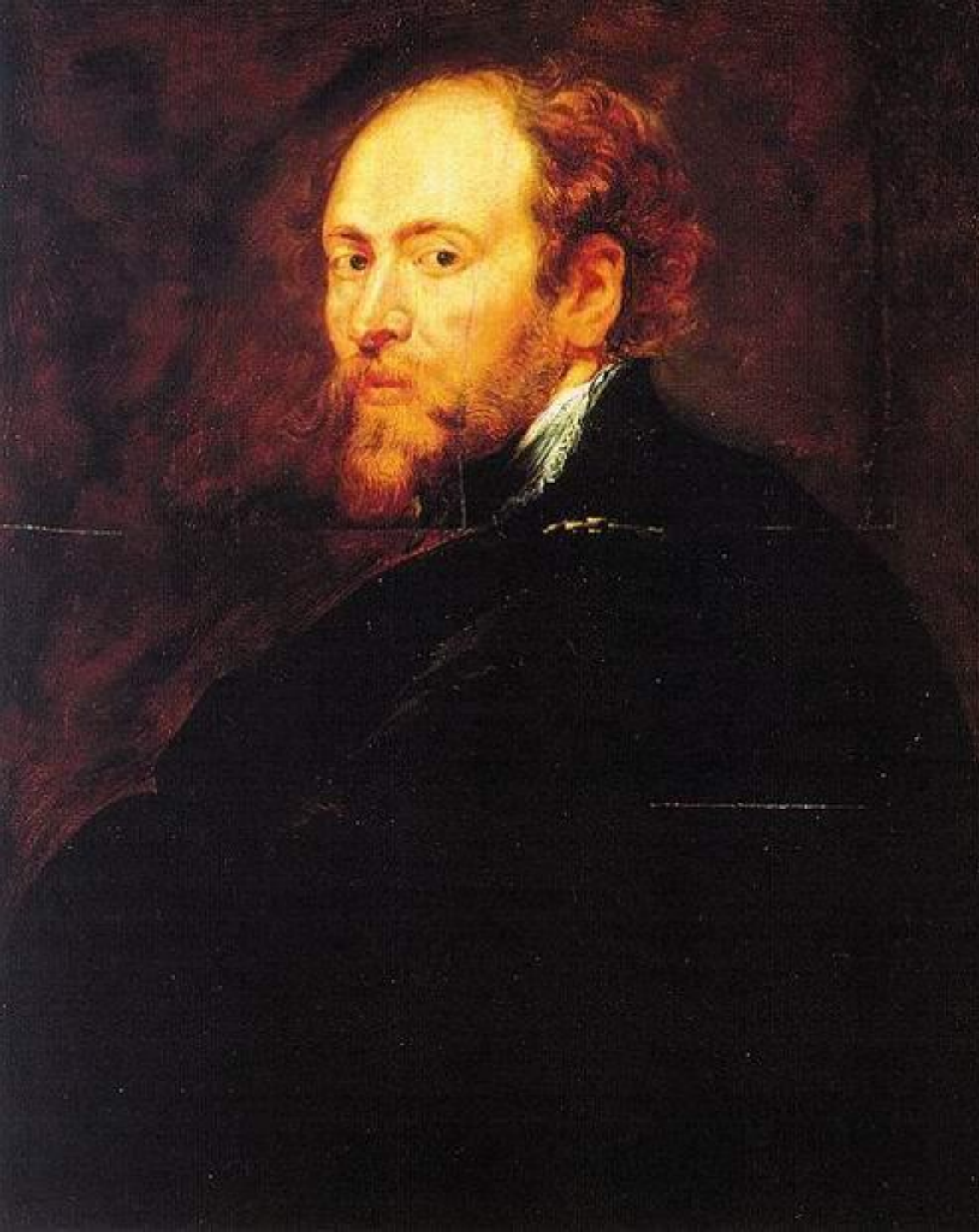
Автопортрет Рубенса, 1628. Холст, масло. Галерея Уффици, Флоренция, Италия