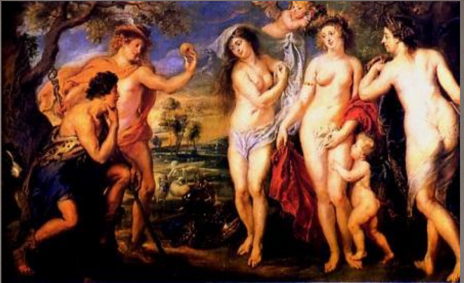
● Питер Пауэл Рубенс. Суд Париса. 1638 г. Прадо.