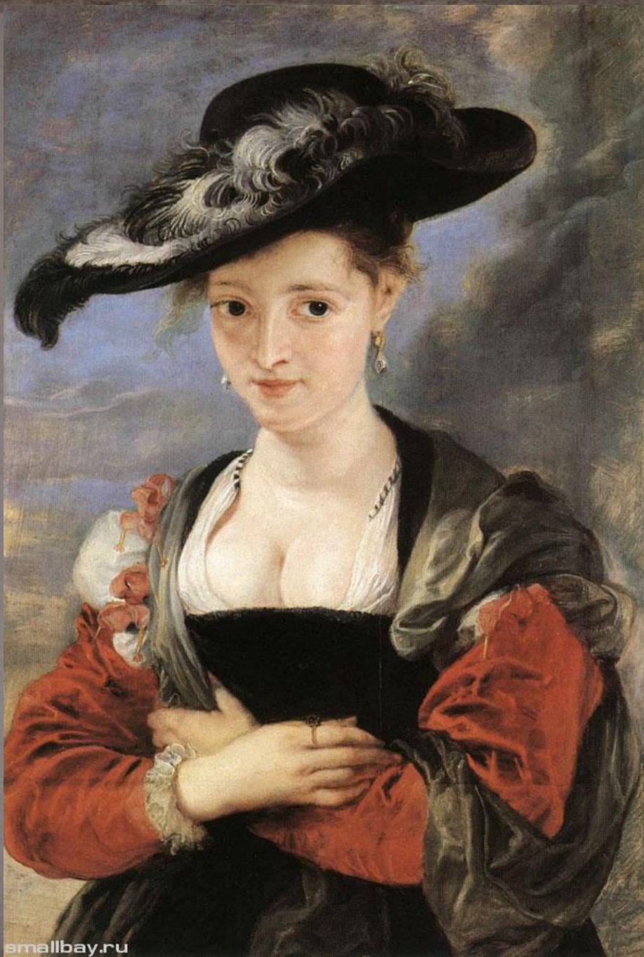
Дама в соломенной шляпке - Питер Пауль Рубенс. Около 1625. Холст, масло.