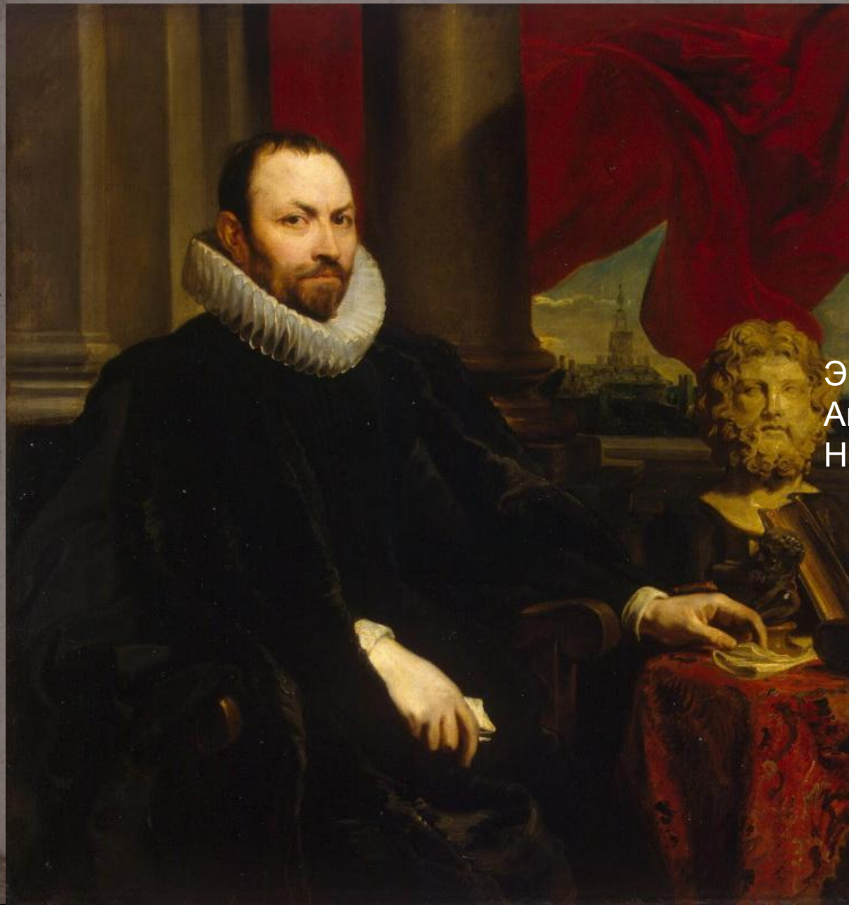
Эрмитаж: Ван Дейк, Антонис - Портрет Николаса Рококса