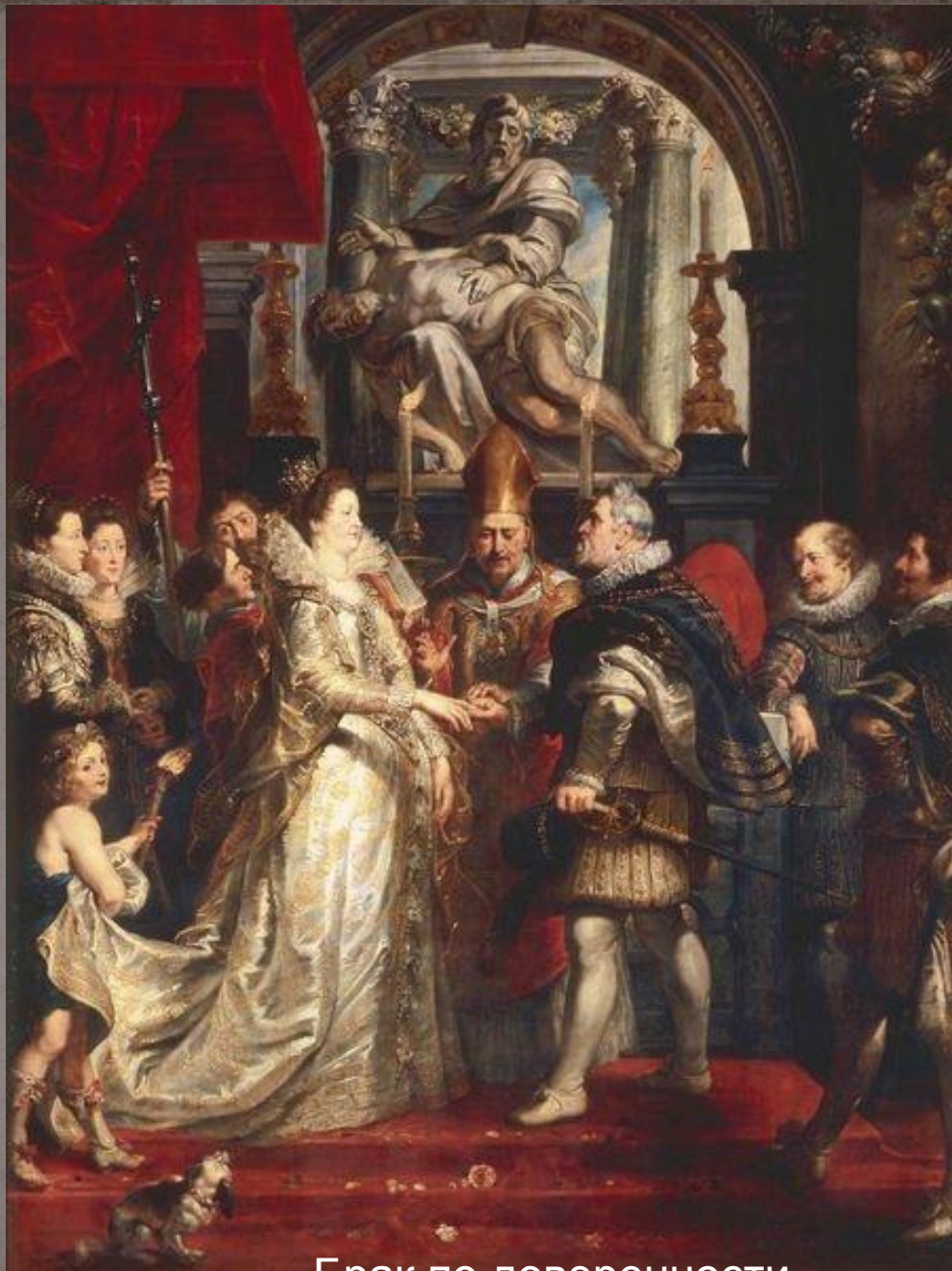
Брак по доверенности

Символическая — поскольку проходила в отсутствие жениха — церемония свадьбы состоялась 5 октября 1600 года в кафедральном соборе Флоренции .