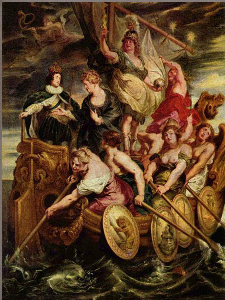
Совершеннолетие Людовика XIII