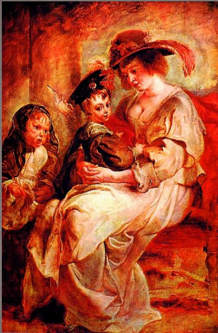
● Питер Пауэл Рубенс. «Портрет Елены Фаурмент с детьми». Около 1636, Лувр