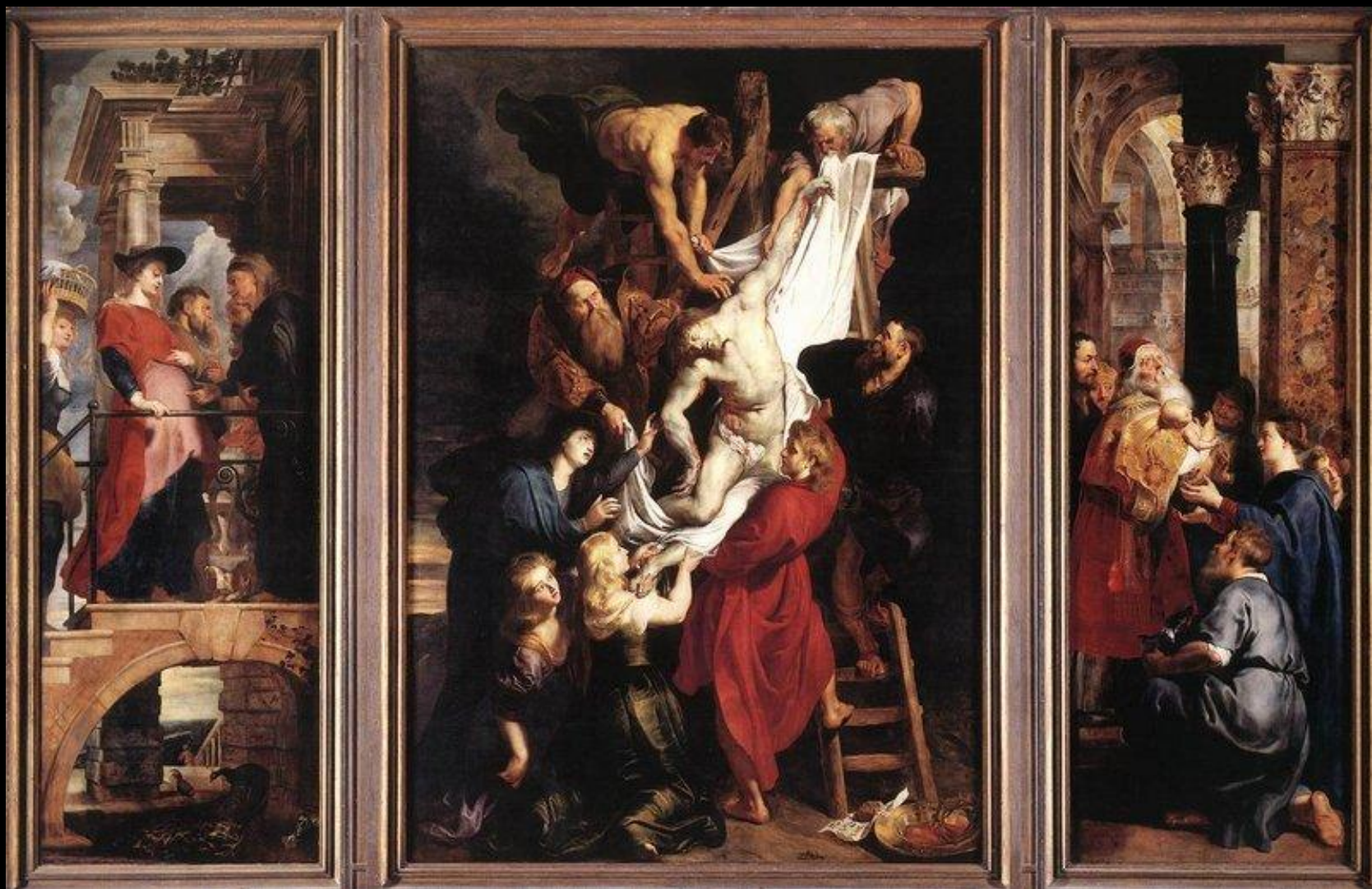
Снятие с креста, 1612 Собор Антверпенской Богоматери