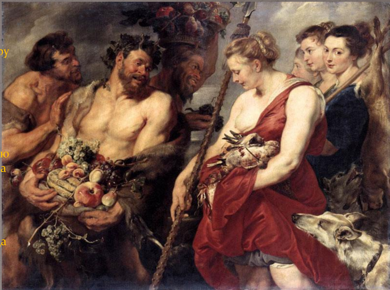
«Возвращение Дианы с охоты» 1615 Дрезденская картинная галерея, Германия

Что бы он ни рисовал — белокурую Венеру в окружении нимф или задумчивую Богоматерь с ребенком на руках, сияющую светом аллегория мощных фигур на облаках, плодородный пейзаж возле дома, — его творчество всегда было гимном, восхваляющим красоту нашего мира.