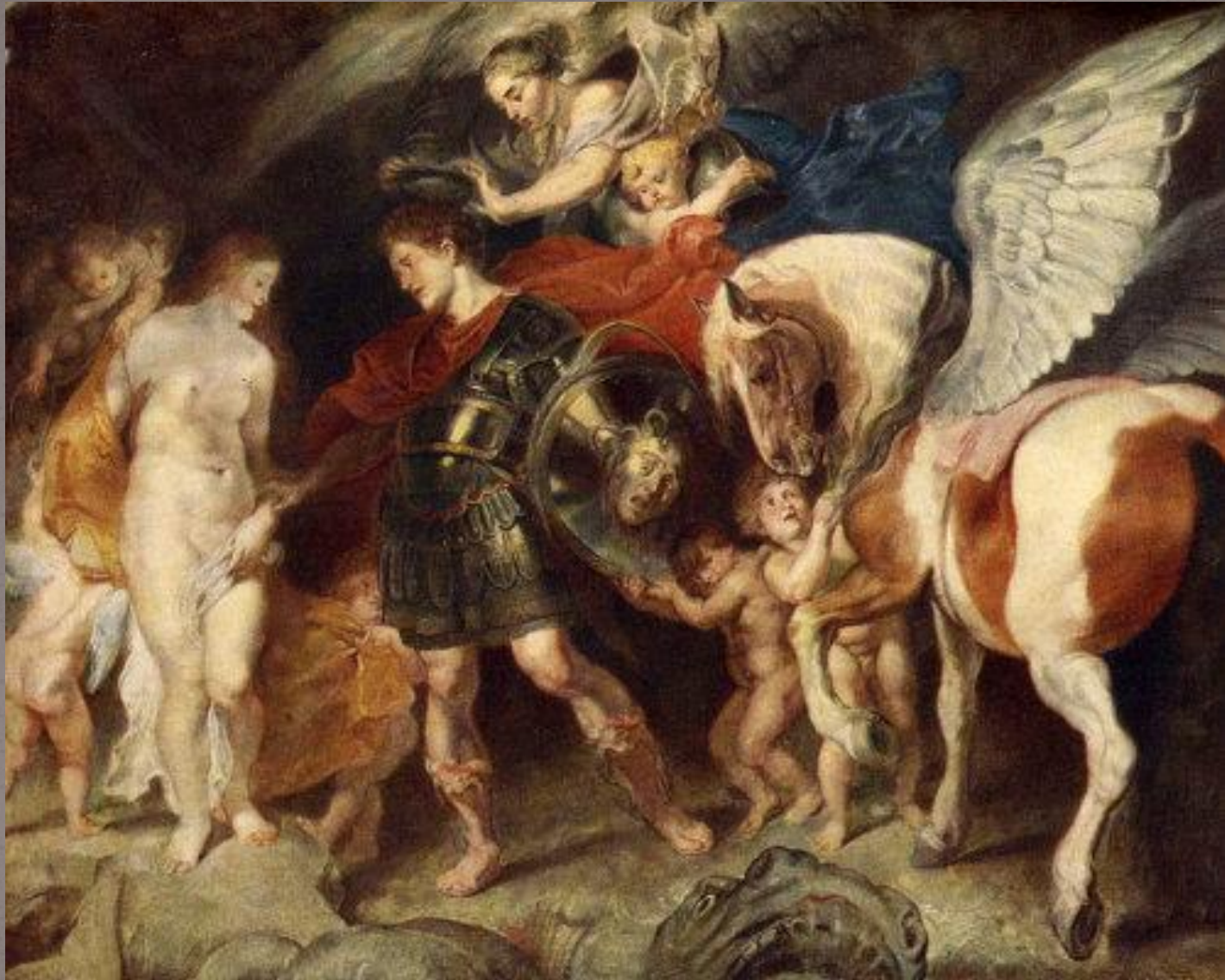
Персей и Андромеда