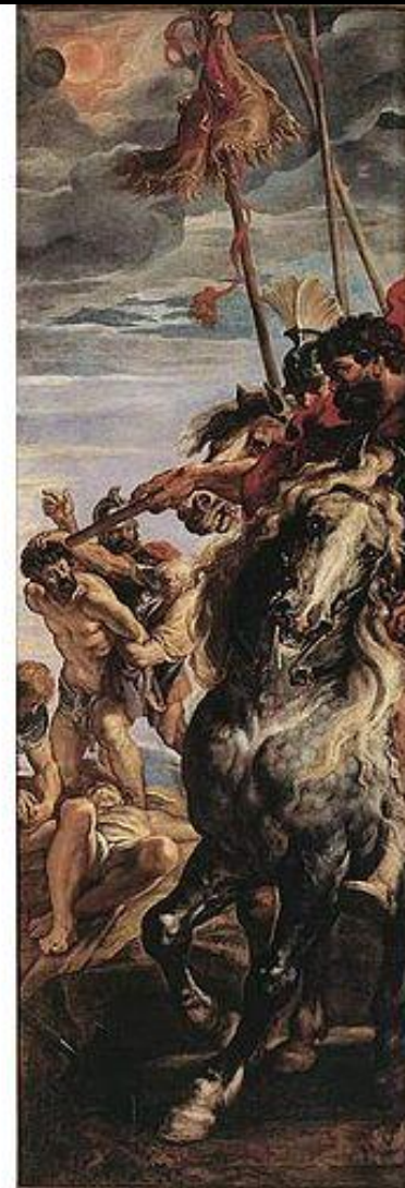
Воздвижение Креста Господня. Полное изображение триптиха , Собор Антверпенской Богоматери