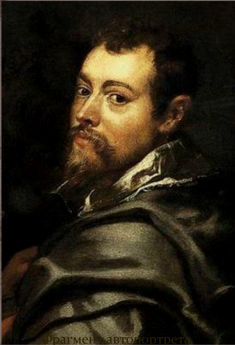
Фрагмент автопортрета Фальфраф Ришартц Музей, Кельн

Выдающийся фламандский живописец Питер Пауль Рубенс (1577-1640) был человеком редкого по масштабу гения, который обладал всеми достоинствами, столь необходимыми как для великих свершений в искусстве, так и для успеха в обществе, — мощным интеллектом, кипучей энергией, крепким здоровьем, приятной внешностью, удивительным даром гармонии и, в придачу, ясной головой для творческой и деловой активности.