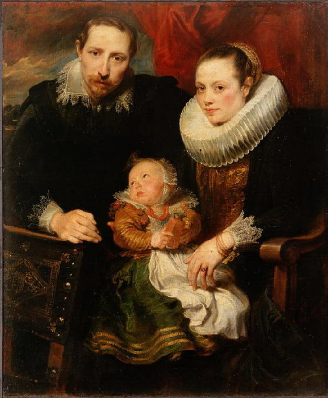
Ван Дейк «Семейный портрет», 1621 год Холст , масло. Размеры: 113.5 на 93.5 сантиметров. Государственный Эрмитаж,