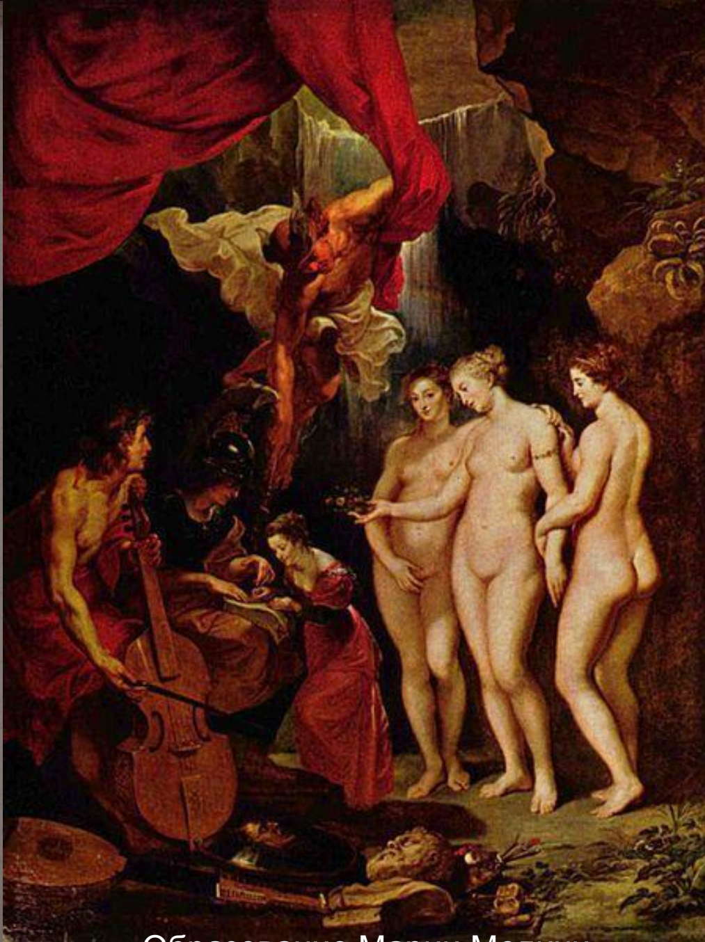
Образование Марии Медичи

Мария Медичи изображена склонившейся перед Минервой Мария Медичи изображена склонившейся перед Минервой, богиней мудрости, наук и искусств. Сцена выполнена в соответствии с христианской иконографией, подобно сцене преклонения девы Марии Мария Медичи изображена склонившейся перед Минервой, богиней мудрости, наук и искусств. Сцена выполнена в соответствии с христианской иконографией, подобно сцене преклонения девы Марии перед Святой Анной .