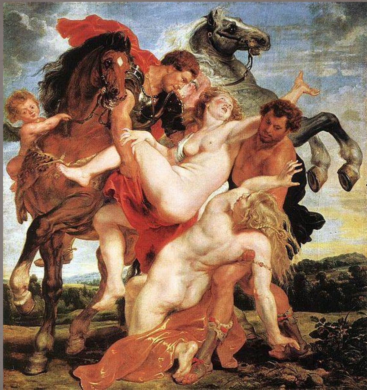
Похищение дочерей Левкиппа, 1617—1618, Холст, масло . 224×211 см Мюнхен