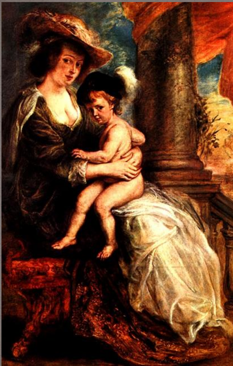
Питер Пауэл Рубенс. «Портрет Елены Фаурмент с сыном Френсисом».