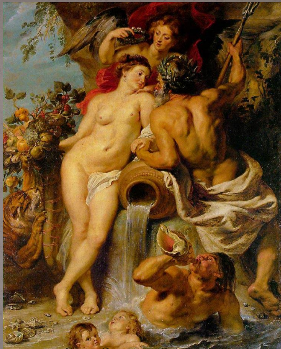
«Союз Земли и Воды» 1618 Государственный Эрмитаж

● Эта картина заключала в себе глубокий смысл, связанный с надеждой Рубенса на скорейшее процветание родины. После раздела Нидерландов Фландрия потеряла выход к морю. Союз двух природных стихий Земли и Воды – это надежда на установление мира, мечта художника о союзе Фландрии с морем.