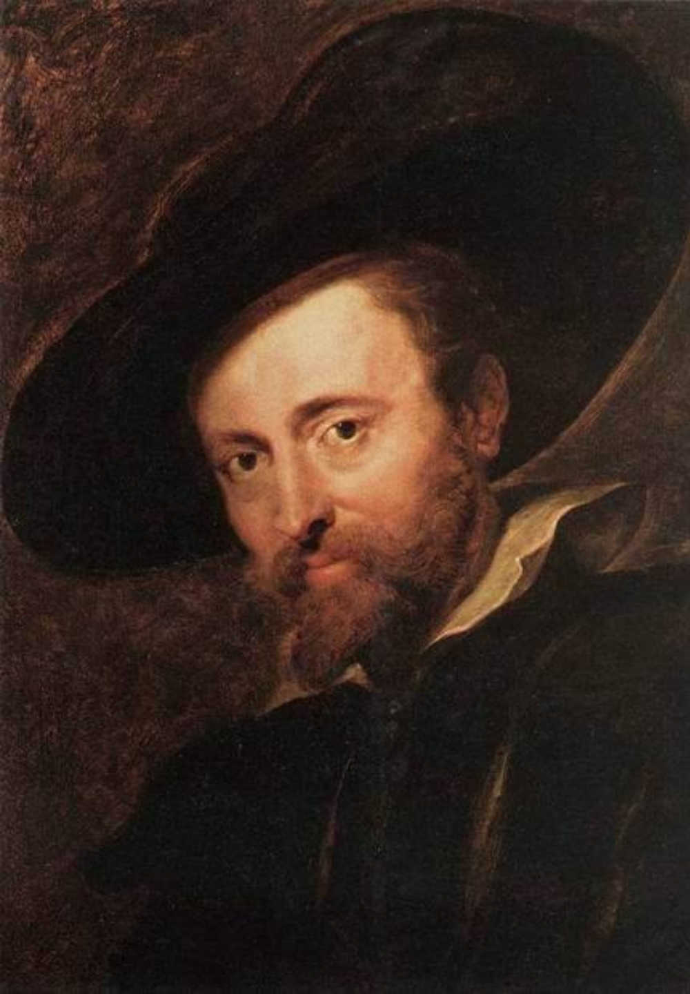
Автопортрет, 1628-1630. Холст, масло. Дом-музей Рубенса, Антверпен