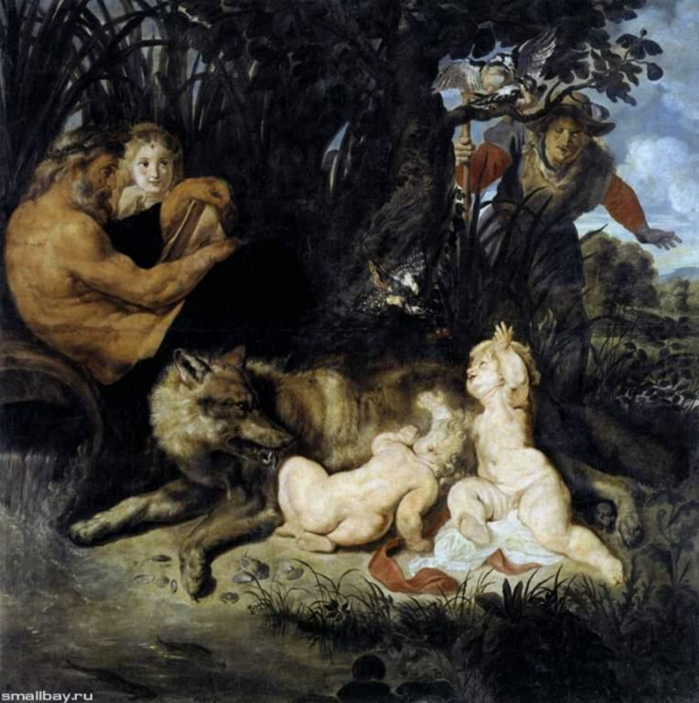
Ромул и Рем с волчицей, 1616 Капитолийская пинакотека, Рим