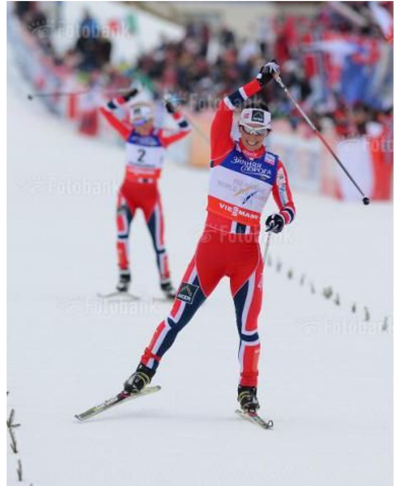
WWW.FOTOBANK.RU_G522-3631 Getty Images Sport EO VAL DI FIEMME, ITALY - FEBRUARY 23: Marit Bjørgen of Norway celebrates victory as she crosses the finish line during the Women's Skiathlon 7.5km at the FIS Nordic World Ski Championships on February 23, 2013 in Val di Fiemme, Italy. (Photo by Mike Hewitt/Getty Images)