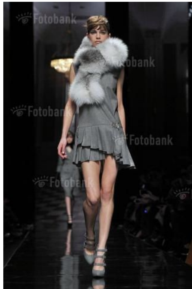
HH21-0814 MILAN, ITALY - FEBRUARY 23: A model walks the runway at the Ermanno Scervino fashion show as part of Milan Fashion Week Womenswear Fall/Winter 2013/14 on February 23, 2013 in Milan, Italy.