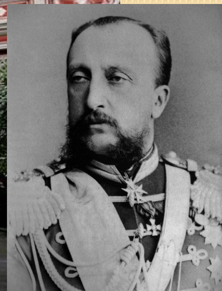
Великий князь Николай Николаевич, сын Николая I