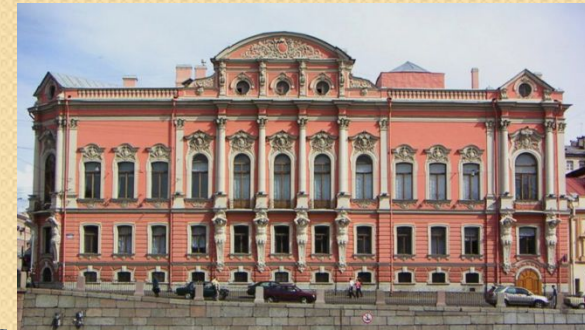
Дворец Белосельских - Белозерских