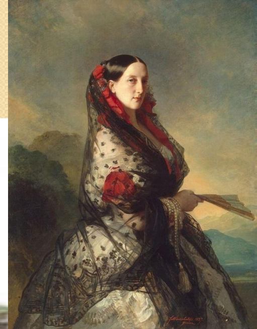
Мария Николаевна, дочь Николая I