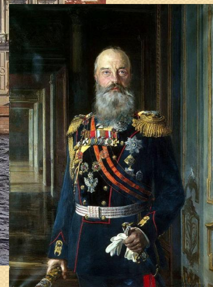
Великий князь Михаил Николаевич, сын Николая I