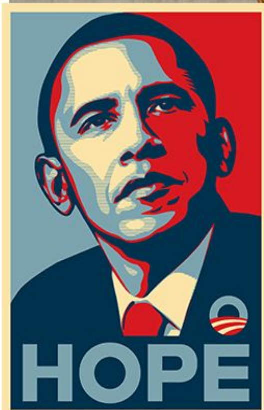
← "НАДЕЖДА", ШЕПАРД ФЕЙРИ. 2008