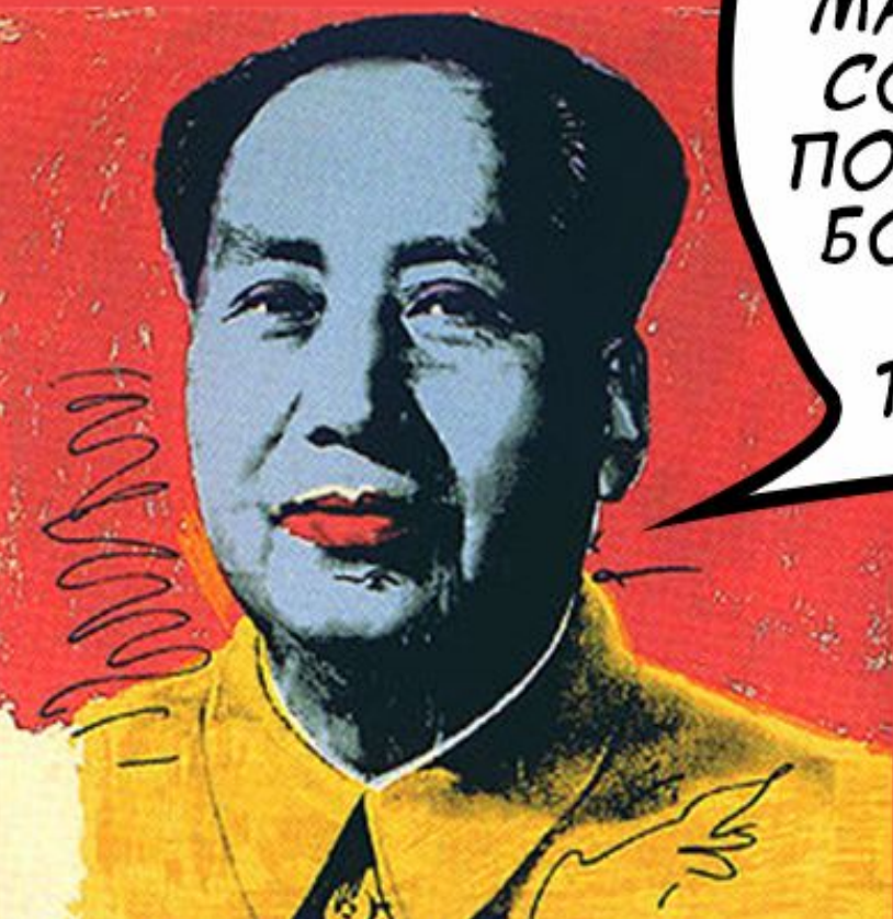
←-МАО ЦЗЕ ДУН, ЭНДИ УОРХОЛ, 1972

ПОП-АРТ — ЭТО ХУДОЖЕСТВЕННЫЙ СТИЛЬ, ОБРАЩЕННЫЙ К МАТЕРИАЛЬНЫМ РЕАЛИЯМ ПОВСЕДНЕВНОЙ ЖИЗНИ, К МАССОВОЙ КУЛЬТУРЕ (ОТКУДА, СОБСТВЕННО И ПРИШЛО СЛОВО ПОП). ПОП-АРТ ЯВЛЯЕТСЯ ПРОИЗВОДНЫМ ОТ БОЛЬШИНСТВА ВИЗУАЛЬНЫХ УДОВОЛЬСТВИЙ ЛЮДЕЙ, ТАКИХ КАК ТЕЛЕВИЗОР, ЖУРНАЛЫ И КОМИКСЫ.