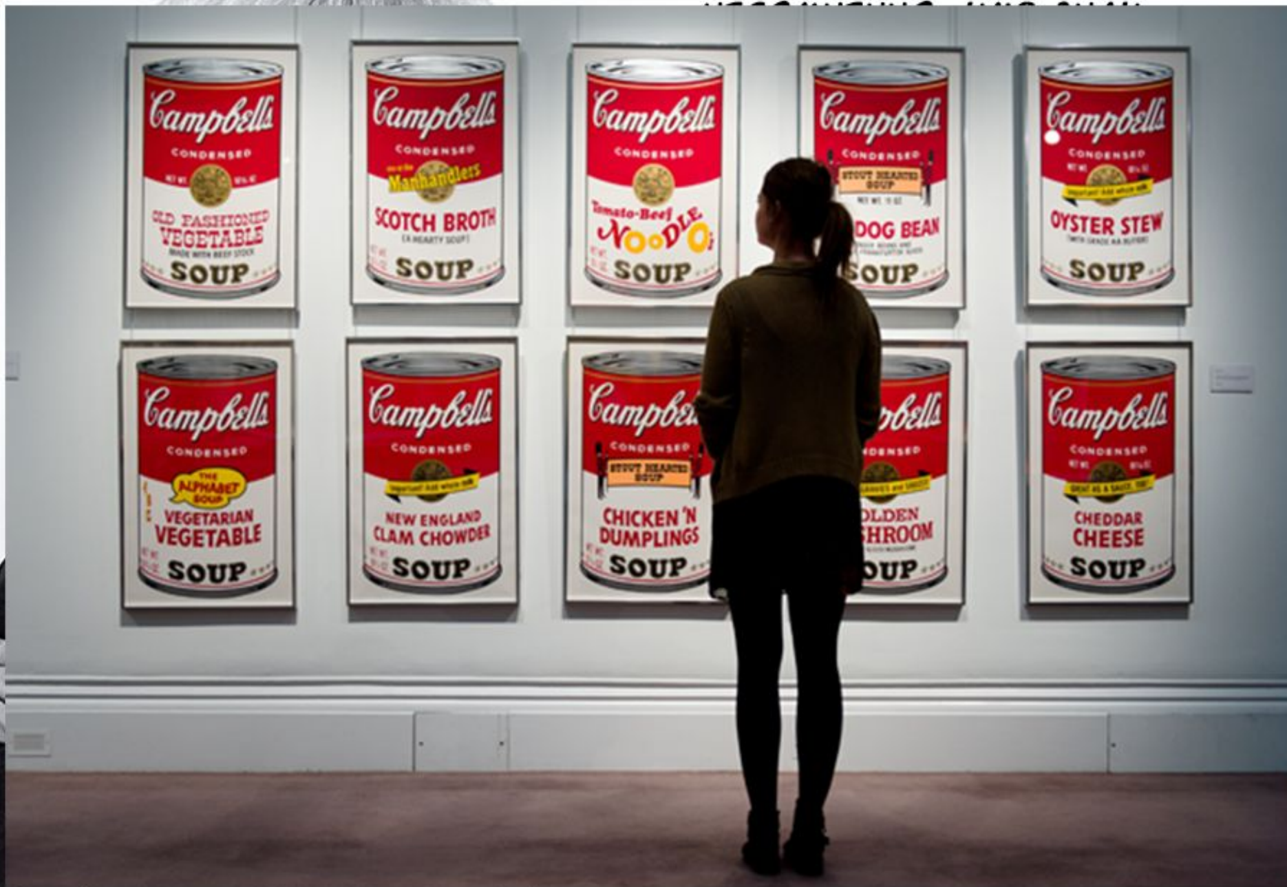
(Слева Энди Уорхол)