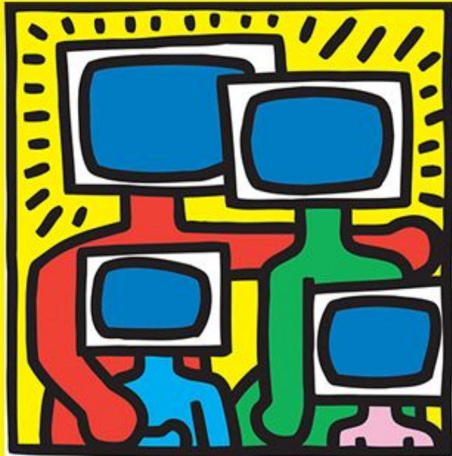
<- БЕЗ НАЗВАНИЯ -> КИТ ХАРИНГ

ДВИЖЕНИЕ ПОП-АРТ ПОЯВИЛОСЬ В АНГЛИИ В СЕРЕДИНЕ 1950-Х ГОДОВ И В СОЕДИНЕННЫХ ШТАТАХ – В КОНЦЕ 50-Х. ПОП-АРТ ХУДОЖНИКИ ХОТЕЛИ БРОСИТЬ ВЫЗОВ ТРАДИЦИОННОМУ ИСКУССТВУ ПОЛАГАЯ, ЧТО ИСПОЛЬЗОВАНИЕ ХУДОЖНИКОМ ВИЗУАЛЬНЫХ ЭЛЕМЕНТОВ СМИ ТОЖЕ МОЖНО СЧИТАТЬ ИСКУССТВОМ.