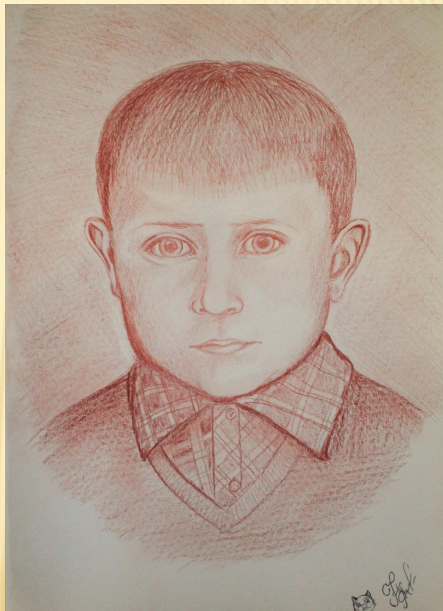
Карандаш цв. «сепия»

Кроме черного карандаша также можно использовать карандаши других цветов, к примеру «сепия» или сочетание и того и другого цвета.