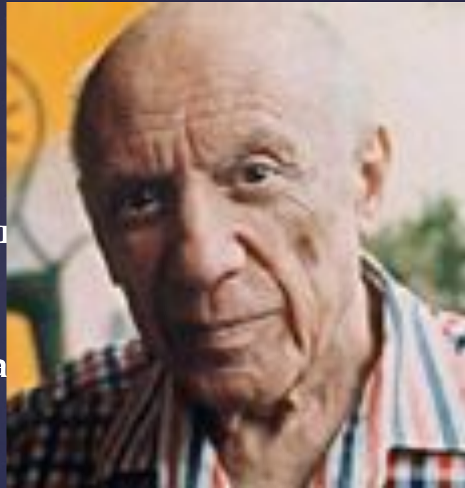
Пабло Пикассо испанский художник 1881-1973

Условность – это средство, с помощью которого художник передаёт свои мысли. П. Пикассо высказал свои мысли по этому поводу: «Мы все знаем, что искусство не есть истина. Искусство – ложь, но эта ложь учит нас постичь истину»