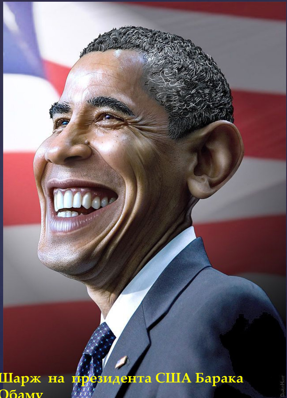
Шарж на президента США Барака Обаму