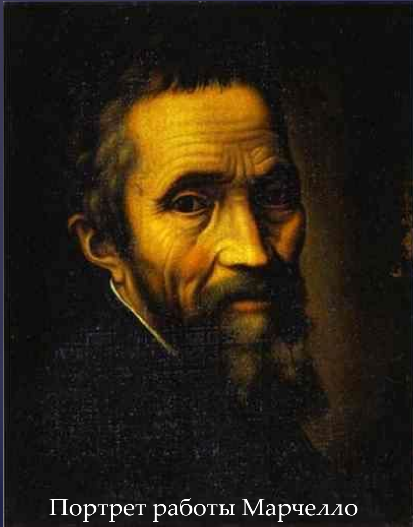
Портрет работы Марчелло Венусти (1535)

История искусства приводит пример о правде и правдоподобии (художественном вымысле).