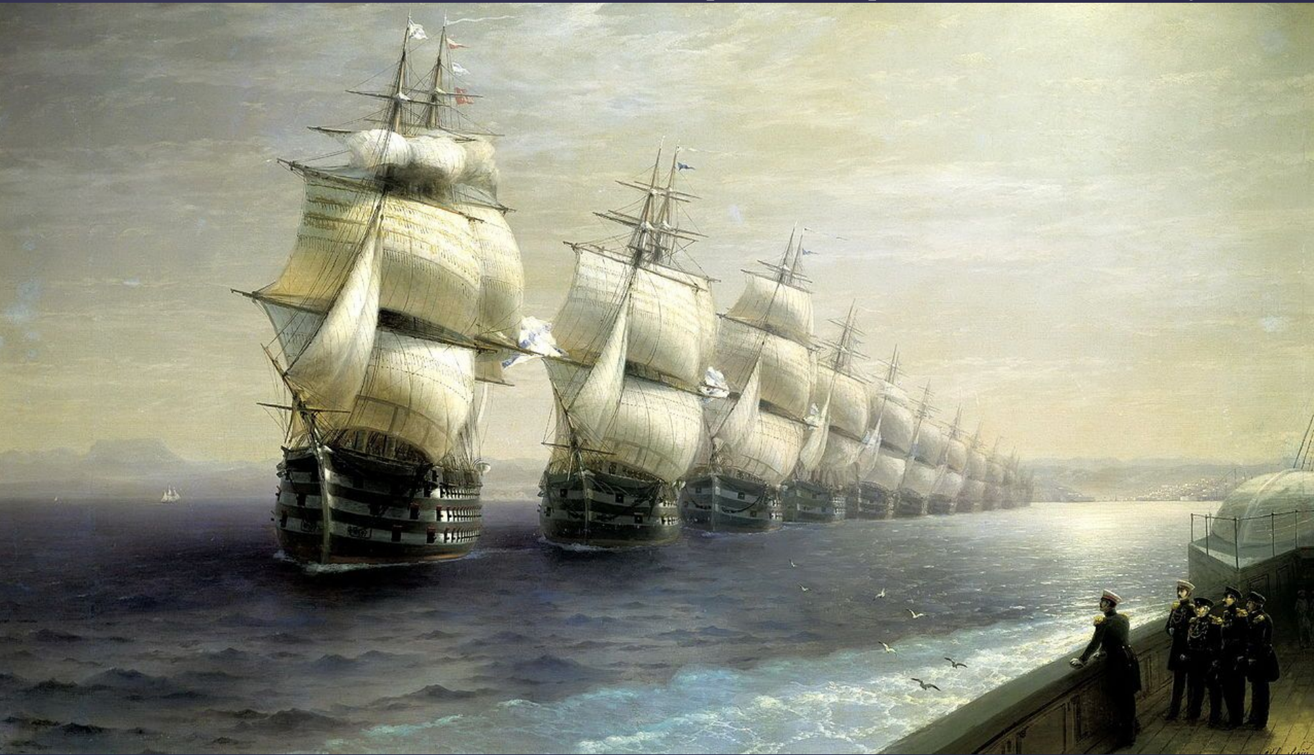
И. К. Айвазовский Смотр Черноморского флота в 1849 г.