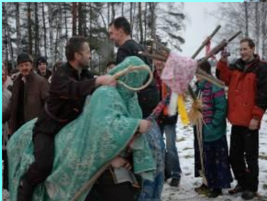
Бой в конном строю