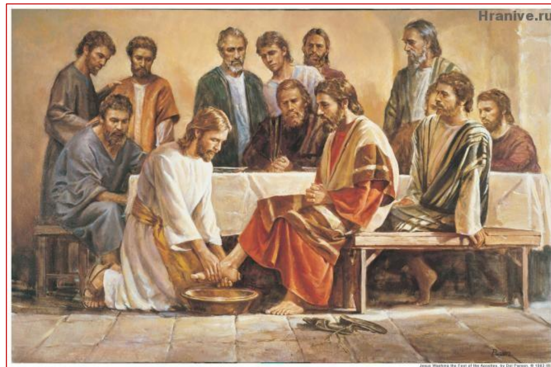
(Американский художник Дел Парсон)