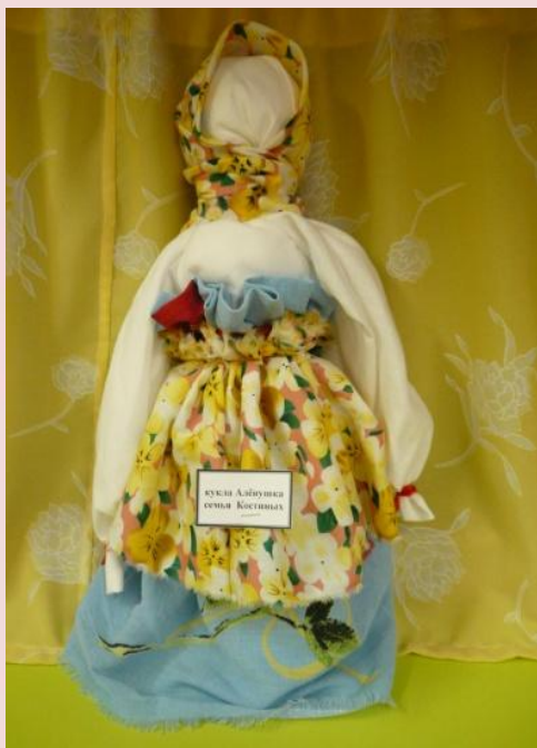
кукла Азбушка семья Кистина