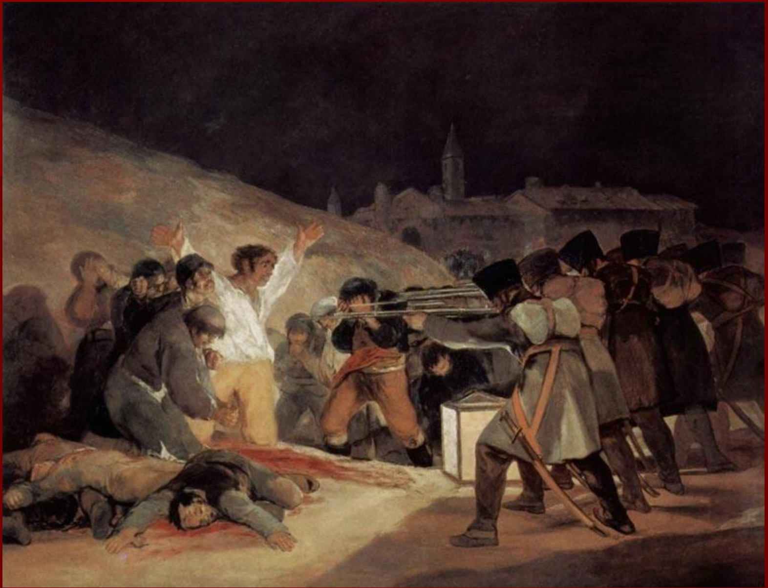
Ф. Гойя «Расстрел повстанцев в ночь на 3 мая 1808 года»