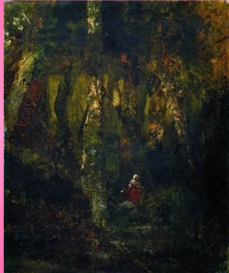
В лесу Фонтенбло