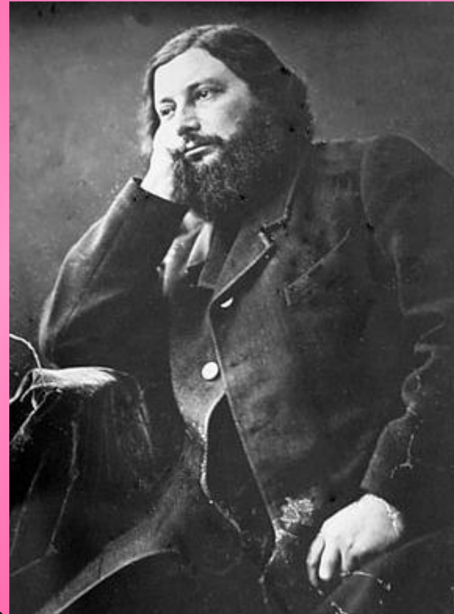
• Гюстав Курбе