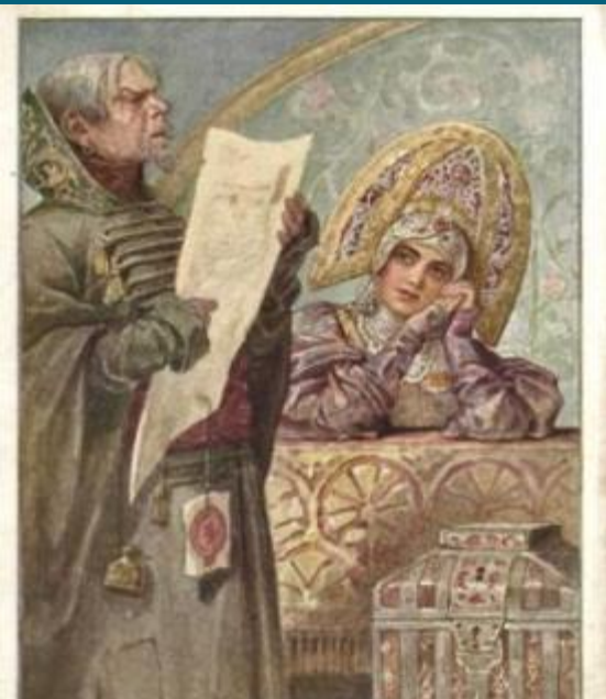
С. Соловьев. Писец