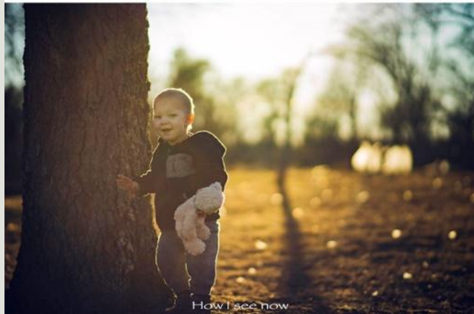
How I see now