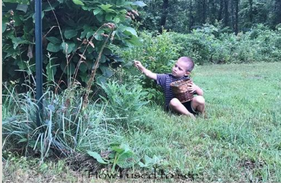
How I used to see