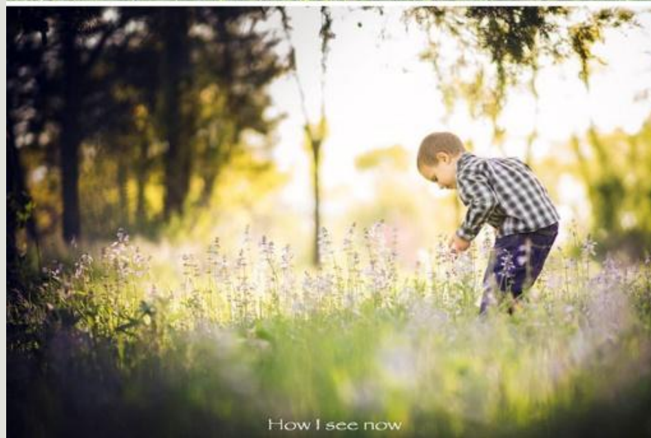
How I see now