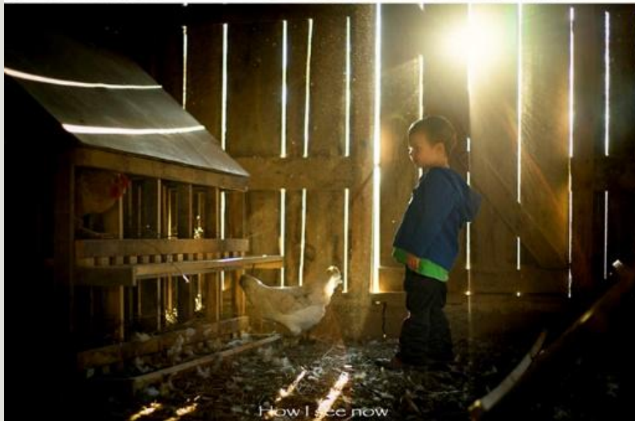
How I see now