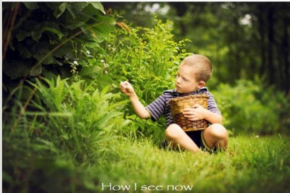
How I see now