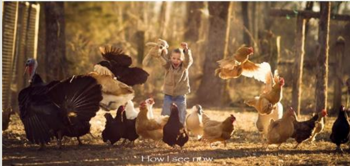
How I see now