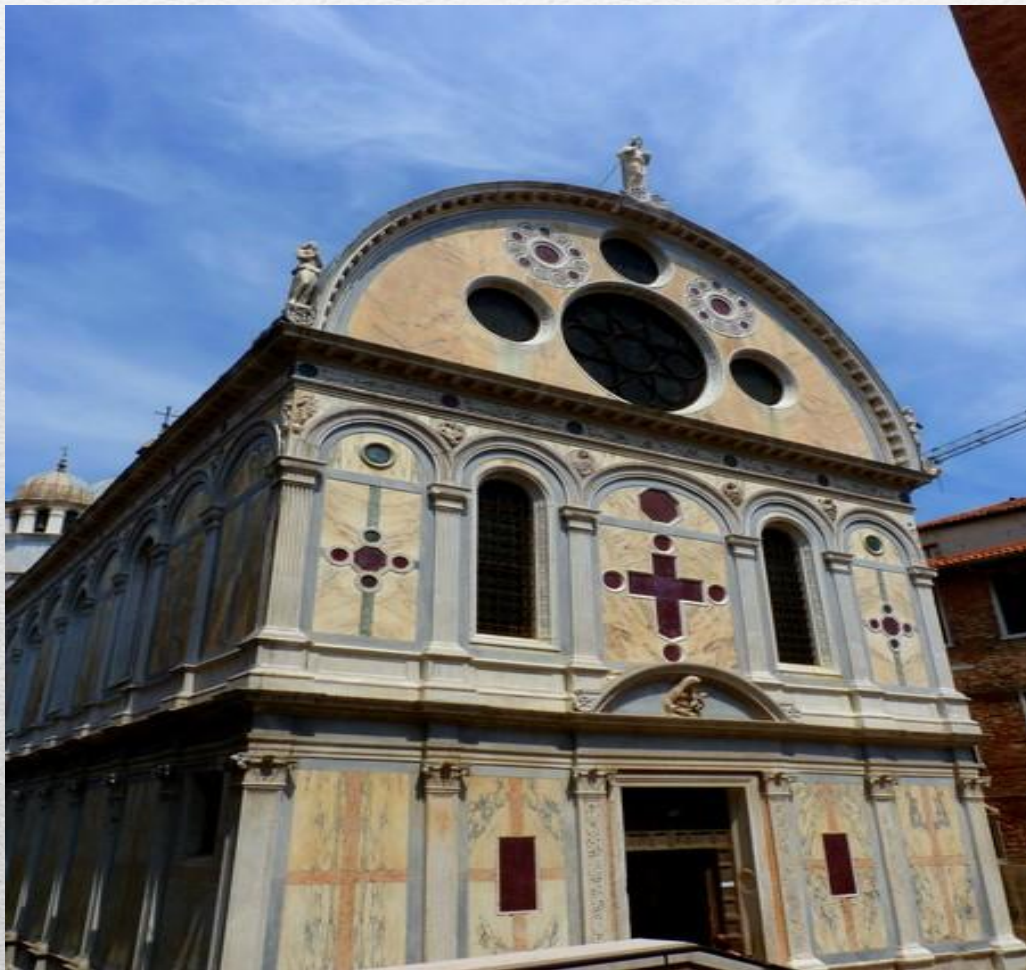
Церква Санта –Марія Дель-Мараколі