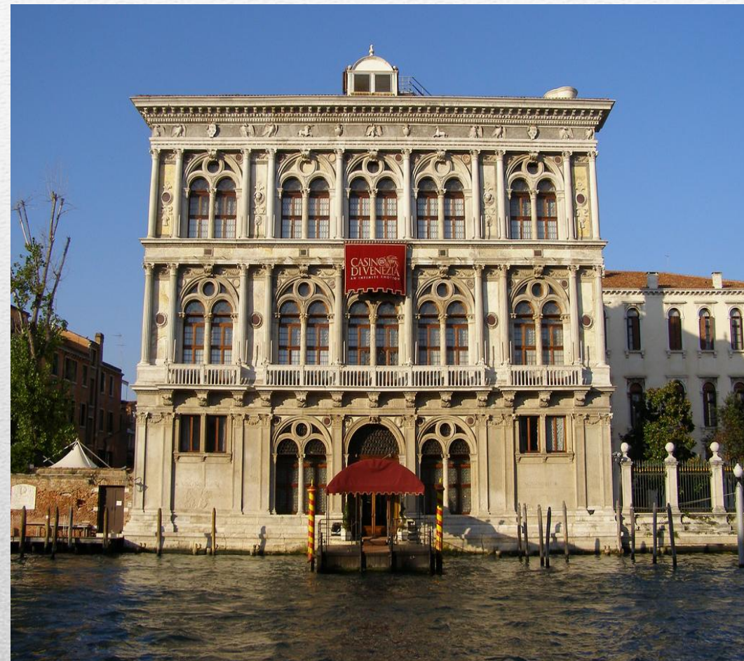
палаццо Вендрамін Калерджі (Венеція)