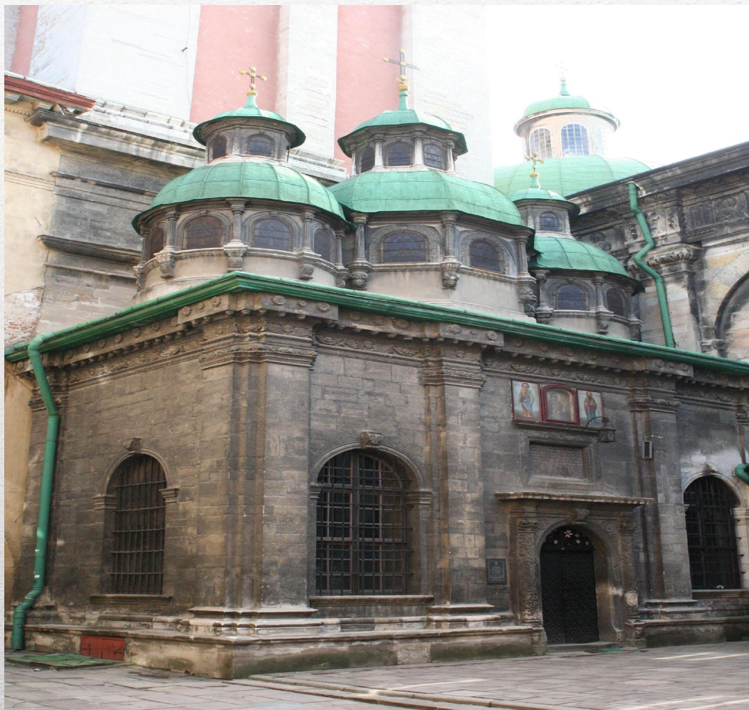
каплиця Трьох Святителів (Львів)