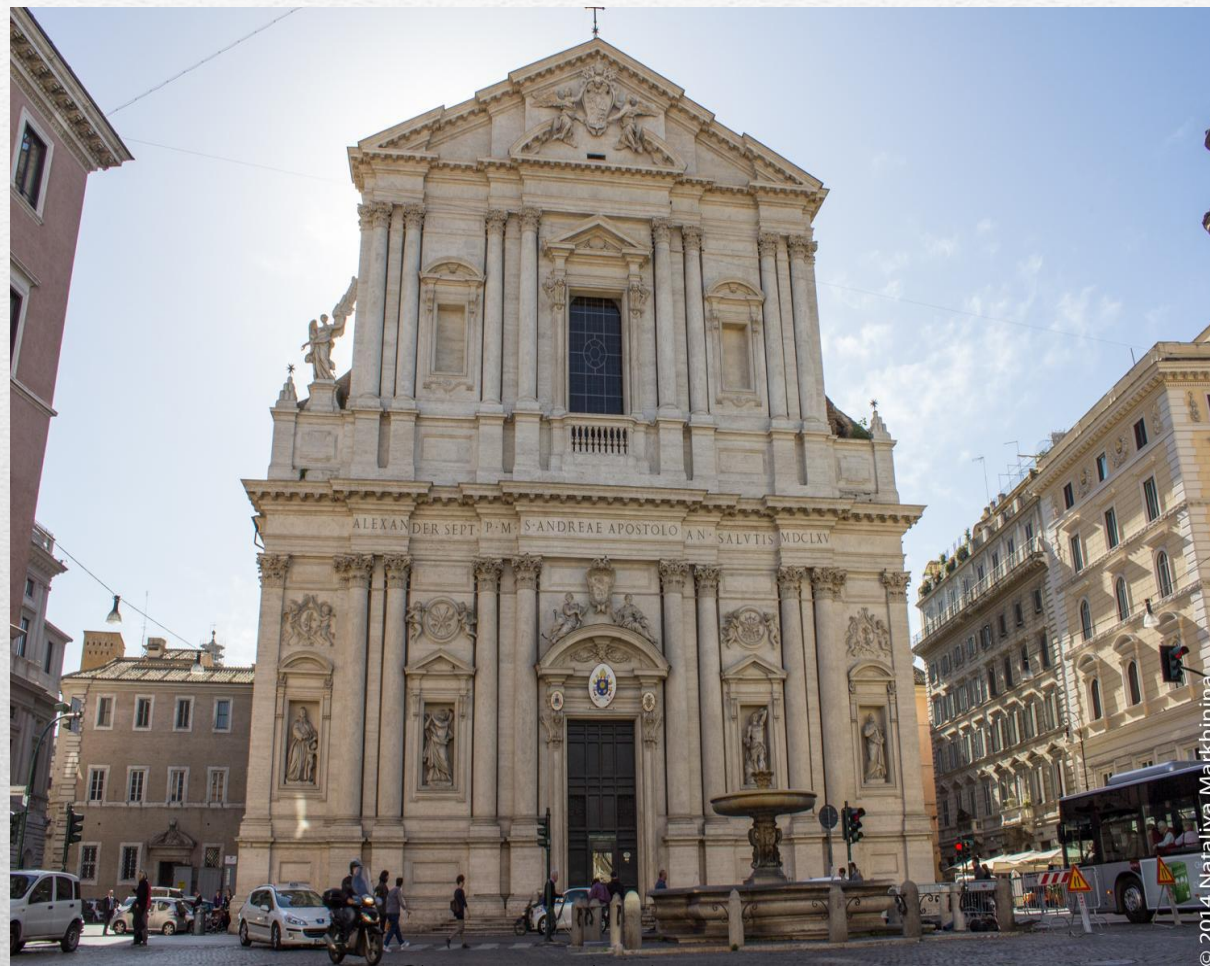
церква Сант-Андреа (Мантуя)