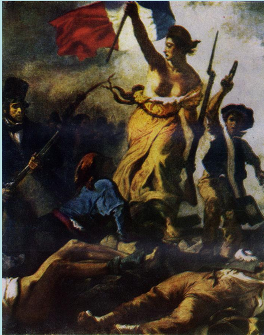
Э. Делакруа Свобода на баррикадах