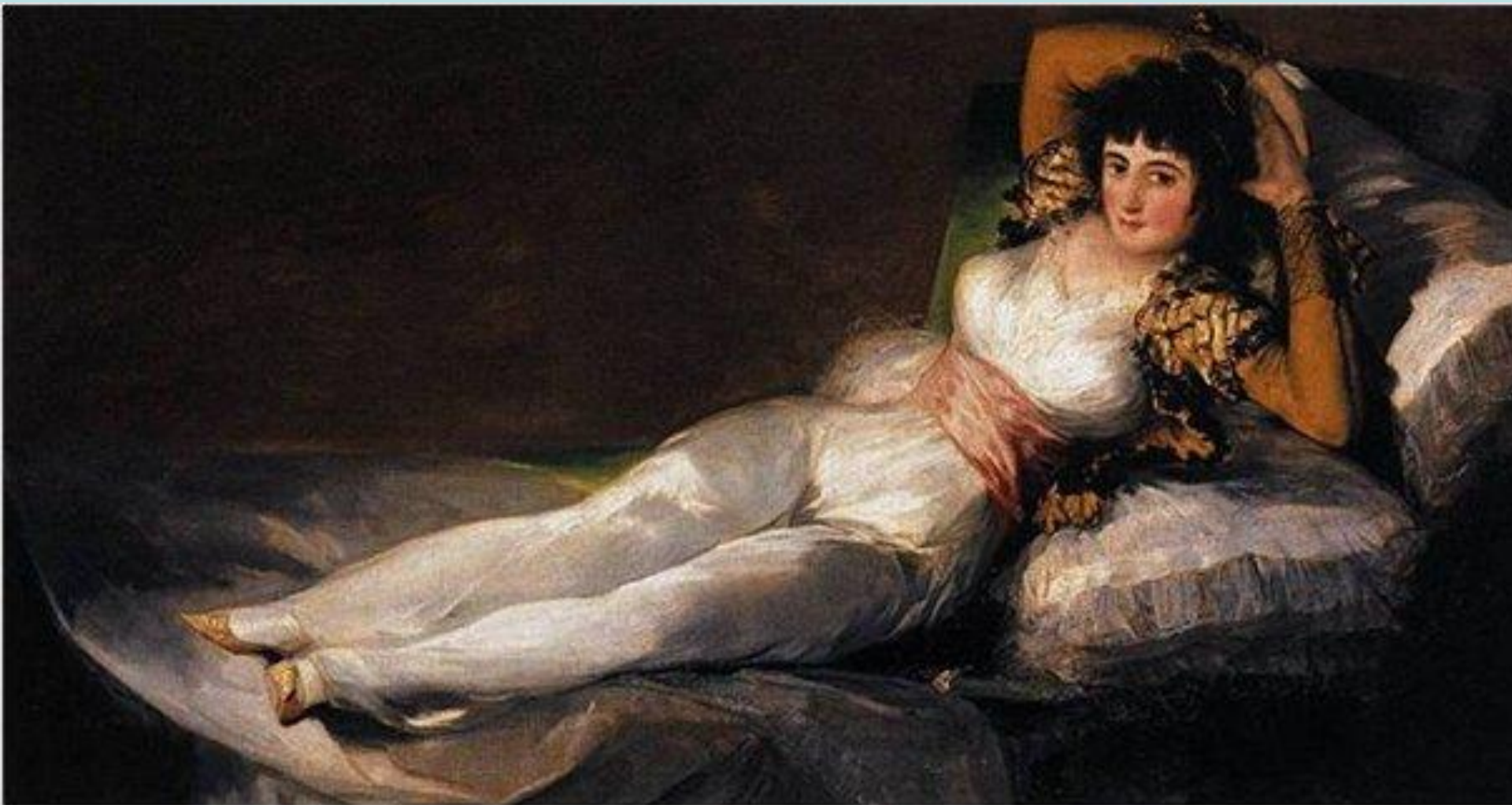
Ф. Гойя Маха одетая