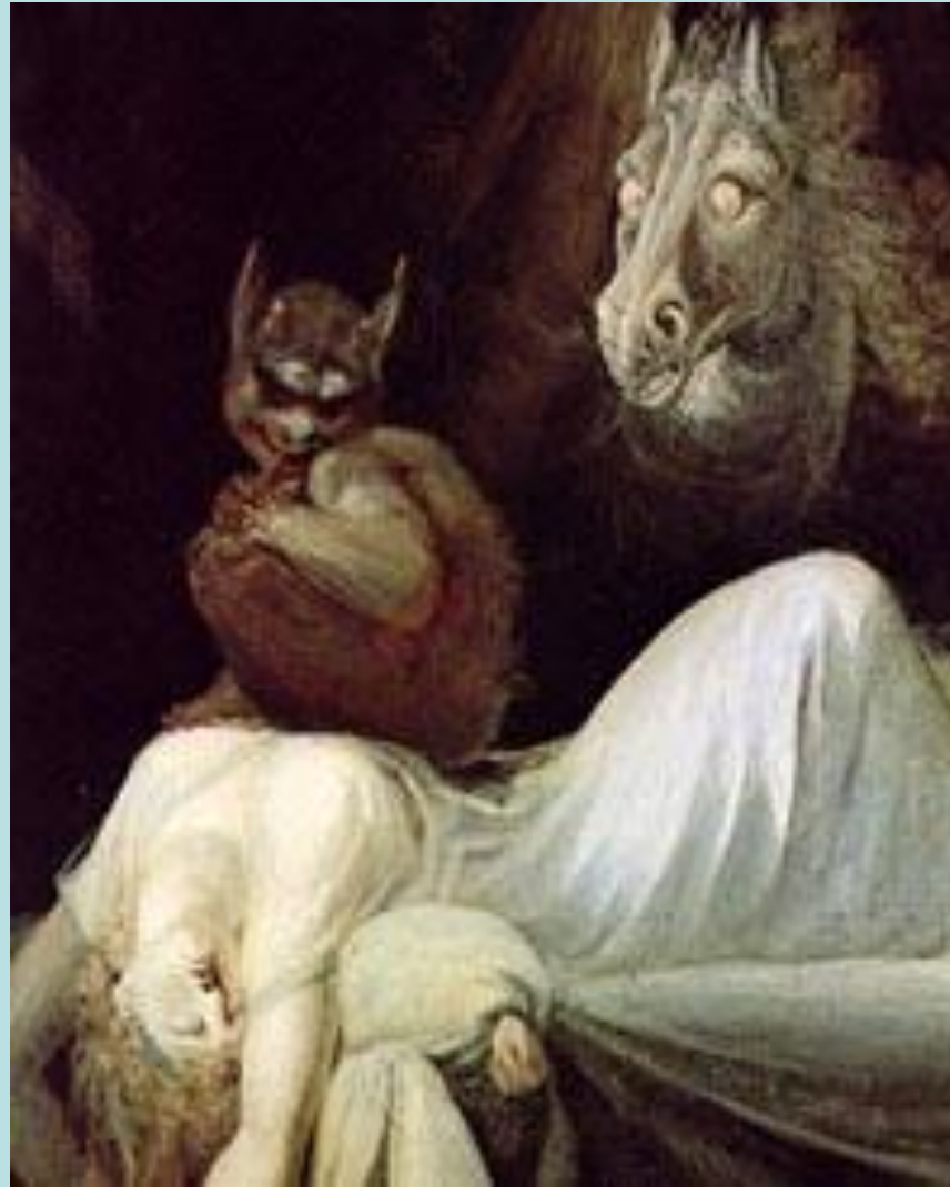
И.Г. Фюсли Ночной кошмар