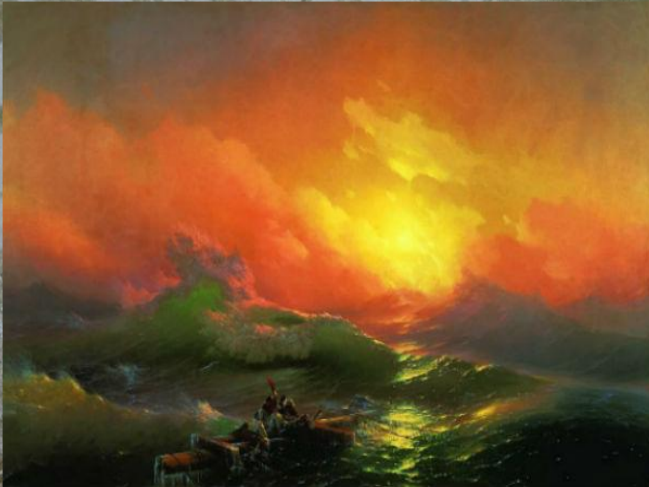
Дев'ятий вал. 1850