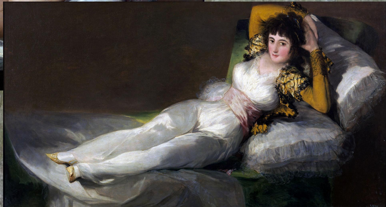
«Маха одягнена», 1802–1805