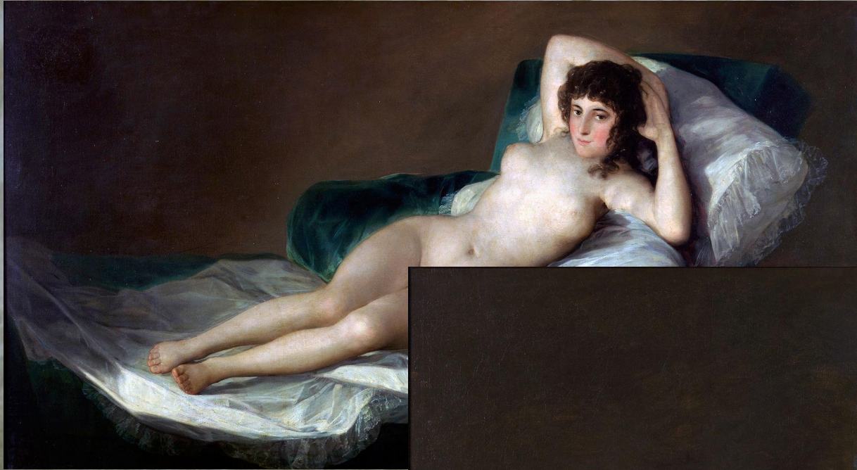
«Маха оголена», 1790–1800