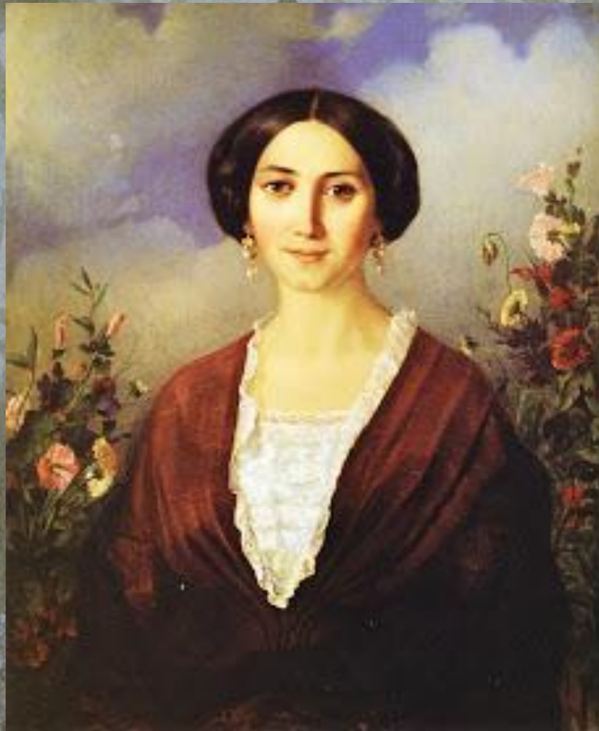
Портрет дружини. 1853