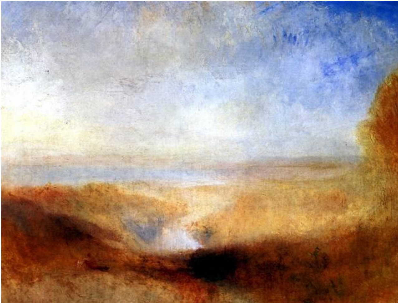
ТЁРНЕР ДЖОЗЕФ МЭЛЛОРД УИЛЬЯМ Пейзаж с далекой рекой и плотиной.

И в масляной живописи, и в акварели работал в необычайно свободной технике .