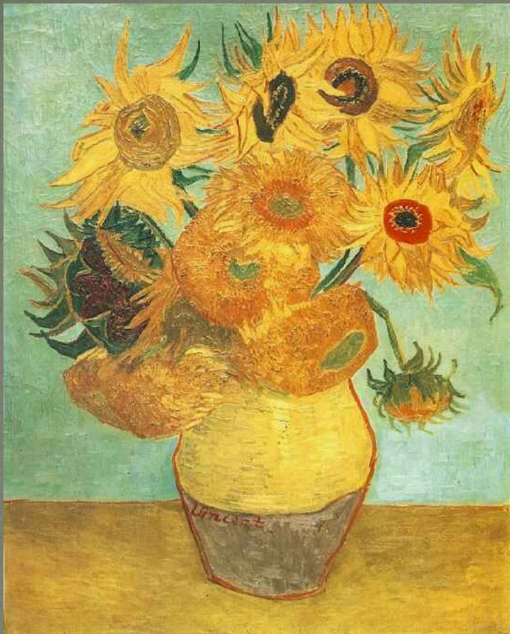
Винсент Ван Гог «Подсолнухи»