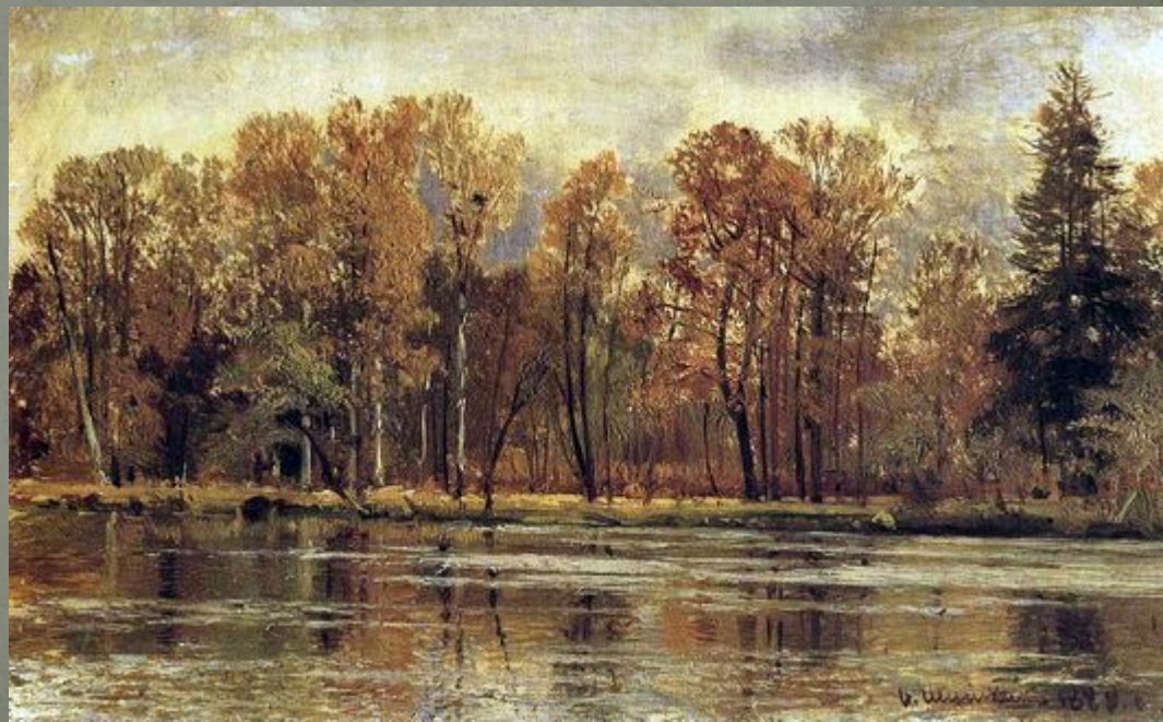
Иван Шишкин «Золотая осень»