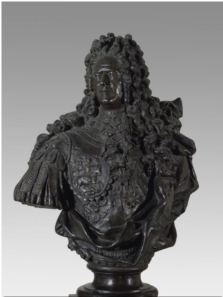
Портрет А.Д. Меншикова