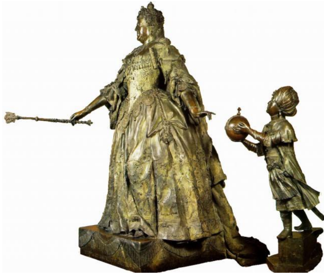
Анна Иоанновна с арапчонком