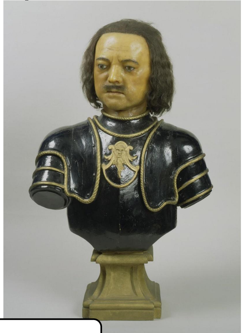
Портрет императора Петра I