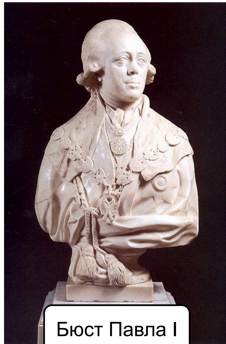
Бюст Павла I