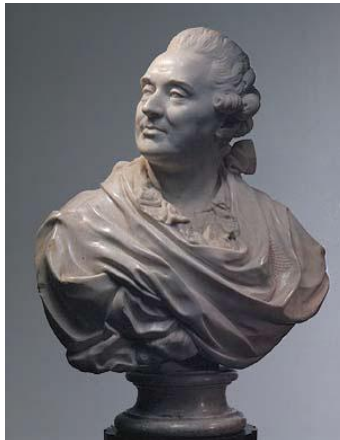
Портрет А. М. Голицына