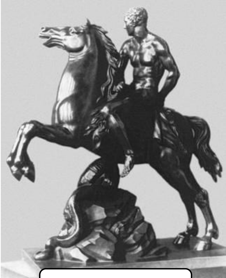
Геркулес на коне