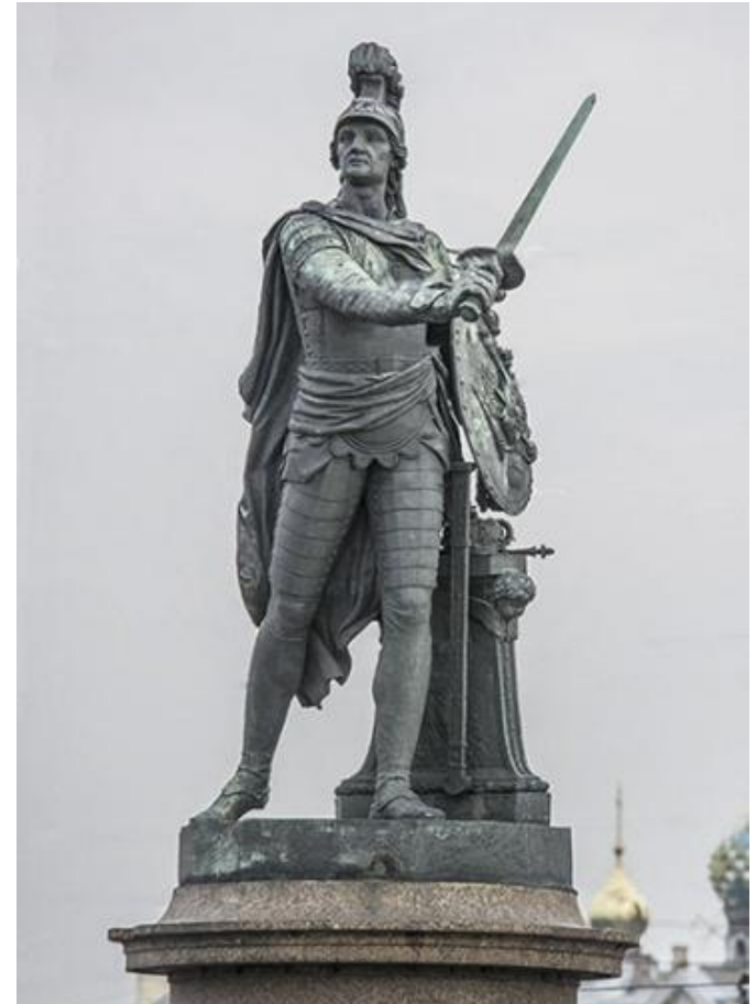
Памятник А.В. Суворову в С.-Петербурге