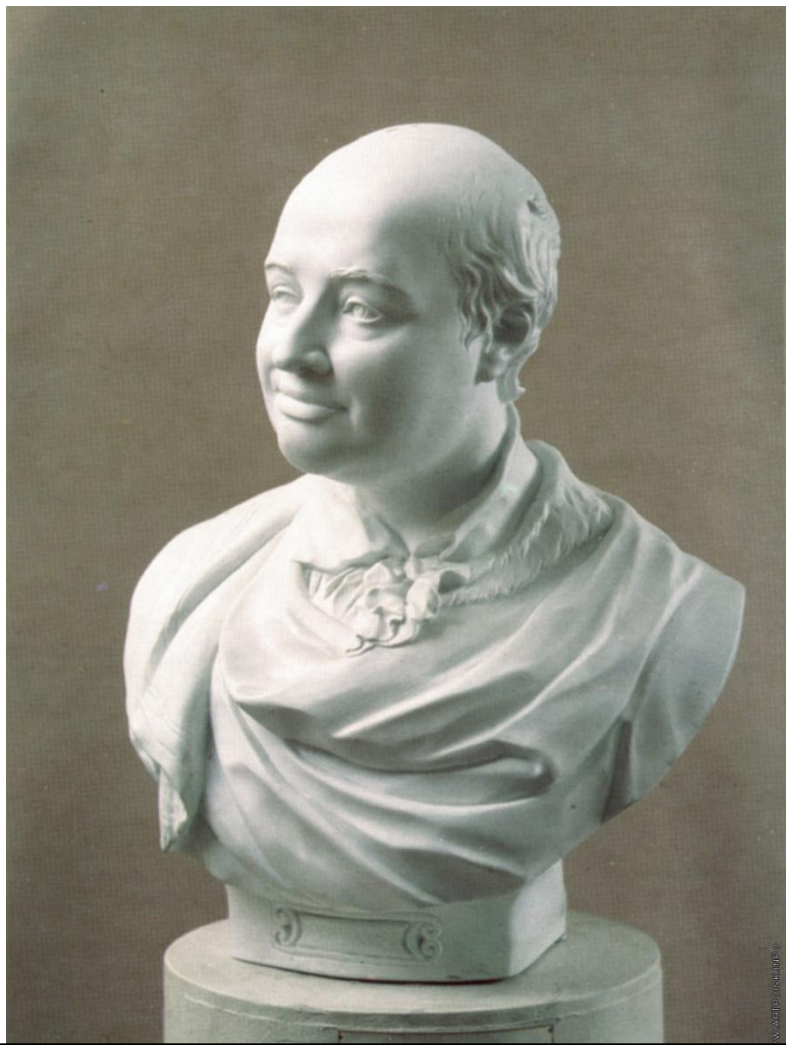
Портрет М.В. Ломоносова