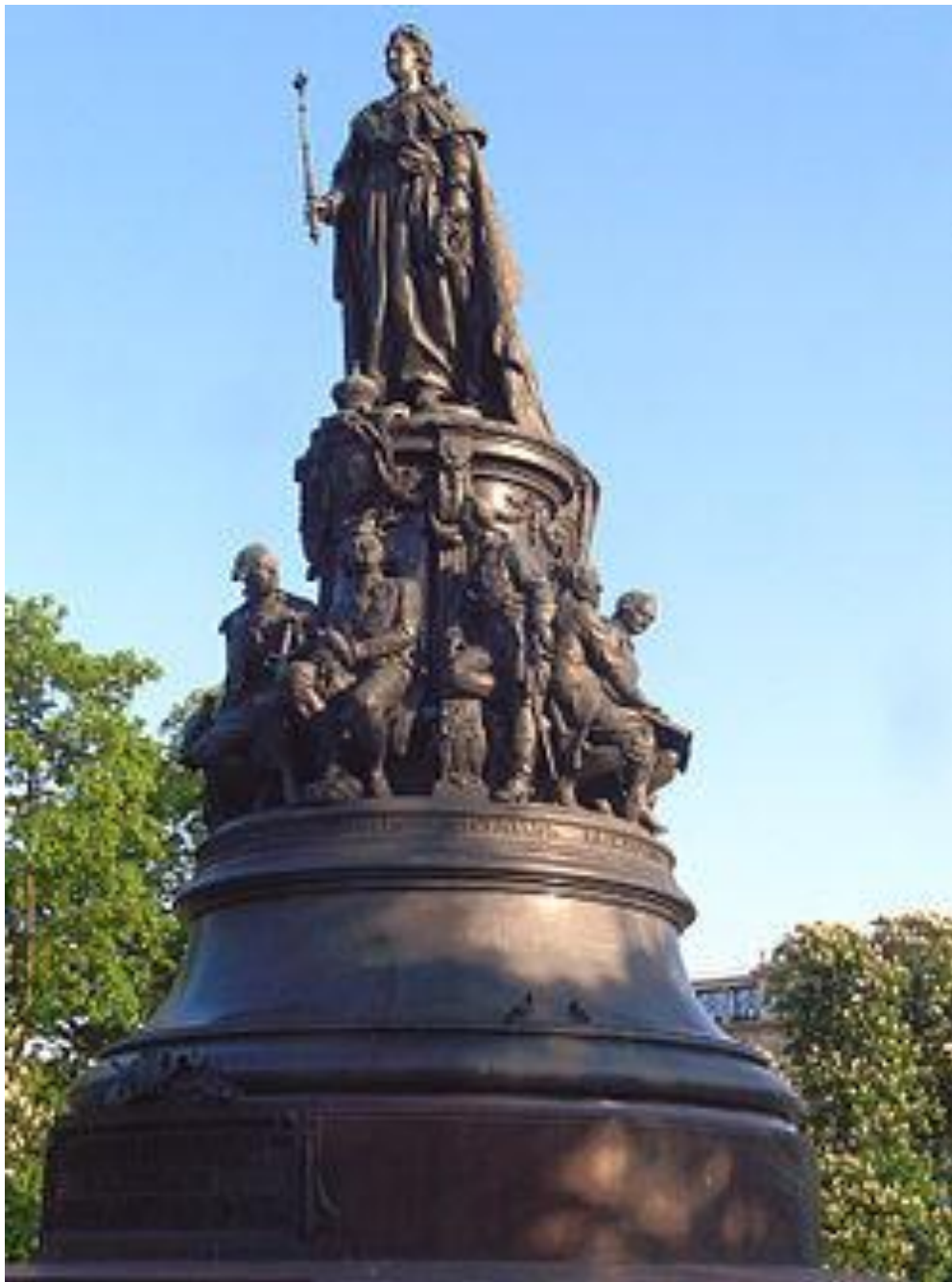
7. М.О.Микешин. Памятник Екатерине II. Санкт- Петербург. 1873. Реализм.