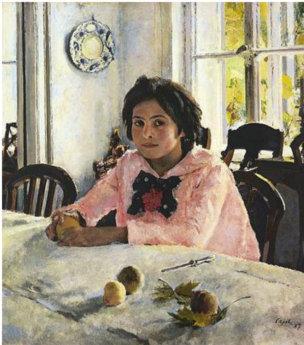
25. В.А.Серов. «Девочка с персиками». 1887. Реализм, Товарищество передвижных художественны х выставок (передвижники).