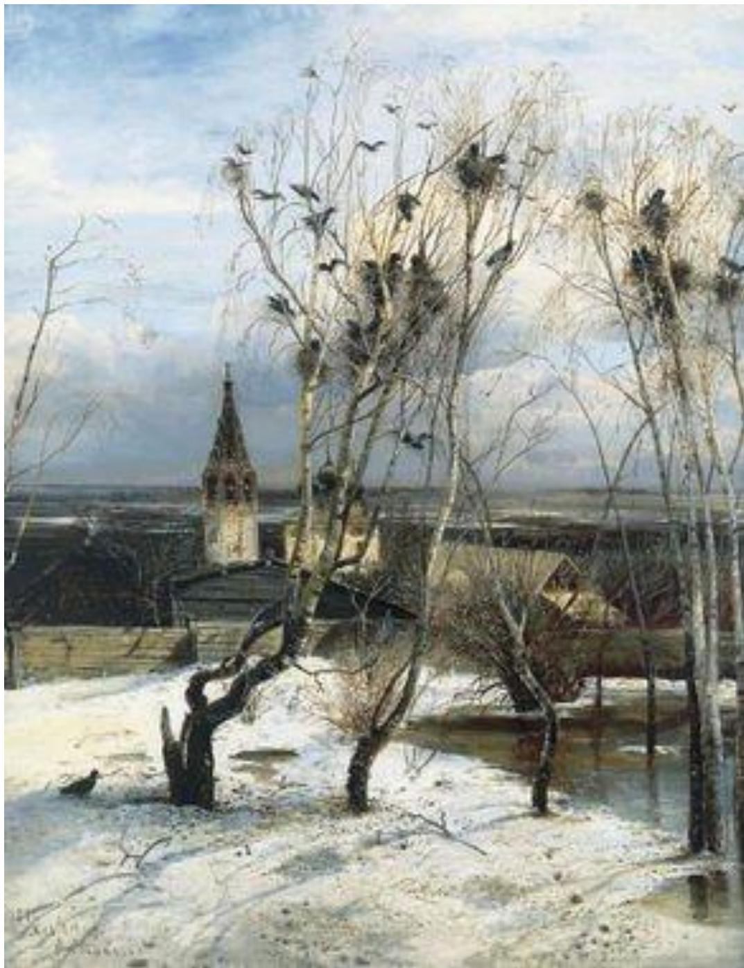
21. А.К.Саврасов. «Грачи прилетели». 1871. Реализм, Товарищество передвижных художественных выставок (передвижники).