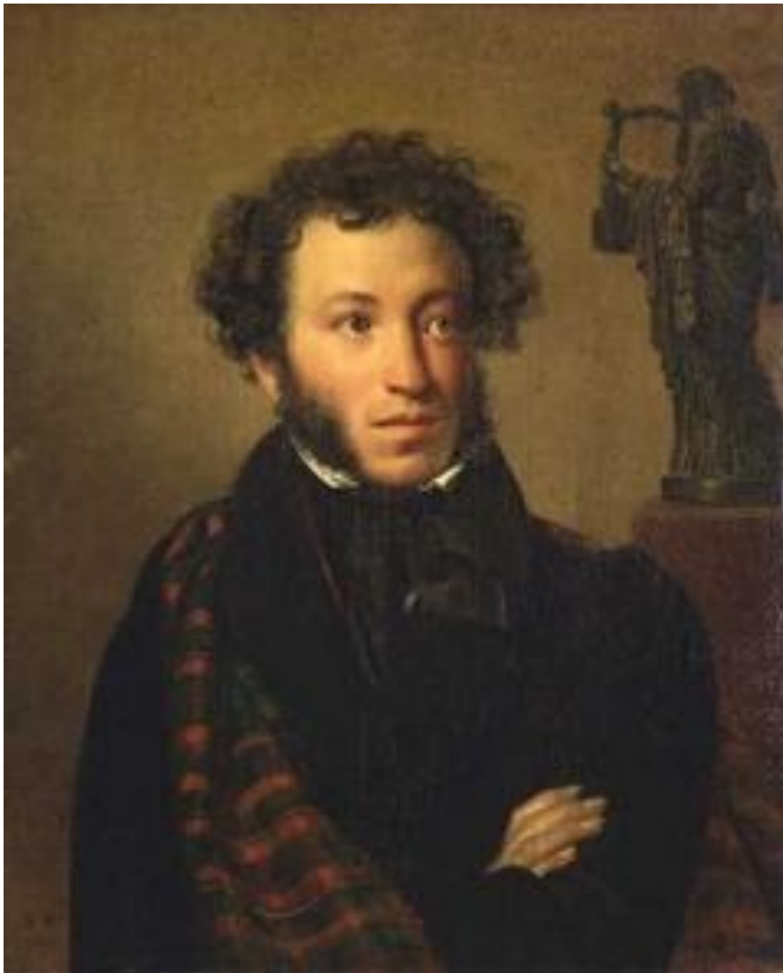
2. О.А. Кипренский. «Портрет А.С. Пушкина». 1827. Романтизм.