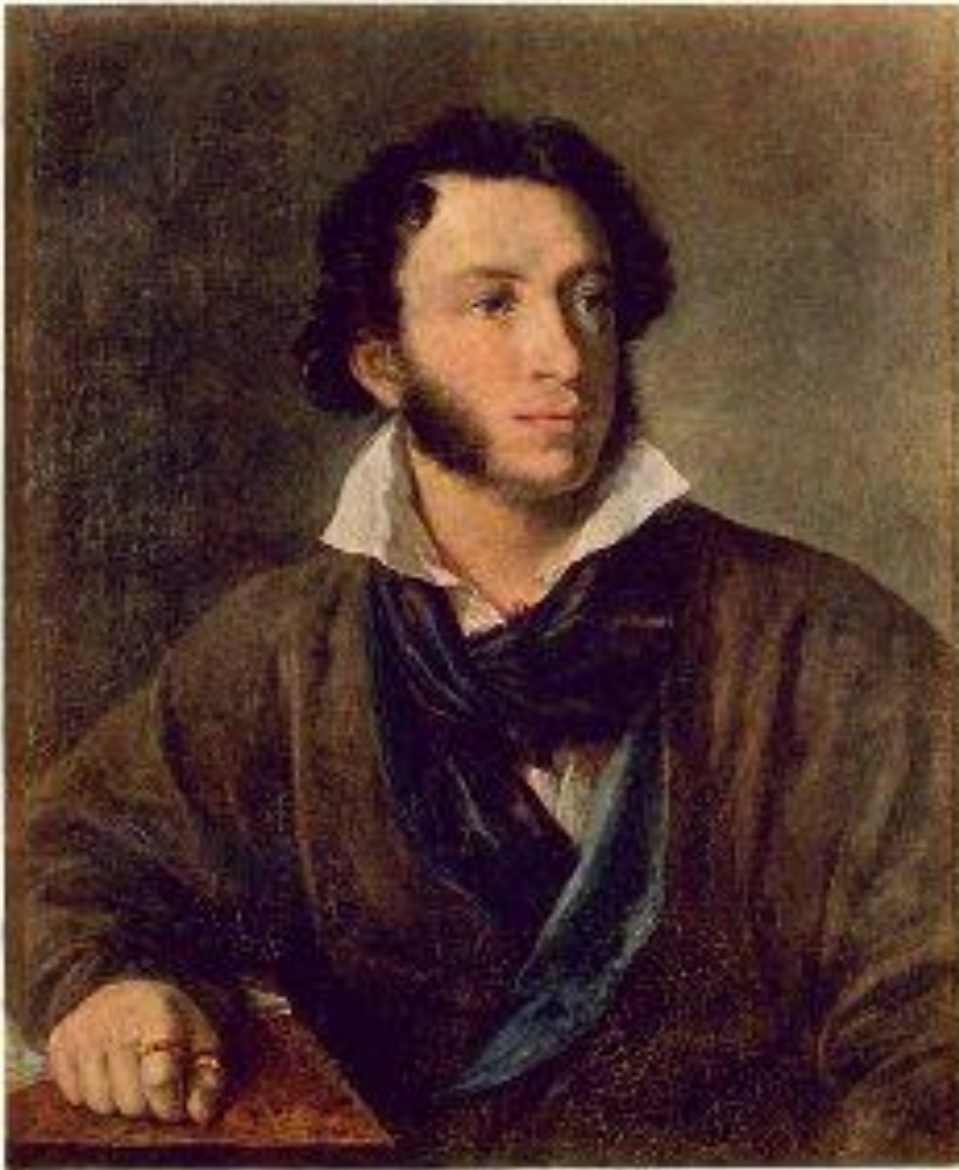
5. В.А.Тропинин. «Портрет А.С. Пушкина». 1827. Романтизм.