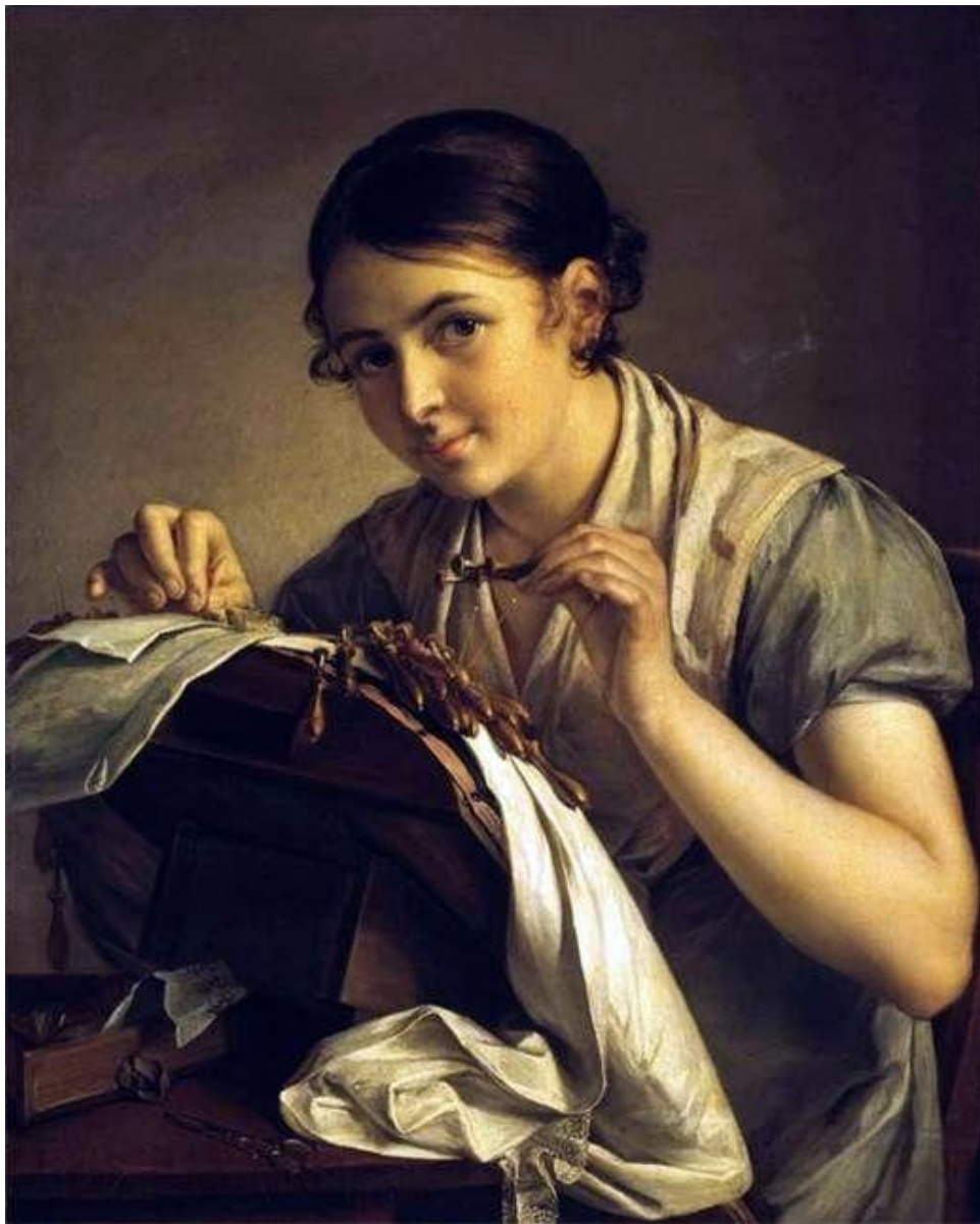
4. В.А.Тропинин. «Кружевница». 1823. Романтизм.