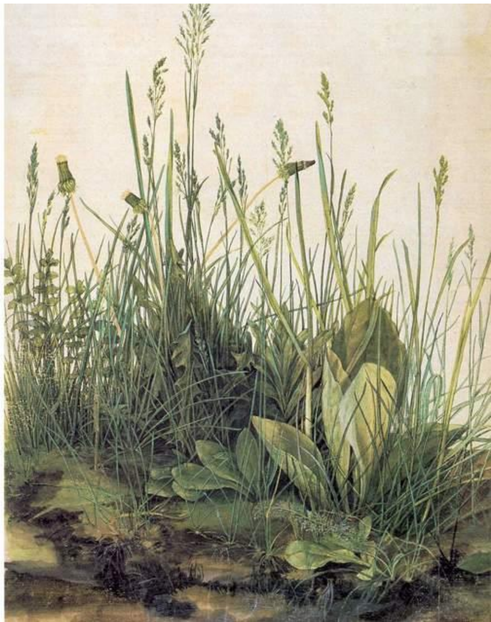
Альбрехт Дюрер. Кусок дерна. 1503

Наряду с новаторствами в области техники исполнения рождались и открытия в подаче евангелистских историй. Представители Северного Возрождения, в число которых входил и Дюрер, еще стремились к пейзажу не ради него самого, но сделали его «тренировочной площадкой» для разработки новых принципов изображения библейских образов.