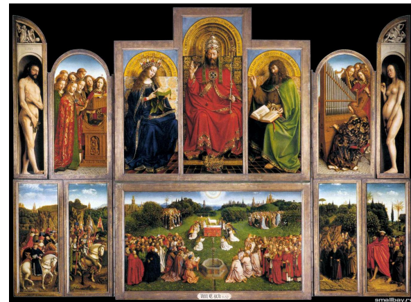
Гентский Алтарь, Ян ван Эйк

Становление нового искусства началось в первой трети XV в. Живописцу Яну ван Эйку безоговорочно принадлежит первенство в нидерландском ренессансе. Главное творение ван Эйка — грандиозный Гентский алтарь — полиптих (т.е. сложенный много раз) для одной из капелл в Генте, в котором выражено новое мировоззрение, новое представление о человеке и вселенной. Образ вселенной создают 12 изображений на наружных створках полиптиха (в закрытом виде) и 14 на внутренних (в раскрытом виде) — небесные сферы, населенные небожителями, и земля с ее долями, лесами, долинами и горами.