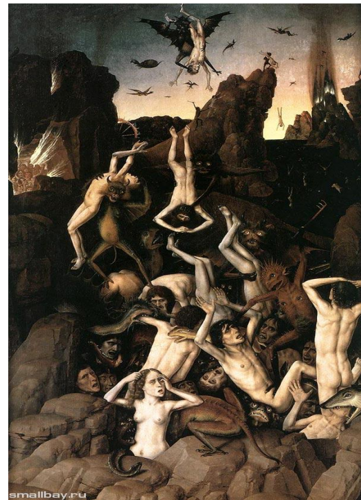
Баутс. Ад, 1450 Музей изящных искусств, Лилль

Нидерландами в XV в. называли земли у берегов Северного моря, где теперь расположены Голландия и Бельгия. Богатые области, объединенные под властью бургундских герцогов, первенствовали среди европейских стран в экономическом и культурном отношении. Рост городов и уклад городской жизни способствовали формированию нового отношения к конкретной повседневной деятельности. Обыденные жизненные явления окружались благоговейным почитанием и ореолом святости: мое дело, моя семья, мой дом, мое имущество, моя капелла, мой святой покровитель. Во всех слоях общества чрезвычайно усилилось стремление к украшению и опоэтизированию повседневности. Нидерландские художники буквально обожествляли каждую травинку своего северного пейзажа, копировали мельчайшие детали быта и во всем этом видели прекрасное.