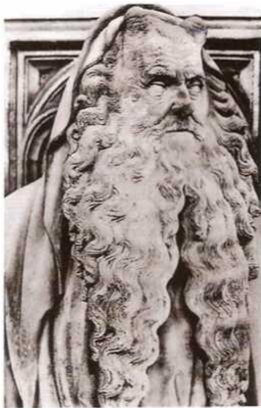
Пророк Моисей. Колодец пророков. 1394–1406. Монастырь Шанмоль, Дижон (Франция)