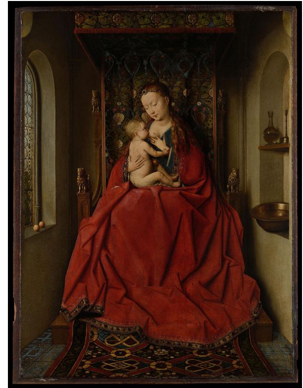
Лукка Мадонна., Ян ван Эйк

Ван Эйку традиционно приписывают изобретение техники масляной живописи. Это не совсем точно, поскольку способ применения растительных масел как связующего вещества для краски был известен и раньше. Но художник усовершенствовал этот способ и впервые применил масляную живопись при создании алтарных картин. Из Нидерландов эта техника постепенно распространилась в Италию и другие страны, вытеснив темперу.