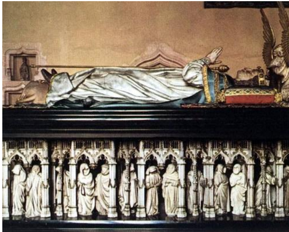
Фигуры плакальщиков для гробницы Филиппа Смелого