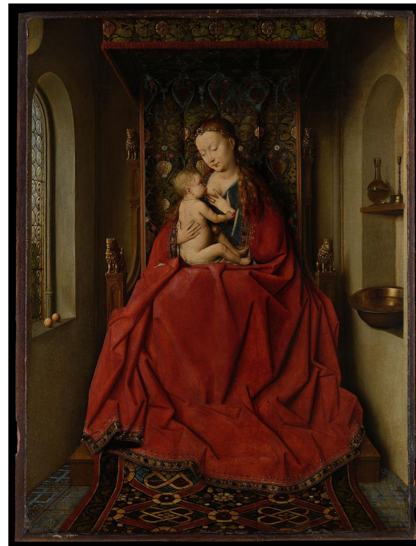
Лукка Мадонна., Ян ван Эйк

Ван Эйку традиционно приписывают изобретение техники масляной живописи. Это не совсем точно, поскольку способ применения растительных масел как связующего вещества для краски был известен и раньше. Но художник усовершенствовал этот способ и впервые применил масляную живопись при создании алтарных картин. Из Нидерландов эта техника постепенно распространилась в Италию и другие страны, вытеснив темперу.