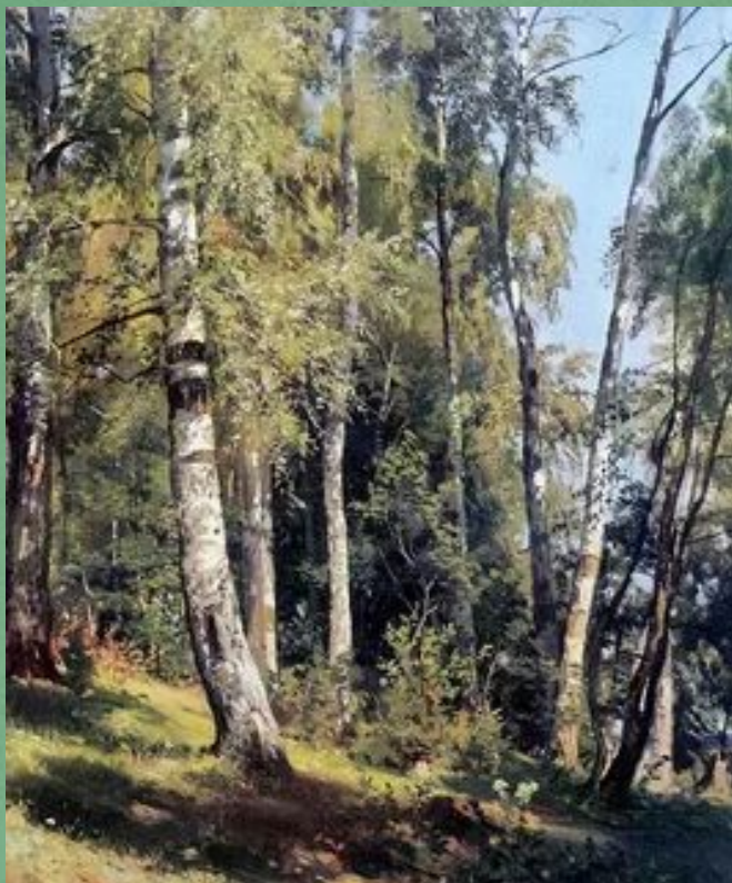
Грабарь И.Э. «Березовая аллея»