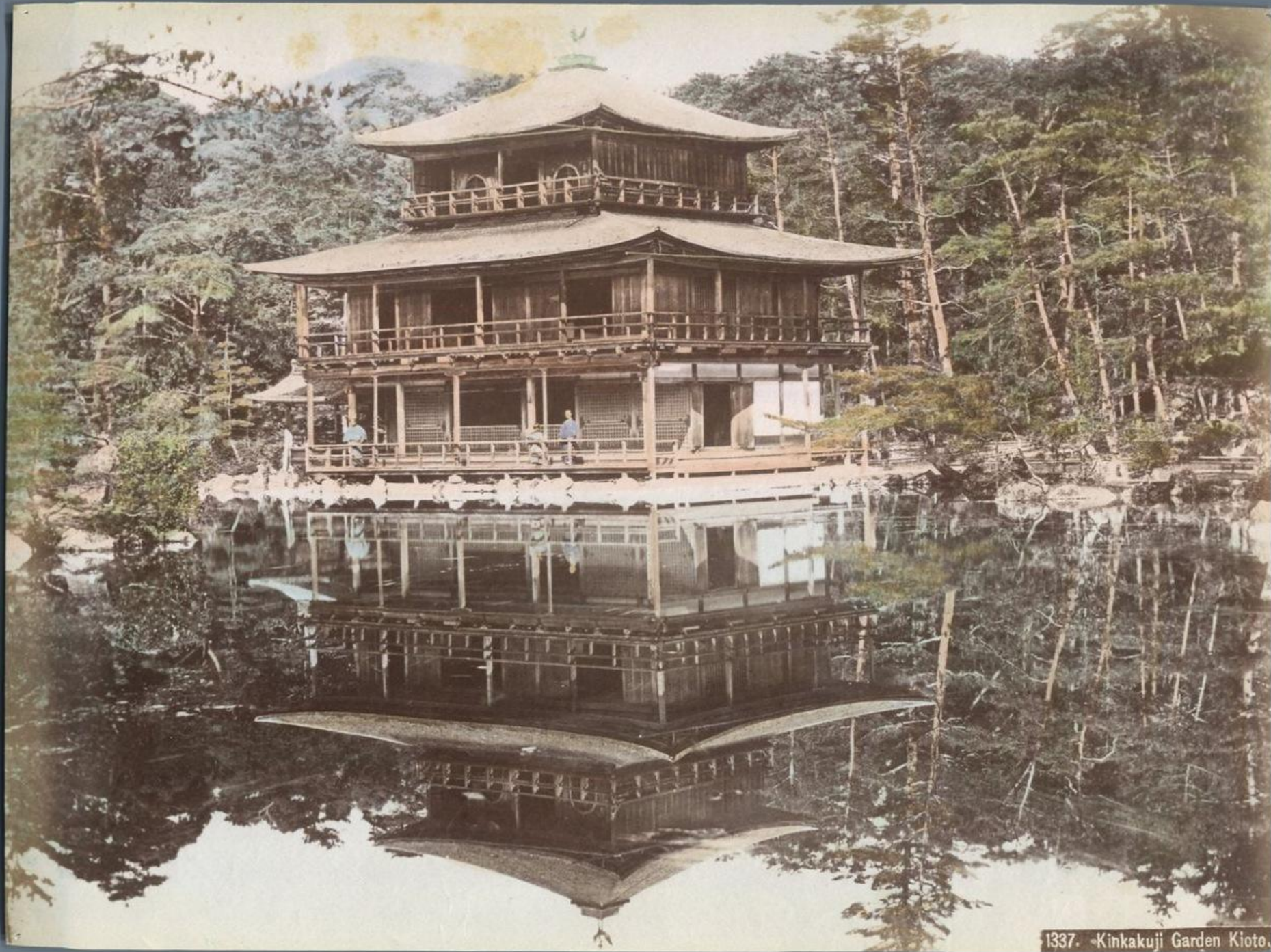
1337. -Kinkakuji Garden Kyoto.