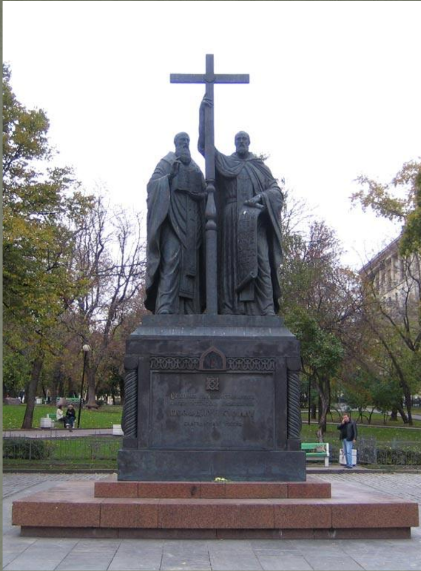
Памятник Кириллу и Мефодию в Москве