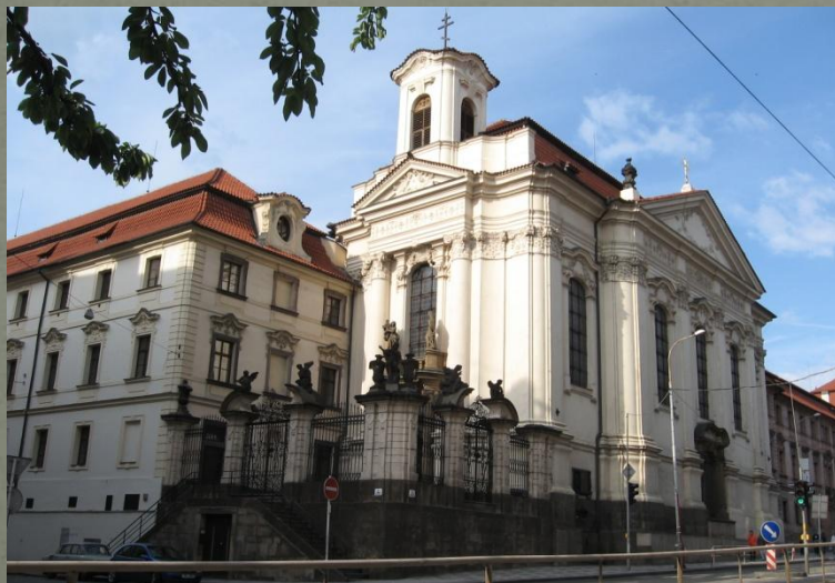
Собор Кирилла и Мефодия в Праге