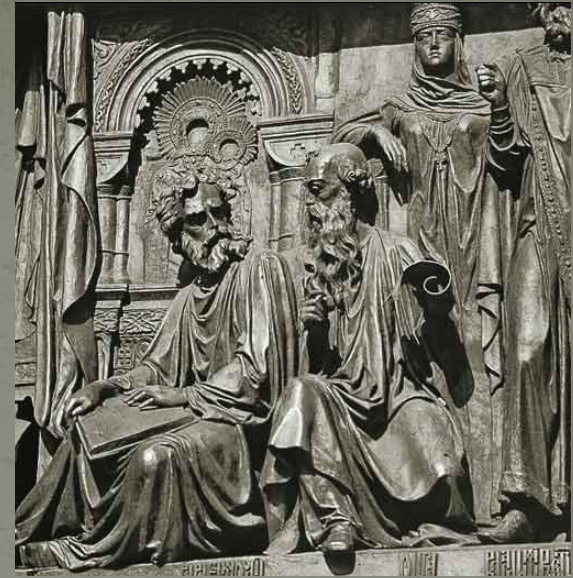
Памятник тысячелетия Крещения Руси