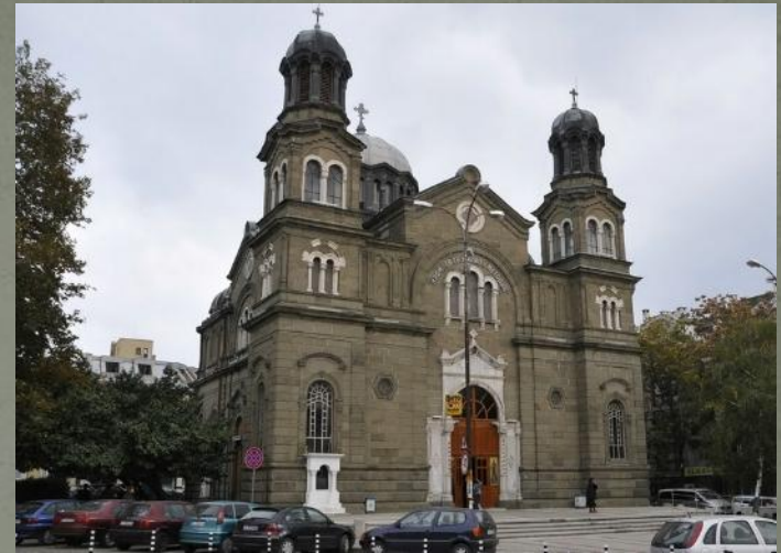
Церковь Кирилла и Мефодия в Болгарии