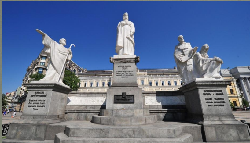
Памятник на Украине