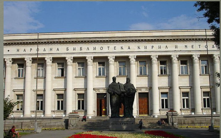
Библиотека в Софии