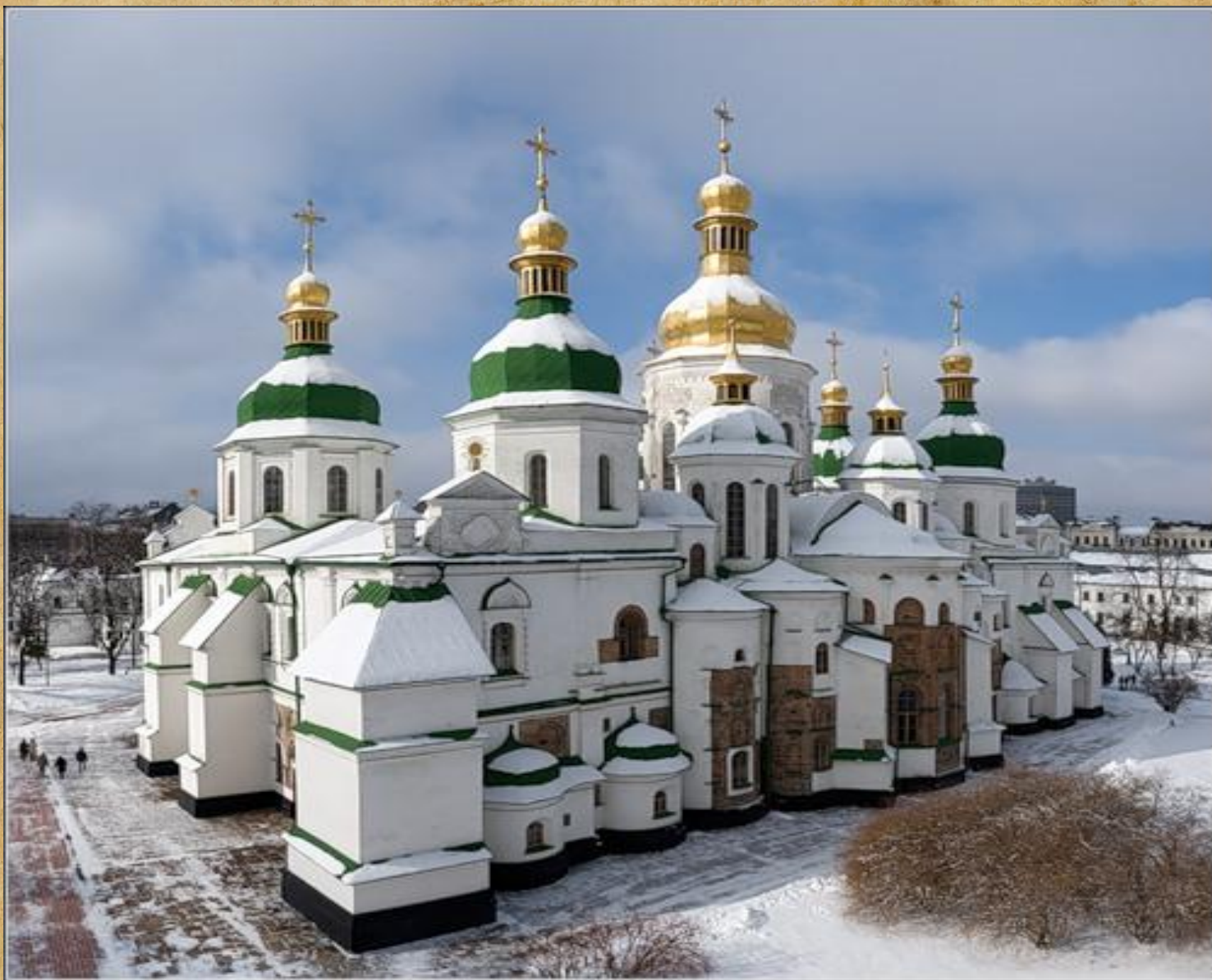
Софийский собор. 1037 год по приказу Ярослава Мудрого.