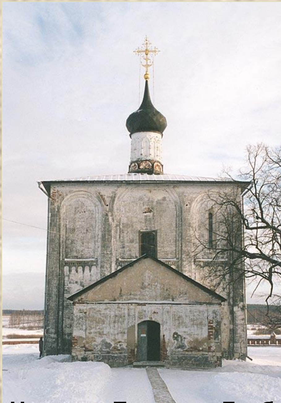
Церковь Бориса и Глеба