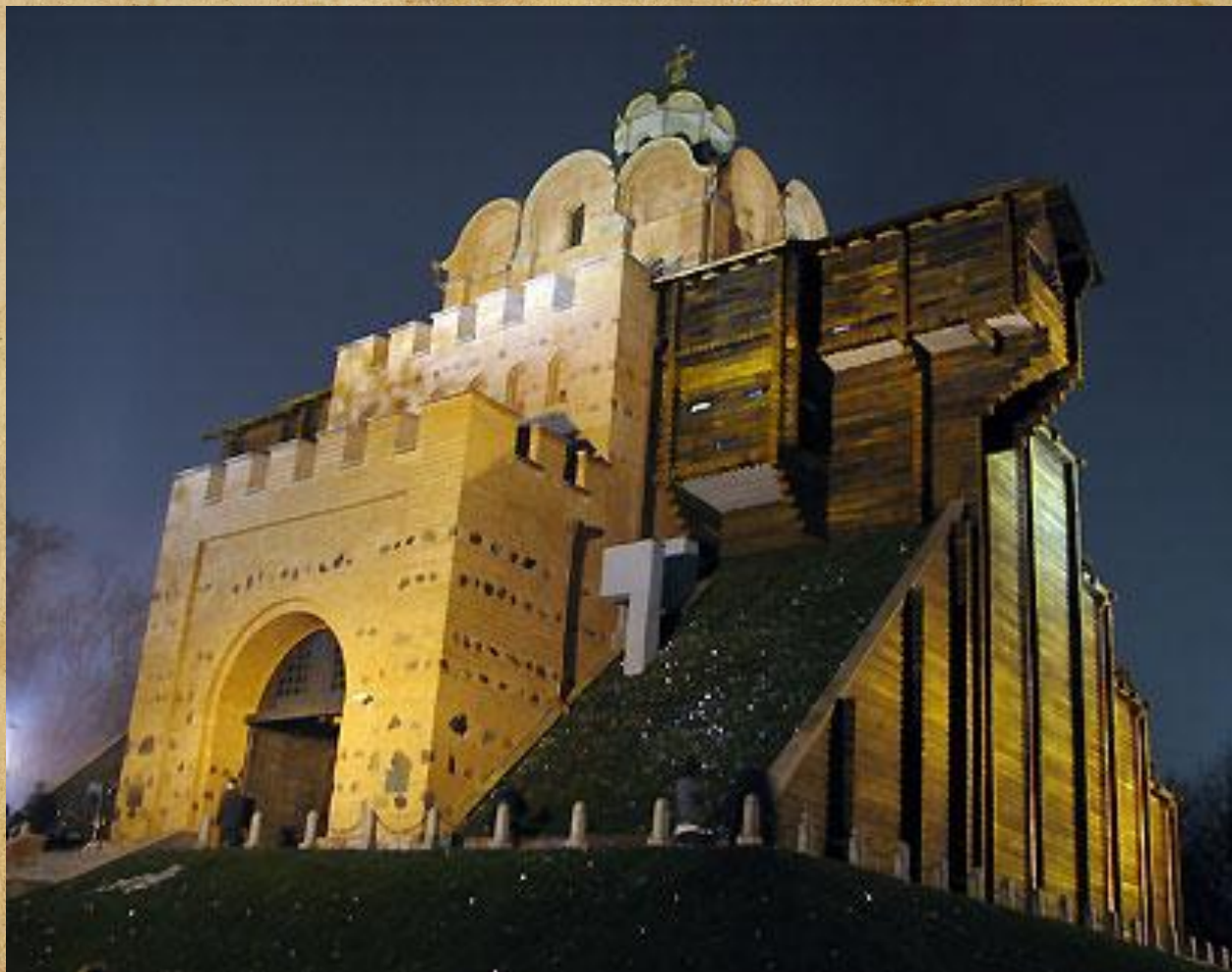
Золотые ворота. 1037 по приказу Ярослава Мудрого.