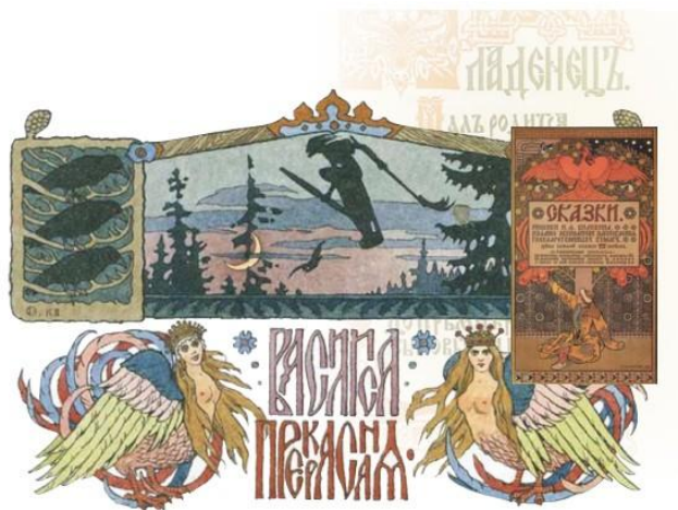
И. Бинабин. Василиска прекрасная