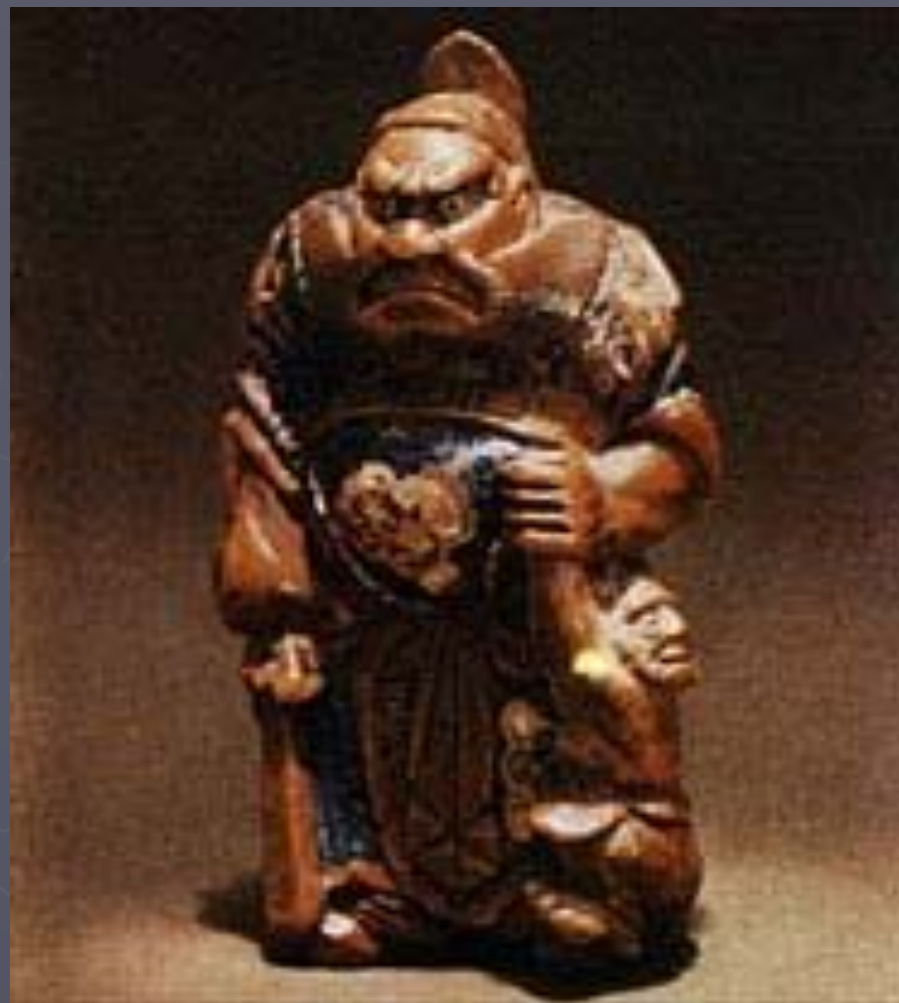
Чжункуй и демон

Распространенные в японском искусстве к. XVII-XIX вв. произведения миниатюрной пластики из дерева , слоновой кости или металла . С помощью нэцкэ (обычно фигурка со сквозным отверстием) к поясу кимоно прикреплялись трубка, кисет и т. д.