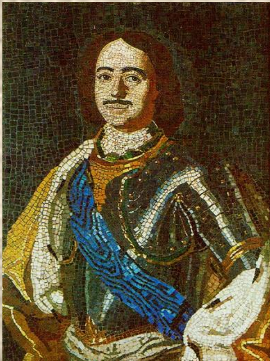
«Портрет Петра I» М. В. Ломоносов