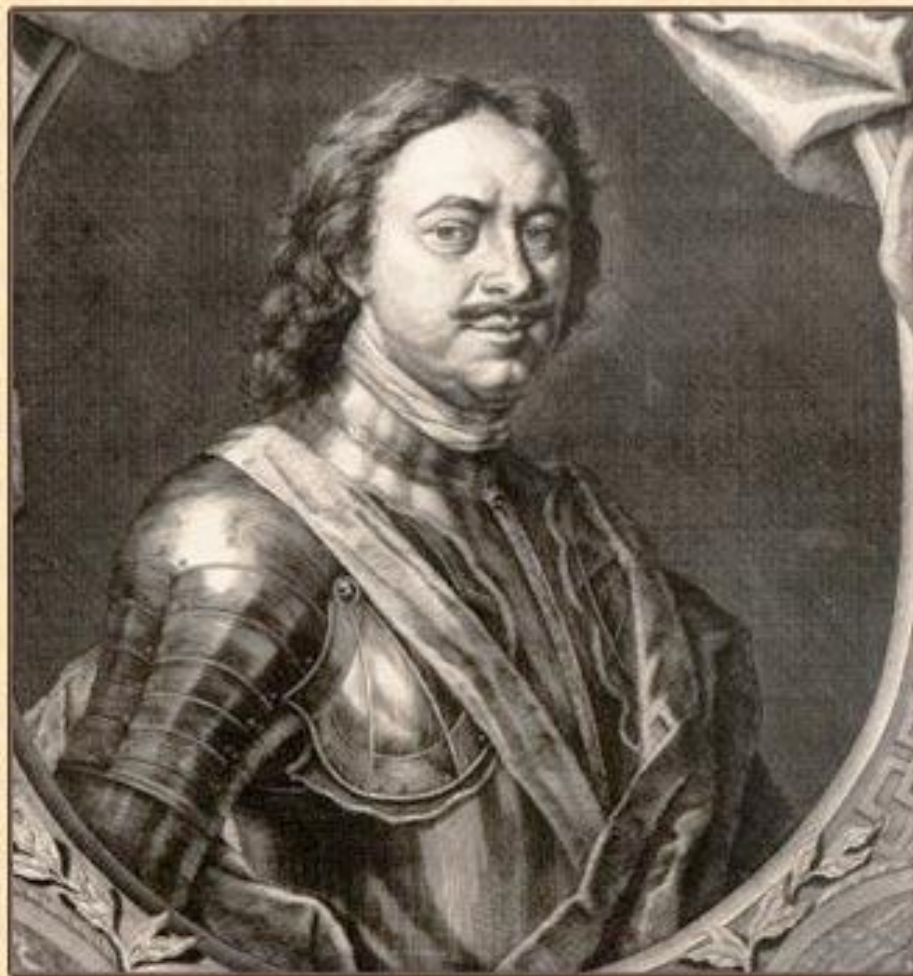
ПЕТР I. КАРЛ МООР. 1717 Г.