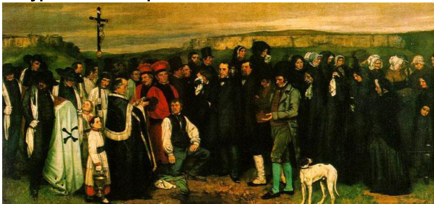
Гюстав Курбе. "Похороны в Орнани". 1849-1850 гг.