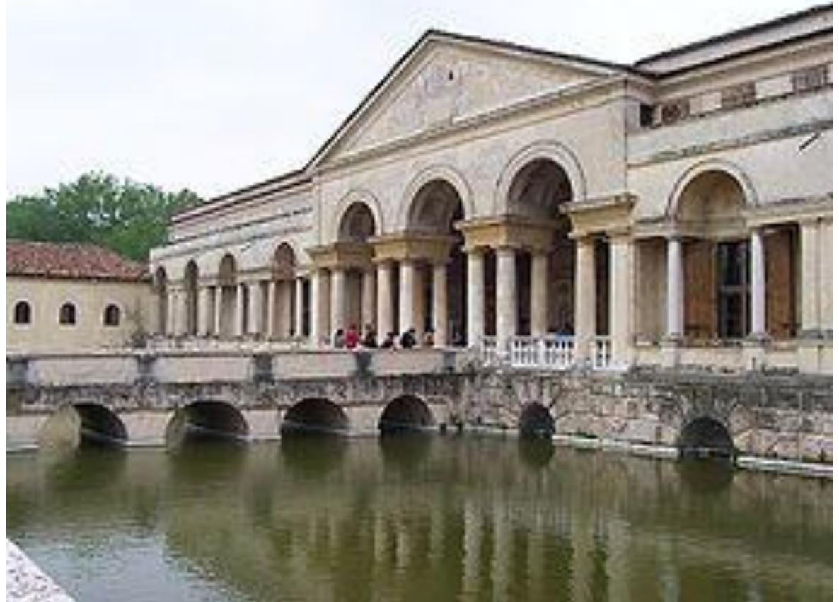
Палаццо дель Те в Мантуе