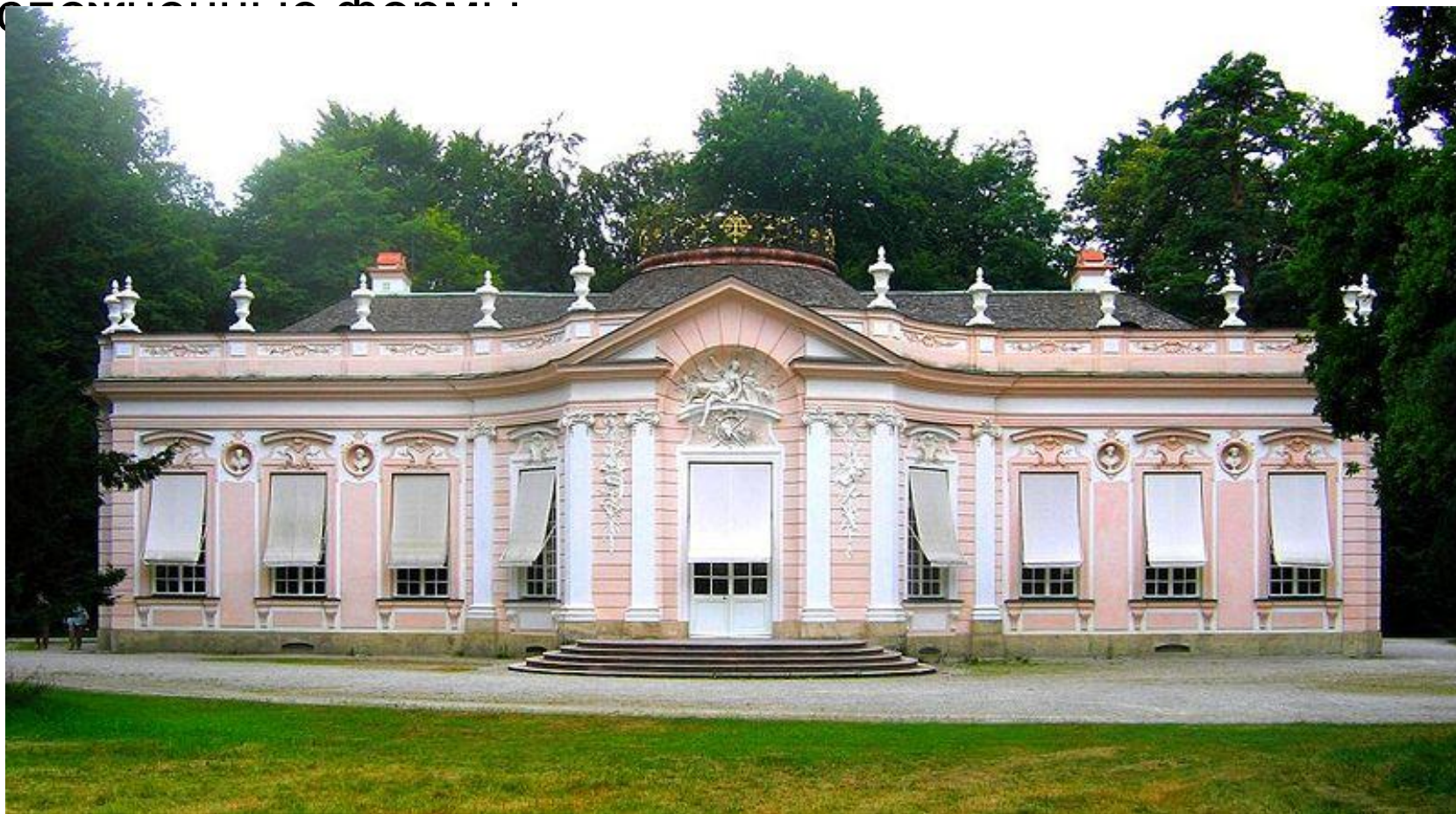
Амалиенбург под Мюнхеном.

Возникшее во Франции, рококо в области архитектуры сказалося главным образом в характере декора, приобретшего подчеркнута изящные, утонченно-устойчивые формы.