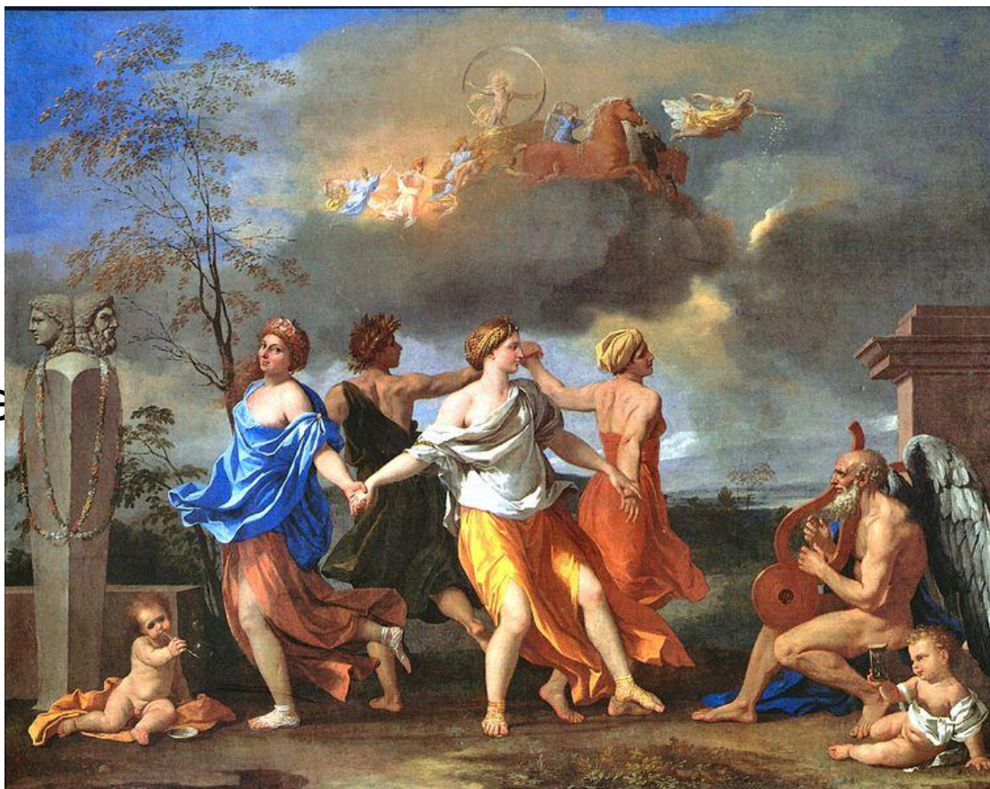
Никола Пуссен «Танец под музыку времени» (1636).

от лат. classicus — «образцовый»-художественное направление в европейском искусстве XVII — XIX вв., ориентированное на идеалы античной классики.