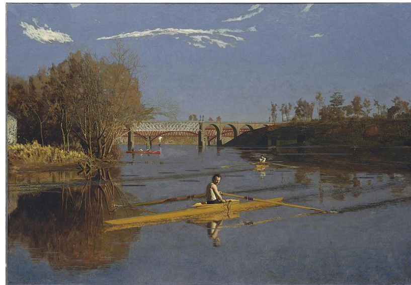
Томас Икинс. «Макс Шмитт в лодке»

Рождение реализма в живописи чаще всего связывают с творчеством французского художника Гюстава Курбе (1819—1877), открывшего в 1855 г. в Париже свою персональную выставку «Павильон реализма». В 1870-е гг. реализм разделился на два основных направления — натурализм и импрессионизм .