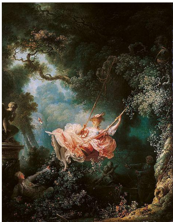
Фрагонар «Качели» (1767)

Образ человека утрачивал самостоятельное значение, фигура превращалась в деталь орнаментального убранства интерьера. Преимущественно декоративный характер имела живопись рококо. Живопись рококо, тесно связанная с интерьером, получила развитие в декоративных и станковых камерных формах.