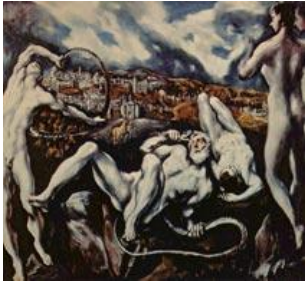
Эль Греко "Лаокоон", 1604-1614

Маньеризм охватывал различные виды художественного творчества – архитектуру, живопись, скульптуру, декоративно – прикладное искусство.