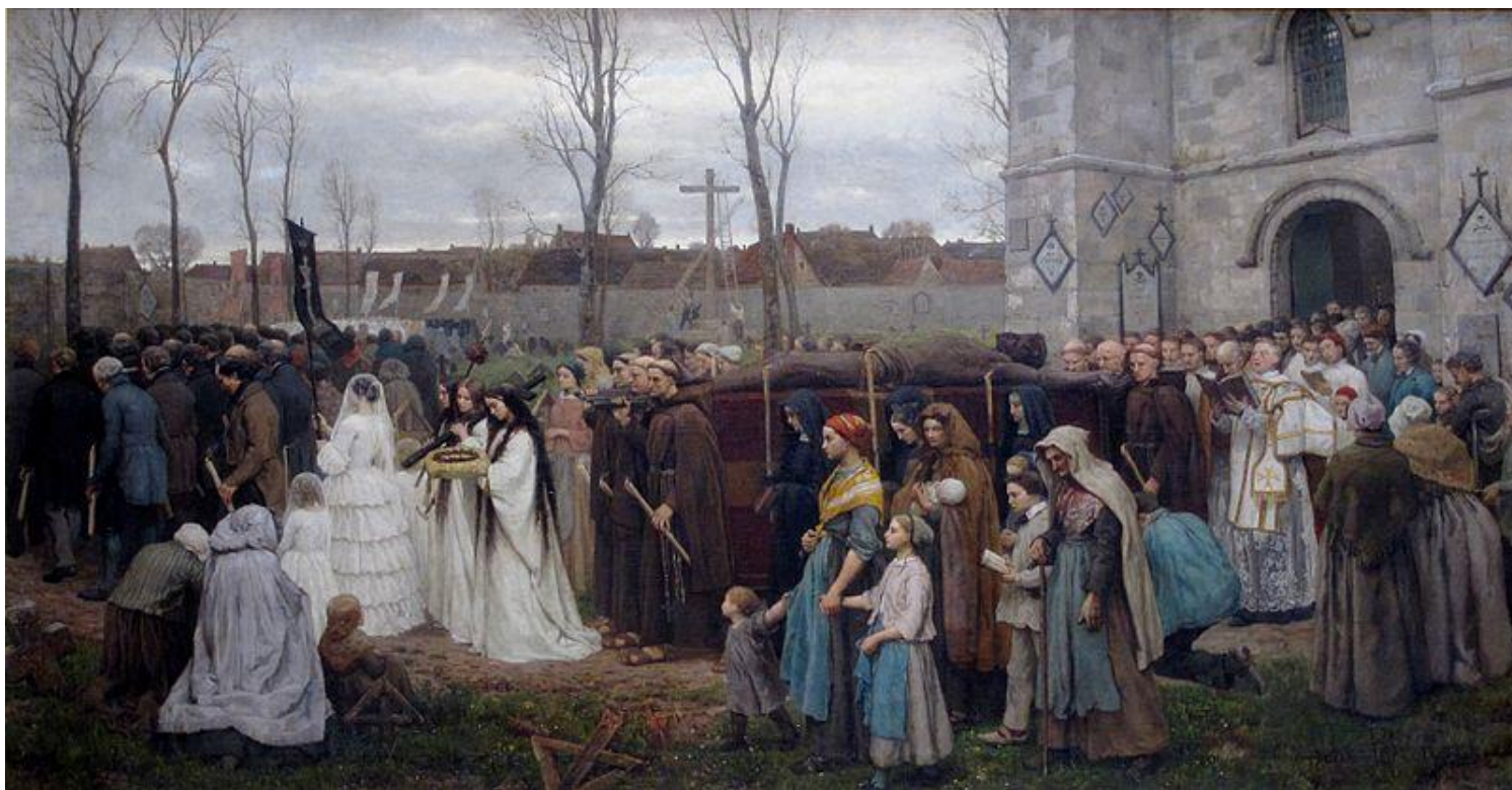
Жюль Бретон. «Религиозная церемония»

Реализм (фр. réalisme , от позднелат. reālis «действительный», от лат. rēs «вещь») — эстетическая позиция, согласно которой задача искусства состоит в как можно более точной и объективной фиксации действительности. Термин «реализм» впервые употребил французский литературный критик Ж. Шанфлёр в 50-х гг.