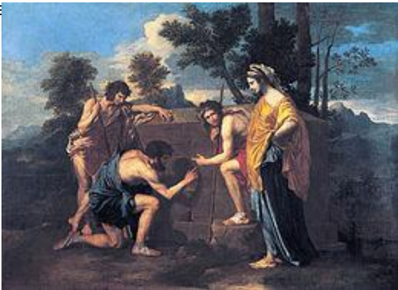
Н. Пуссен «Пастухи Аркадии».1638 -1639 гг. Лувр, Париж

Главными темами искусства классицизма были торжество общественных начал над личными, подчинение чувства долгу, идеализация героических образов