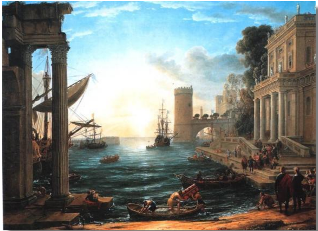
Клод Лоррен «Отплытие царицы Савской»

В живописи главное значение приобрели логическое развертывание сюжета, ясная уравновешенная композиция, четкая передача объема, с помощью светотени подчиненная роль цвета, использование локальных цветов .