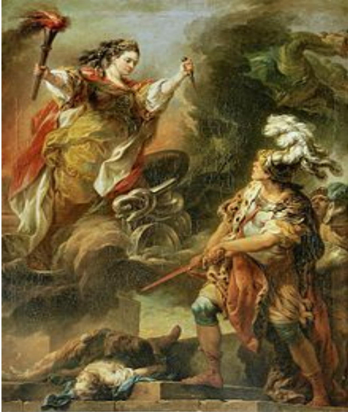
Шарль-Андре ван Лоо «Ясон и Медея»