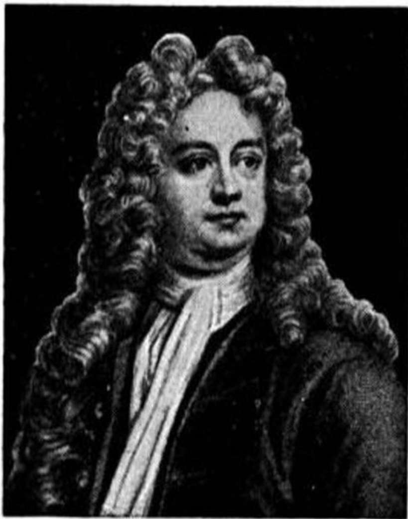
Джорж Лилло (1693—1739)