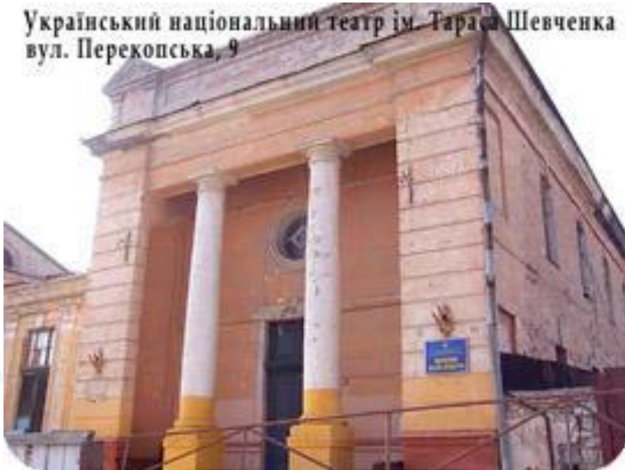
Український національний театр ім. Тараса Шевченка вул. Перекопська, 9