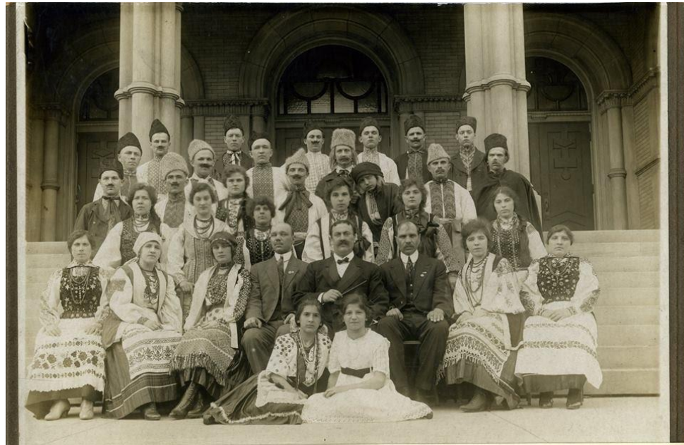
М. Лисенко-Ukrainian Choir, I. Kostiuk director, photo: 1916 Хор Лисенка, дир. І. Костюк, фото: 1916 р.