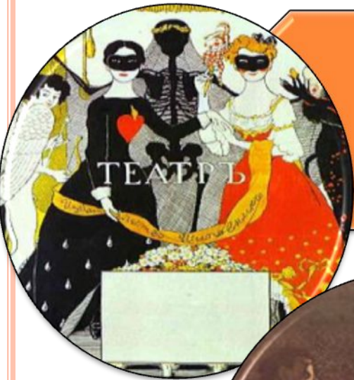
Иллюстрация Константина Сомова для книги Блока «Театр»

▣ Театр — зрелищный вид искусства, представляющий собой синтез различных искусств — литературы, музыки, хореографии, вокала, изобразительного искусства и других и обладающий собственной спецификой: отражение действительности, конфликтов, характеров, а также их трактовка и оценка, утверждение тех или иных идей здесь происходит посредством драматического действия, главным носителем которого является актёр