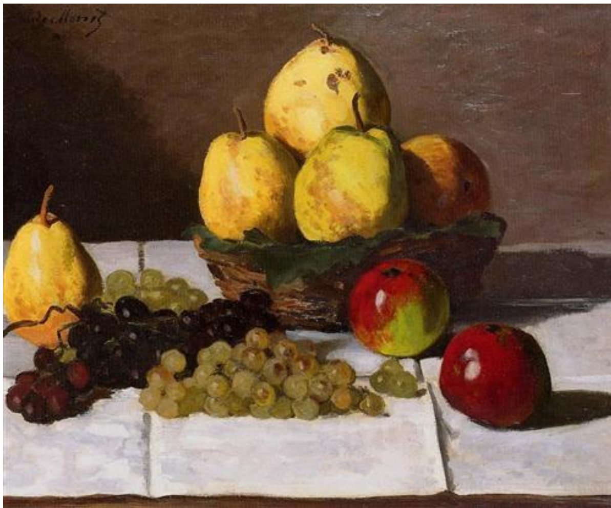
Клод Моне «Натюрморт з грушами та виноградом»