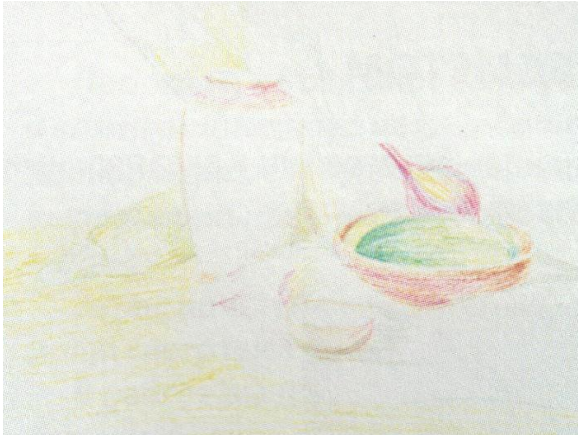
Перший етап роботи