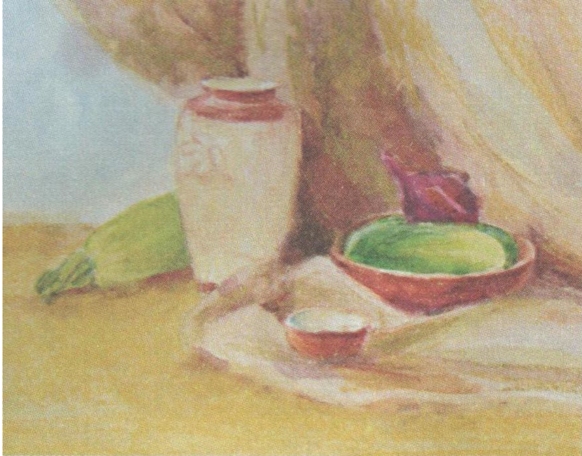
Третій етап роботи