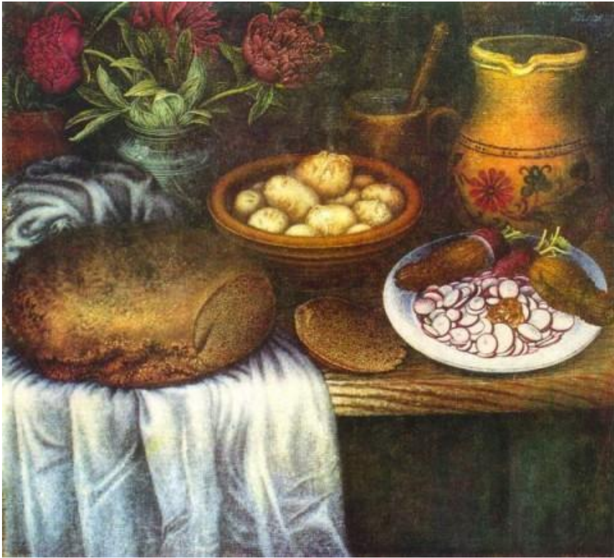
Катерина Білокур «Завтрак»