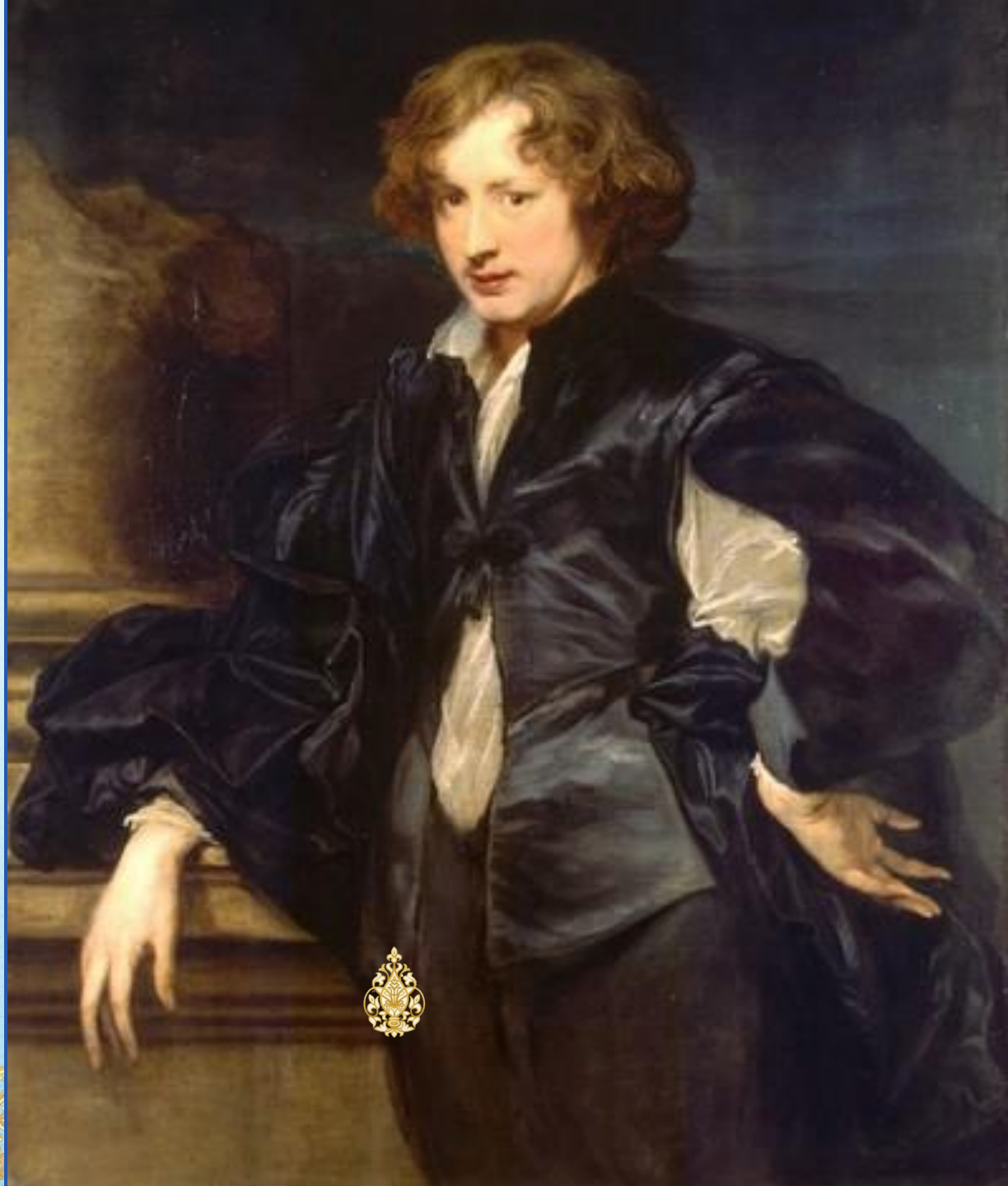
А. ван Дейк. Автопортрет