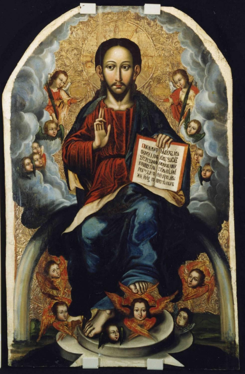
Й. Кондзелевич. Ікона «Спас Вседержитель»