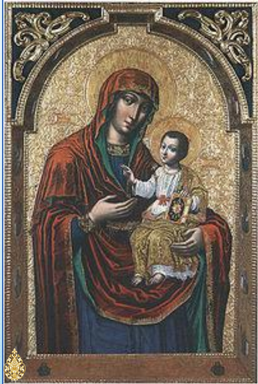
Й. Кондзелевич. Ікона «Богоматір Одигітрія»