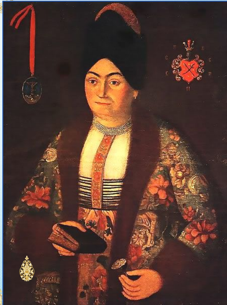
Портрет Параскеви Сулими