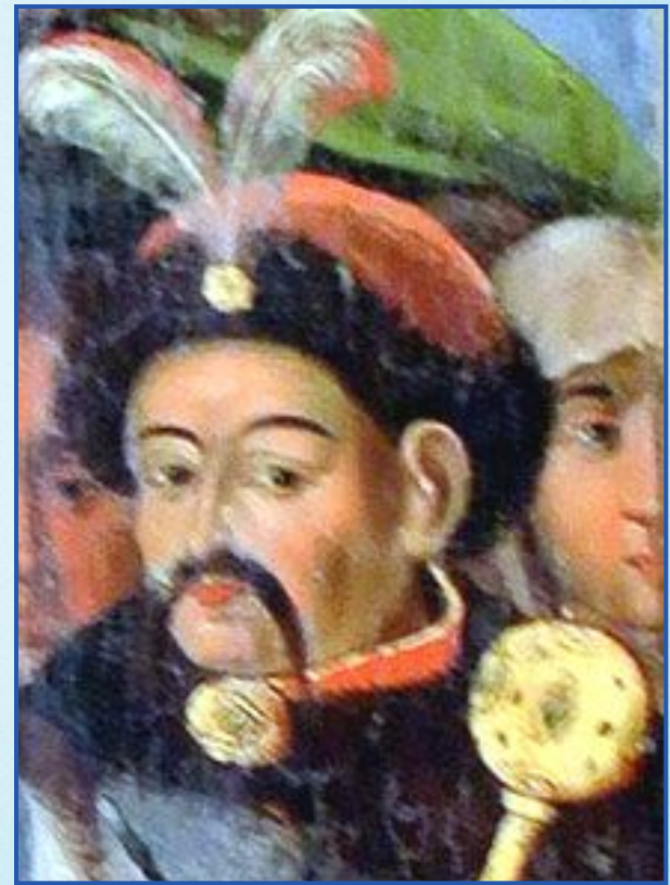
Ікона «Покрова Богородиці» із зображенням Б. Хмельницького