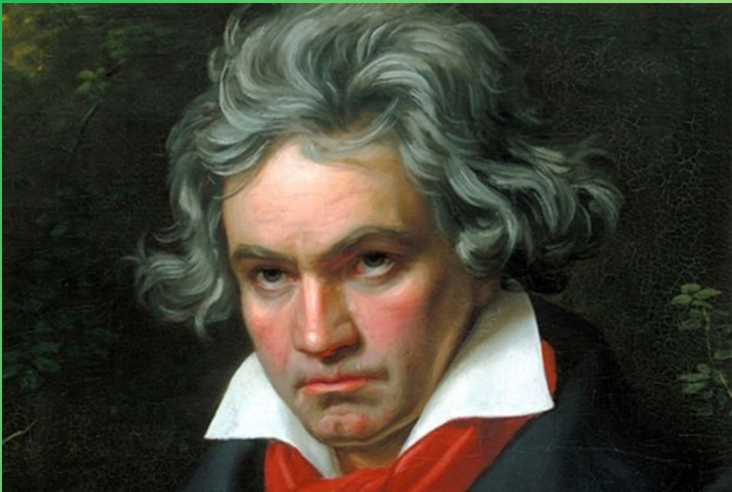
Людвиг Ван Бетховен (1770–1827)