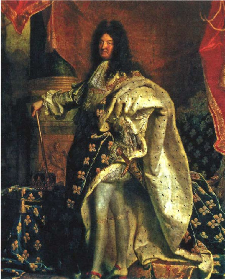
Г. Риго. Портрет Людовика XIV. 1701 г. Лувр, Париж