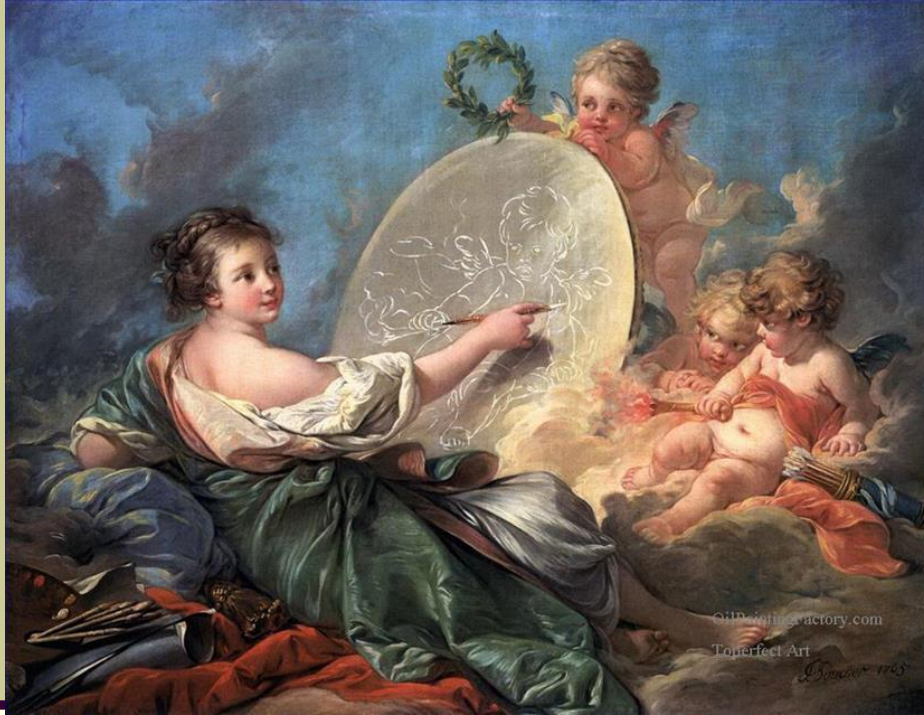
Аллегория изобразительного искусства, 1764 г. - Холст, масло; 103 x 130 см. Рококо. Франция. Вашингтон, Нац. галерея.

Главная цель искусства рококо - доставлять чувственное наслаждение (гедонизм). Искусство должно было нравиться, трогать и развлекать, превращая жизнь в утончённый маскарад и «сады любви». Сложные любовные интриги, мимолётность увлечений, дерзкие, рискованные, бросающие вызов обществу поступки героев, авантюры и фантазии, галантные развлечения и праздники определяли содержание произведений искусства рококо.