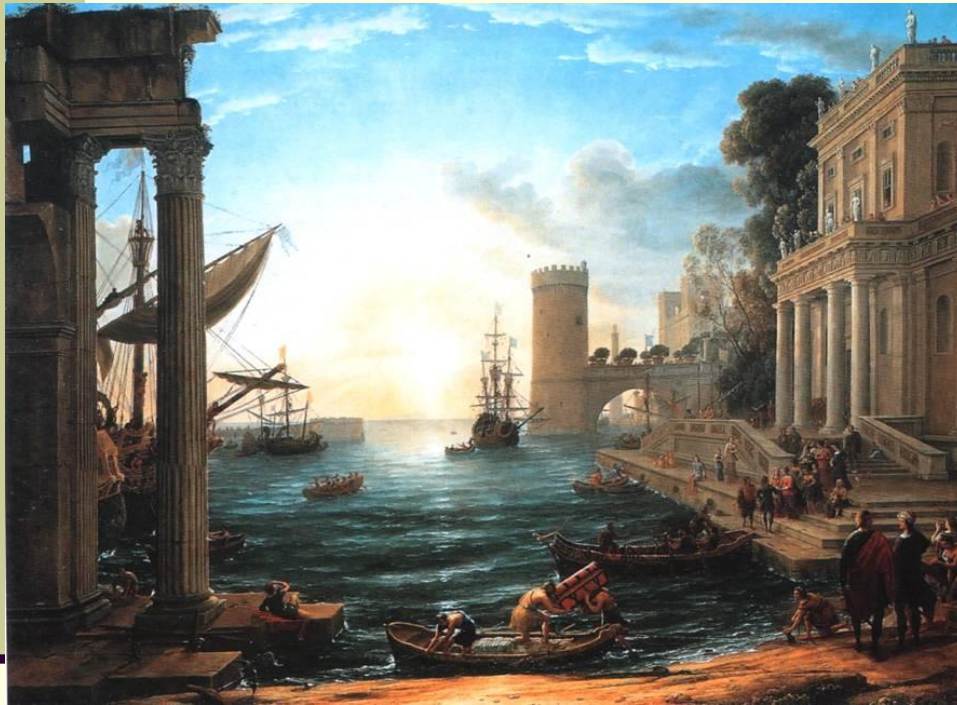
Клод Лоррен. Отплытие царицы Савской (1648). Лондонская Национальная картинная галерея