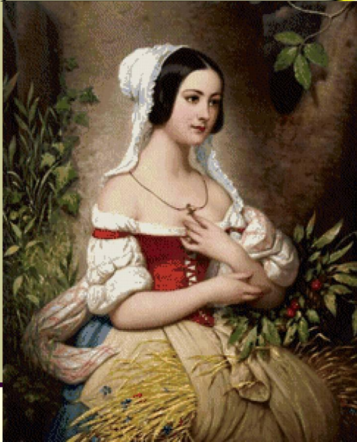
Court Joseph-Desire (Жозе-Дезери Кур). живопись. Франция

Сентиментализм (фр . sentiment - чувство). В мировоззренческом плане он, как и классицизм, опирался на идеи просветительства.