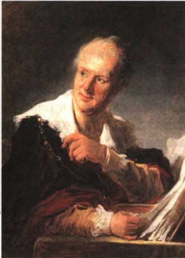
О. Фрагонар. Портрет Дени Дидро. 1765-1769 гг. Лувр, Париж