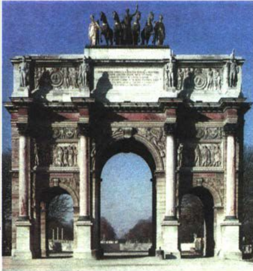
Ш. Персье, П.Ф.Л. Фонтен. Триумфальная арка на площади Каррусель в Париже. 1806 г. (стиль - ампир)

Каждому из видов искусства были присущи свои особенные черты: 1. Основой архитектурного языка классицизма становится ордер (тип архитектурной композиции, использующий определённые элементы и подчиняющийся определённой архитектурно-стилевой обработке), гораздо более близкий по формам и пропорциям к зодчеству Античности.