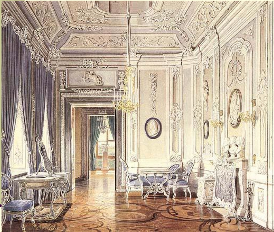
Ринальдиевское рококо: интерьеры Гатчинского замка. г. Гатчина

В 20-е гг. XVIII в. во Франции сложился новый стиль искусства – рококо (фр.rocaille - раковина). Уже само название раскрывало главную, характерную черту этого стиля – пристрастие к изысканным и сложным формам, причудливым линиям, во многом напоминавшим очертания раковины.