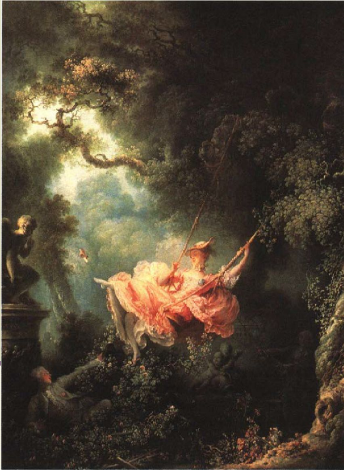
О. Фрагонар. Счастливые возможности качелей. 1766 г. Коллекция Уоллес, Лондон