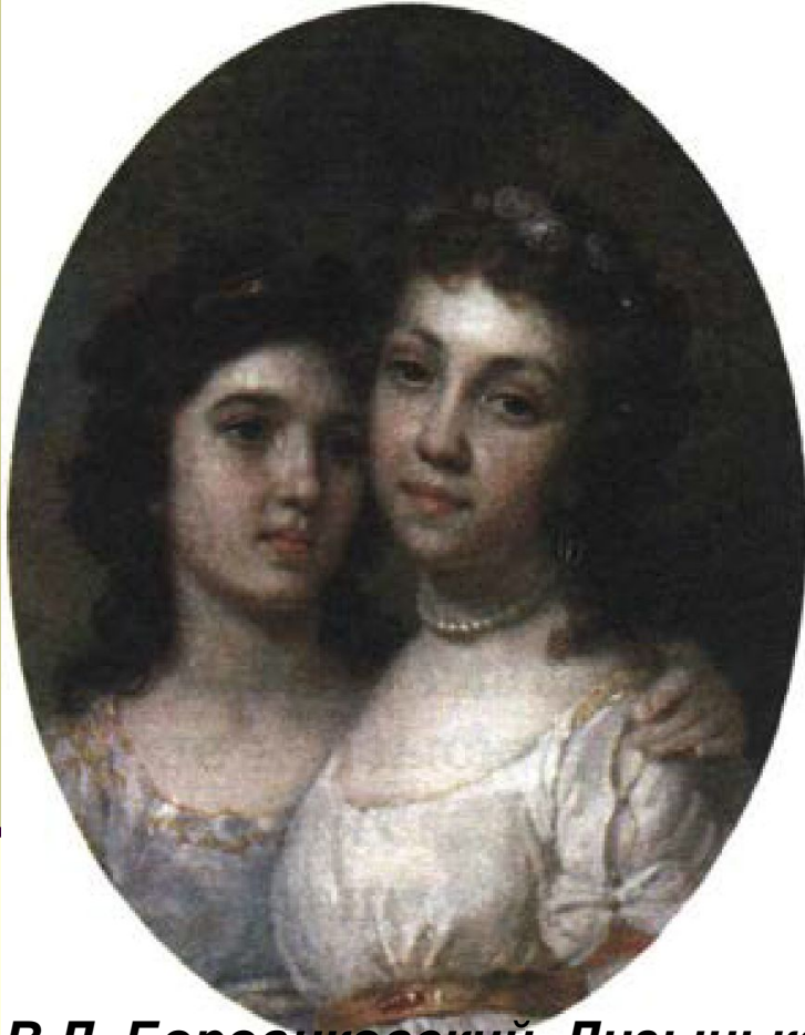
В.Л. Боровиковский. Лизынька и Дашинька. 1794 г. Государственная Третьяковская галерея, Москва

Правомернее всего рассматривать сентиментализм как одно из художественных течений, действовавших в рамках классицизма.