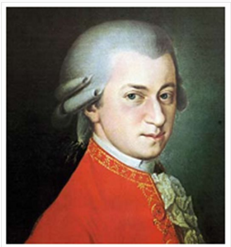
Неизвестный художник. В.А. Моцарт

Портрет любого деятеля культуры и искусства создают прежде всего его произведения: музыка, картины, скульптуры и пр., — а также его письма, воспоминания современников и художественные произведения о нем, возникшие в последующие эпохи.